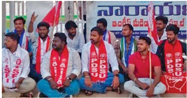
స్కూల్ ఎదుట ధర్నా చేస్తున్న విద్యార్థి సంఘ నాయకులు