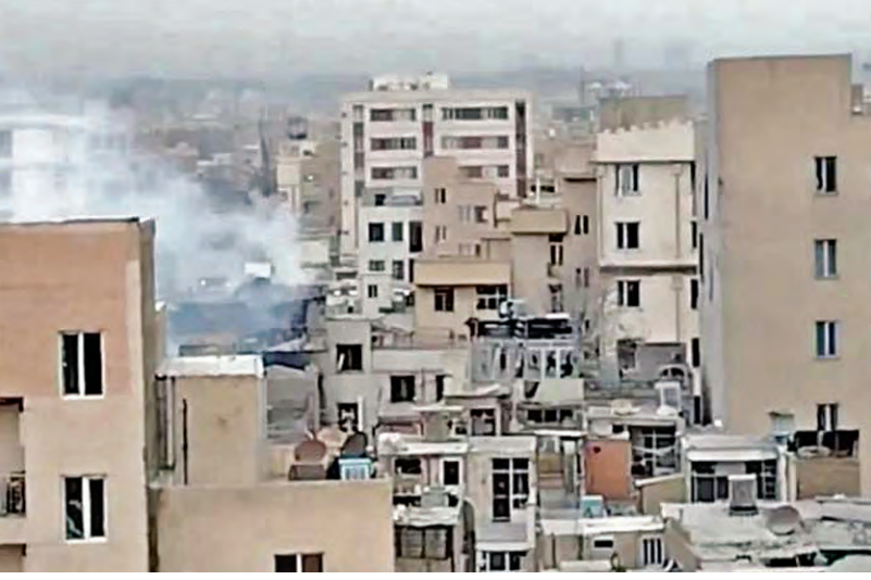
బాబు దారులతో బెత్తెనోటి ఎగిసిన పడుతున్న పాగలు

చెల్లింపులు, హోల్ టెక్స్టాల్లు, పర్యాటక ఫలితాలు విస్తృతంగా ఉపయోగించబడుతున్నాయి. మా పౌరసేవల సంక్షేమ స్కాండ్లు మెరుగుపడుతున్నాయని లోకేష్ తెలిపారు. ఒక మాకు ఇక్కడ రేటింగ్ వచ్చినప్పుడు లోపాలను సరిదిద్దడానికి మేము ఇంటరాక్టివ్ విధానాన్ని ఉపయోగిస్తున్నాము. అయితే, అందరితో పటిష్టమైన డేటా లేకే చాలా కీలకం. డేటా సేట్లు వేర్వేరుగా ఉన్నప్పుడు ఈ ప్రాజెక్ట్ మొదటి 150 సేవలకు మించి విస్తరించలేదు. ప్రతి ప్రక్రియను ప్రశ్నించే అవకాశాన్ని కూడా ఇది అందిస్తుంది. మేము ప్రాసెస్ రిజంజెసివిటీని చేస్తున్నాము. వ్యవస్థను ప్రతిస్పందించే విధంగా కాకుండా చురుకుగా ఉండడానికి ఏ దశలను తొలగించవచ్చు అని ప్రశ్నిస్తున్నాము. ఉదాహరణకు కుల దృవీకరణ వల్లం కోసం, మీరు వ్యక్తిగత దరఖాస్తు చేసుకోవాలి అవసరం ఉండకూడదు. ఇది ఒకసారి వివరాలు ఇచ్చి తర్వాత దానంతట అదే అందించే ఒక ఫ్రెమ్ వర్క్ ఉంటుంది. ఖాకీ చెయ్యని ద్వారా ట్రాక్ అండ్ ట్రేస్ తో ఒక కోడ్ పై ఉంటుంది. ఒక పానుడి డైరెక్షన్ జోన్ లో సాధారణ పౌరసేవల కోసం రాజకీయ నాయకులు, అధికారుల వద్దకు వెళ్లకుండా చేస్తామో ఆ రోజు మనం విజయం సాధించినట్లు అని నేను నా ఇటీ సెక్రటరీకి చెబుతుంటాను. ఇతర రాష్ట్రాలకు మీరు ఎటువంటి సలహా ఇస్తారు? ఆన్లైన్ ప్రశ్నపై నారా లోకేష్ స్పందిస్తూ ఒకటి, బలమైన డేటా లేకే, రెండవది ఇది పూర్ణాభివృద్ధి దీనిని కీలకమైన ప్రాజెక్ట్ అని విశ్వసించే రాజకీయ సంకల్పం. ఇది మేం ప్రజలకు ఇచ్చిన ఒక ఎన్నికల హామీ. దానిని విజయవంతం చేసేందుకు ఎంతో శ్రద్ధ వహించాలి. విభాగాల్లో అలసత్వం రాకుండా చూసేందుకు, ఇది ఎల్లప్పుడూ అత్యున్నత ప్రాధాన్యతగా ఉండేలా మీరు చూసుకోవాలి. ఒక సలహా వచ్చినట్లు తరువాత, మనం పరిష్కారతమ దగ్గరగా ఉండే సమాధానాలు కలిగి ఉంటామని నేను సమ్మతులున్నా అన్నారు.