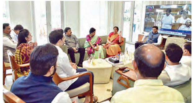
కేంద్ర మంత్రి రామ్మోహన్ నాయుడు ఇంకొక ఎంపీల ఆత్మీయ కలయిక