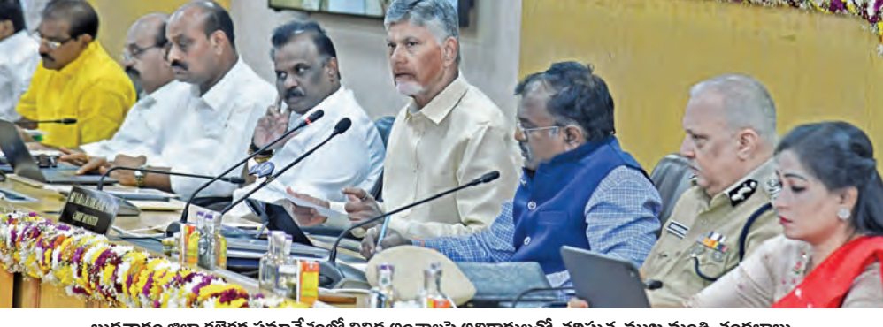
బుధవారం జిల్లా కలెక్టర్ సమావేశంలో వివిధ అంశాలపై అధికారులతో చర్చిస్తున్న ముఖ్యమంత్రి చంద్రబాబు

ఉగాది కానుకగా 2.50 లక్షల లబ్ధిదారులకు సామాజిక గృహప్రవేశాలు దివ్యాంగులకు ఆర్థిసీటిలో ఉచిత ప్రయాణం అధికారుల ఫీల్డ్ విజిట్ పై ప్రత్యేక పోర్టల్ జిల్లా కలెక్టర్ సమావేశంలో సిఎం చంద్రబాబు