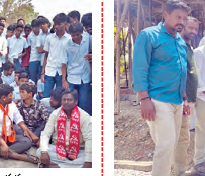
అభివృద్ధి పనులను పరిశీలిస్తున్న కాంగ్రెస్ నాయకులు