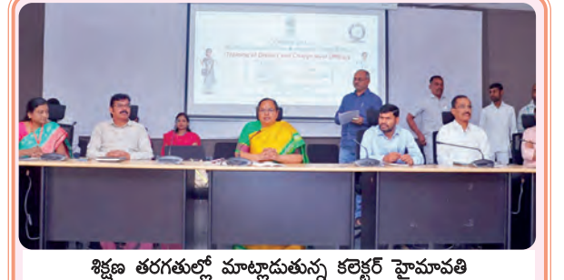
జిల్లా తరగతుల్లో మాట్లాడుతున్న కలెక్టర్