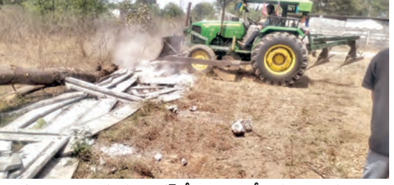
సిమెంట్ పలకలను డ్రాక్టర్ తొలగించజేస్తున్న అధికారులు