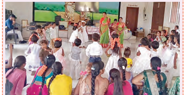
మేదినిపూర్తి రైతు వేదికలో నృత్యం చేస్తున్న బాలులు

కొండపాక, మార్చి 11, ప్రభాతవార్త: కుకునూరుపల్లి మండల పరిషత్లోని మేదినిపూర్తి రైతువేదికలో బుధవారం అంగన్వాడీ కేంద్రం అధ్యక్షురాలి బాలమేక ఉత్సవాలను నిర్వహించారు. ఈ సందర్భంగా విద్యార్థులు ప్రదర్శించిన అలహులు, ముద్దులోలికే పాటలు సందర్భకును అలరించాయి. బిచ్చారల సృజనాత్మకతను వెలికితీసేలా ఏర్పాటుచేసిన వార్డులు, బొమ్మల ప్రదర్శన ప్రత్యేక ఆకర్షణగా నిలిచాయి. అంగన్వాడీ బీచ్, తల్లిలకు బోన్సై కాఫీలో పరిశుభ్రత, బిల్లు ఆలోచన అవగాహన కల్పించారు. కార్యక్రమంలో అంగన్వాడీ బీచ్, అయ్యలు, విద్యార్థులు, గ్రామస్థులు పాల్గొన్నారు.