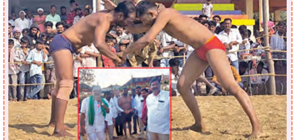
కన్నీపడుతున్న మల్లయోధులు నిర్మలలో బహుమతిని అందజేస్తున్న దృశ్యం

టేక్వాల, మార్చి 11, ప్రభాతవార్త: టేక్వాలలో దుర్గమ్మ, పోవమ్మ జాతర ఉత్సవాలలో భాగంగా కన్నీ పోటీలను నిర్వహించారు. ప్రతి ఏట హోళి పండుగ తర్వాత ఐదవ రోజు నుంచి ఐదు రోజుల పాటు దుర్గమ్మ, పోవమ్మ జాతర ఉత్సవాలను నిర్వహించడం ఆనవాయితీగా నిర్వహిస్తున్నారు. మొదటి రోజున బోనాలూ, రెండవ రోజున బండ్ల ఊరేగింపు, మూడవ రోజున బంది శిబి కార్యక్రమాలను నిర్వహించారు. వార్షిక లోకైత బుధవారం ఉదయం అమ్మవార్డుకు ప్రత్యేక పూజలు నిర్వహించారు. ఆనంతరం మధ్యాహ్నం నుంచి కన్నీపోటీలు ప్రారంభమయ్యాయి. పోటీలకు రాష్ట్రంలోని పలు జిల్లాలలోపాటు ధొంగు రాష్ట్రాలైన కర్ణాటక, మహారాష్ట్ర నుంచి మల్లయోధులు హాజరయ్యారు. కేరళలో మధ్య కత్తా హాంగా జరిగిన ఈ పోటీల్లో మల్లయోధులు తలపడ్డారు. వివిధ కేటగిరీలో గెలుపొందిన మల్లయోధులకు నగదు బహుమతులను అందజేశారు.