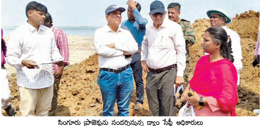
సింగుల ప్రాజెక్టును సందర్శిస్తున్న ద్వారా సీసీ అధికారులు