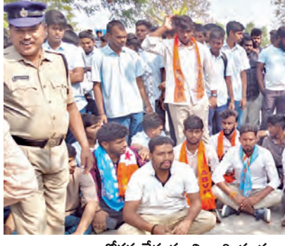
అందోళన చేస్తున్న విద్యార్థుల సంఘం నాయకులు

పరంగా మరింత ఘనంగా నిర్వహిస్తామని తెలిపారు. ప్రస్తుత ఆంధ్రప్రదేశ్ ఉన్న బంజారా భవన్ నిర్మాణాన్ని పూర్తి చేయించే బాధ్యత తనదేనని హామీ ఇచ్చారు. రాజకీయాలకు అతీతంగా సంఘం వ్యక్తంగా సమస్యలను పరిష్కరించుకోవాలని పిలుపునిచ్చారు. భవిష్యత్తులో ప్రభుత్వం జిల్లా సరిహద్దులను పునర్వ్యవస్థీకరించినప్పుడు హుస్సాబాద్ ప్రాంత ప్రజల అభివృద్ధిని గౌరవించి నిర్ణయం తీసుకుంటామని మంత్రి తెలిపారు. ఈ కార్యక్రమాన్ని పూర్తి చేయించే బాధ్యత తనదేనని హామీ ఇచ్చారు. రాజకీయాలకు అతీతంగా సంఘం వ్యక్తంగా సమస్యలను పరిష్కరించుకోవాలని పిలుపునిచ్చారు. భవిష్యత్తులో ప్రభుత్వం జిల్లా సరిహద్దులను పునర్వ్యవస్థీకరించినప్పుడు హుస్సాబాద్ ప్రాంత ప్రజల అభివృద్ధిని గౌరవించి నిర్ణయం తీసుకుంటామని మంత్రి తెలిపారు. ఈ కార్యక్రమాన్ని పూర్తి చేయించే బాధ్యత తనదేనని హామీ ఇచ్చారు. రాజకీయాలకు అతీతంగా సంఘం వ్యక్తంగా సమస్యలను పరిష్కరించుకోవాలని పిలుపునిచ్చారు. భవిష్యత్తులో ప్రభుత్వం జిల్లా సరిహద్దులను పునర్వ్యవస్థీకరించినప్పుడు హుస్సాబాద్ ప్రాంత ప్రజల అభివృద్ధిని గౌరవించి నిర్ణయం తీసుకుంటామని మంత్రి తెలిపారు.