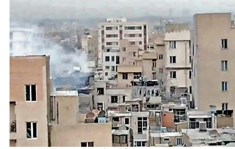
బాంబు దాడులతో దిక్షాన్ లో ఎగిసినవతున్న పాగలు