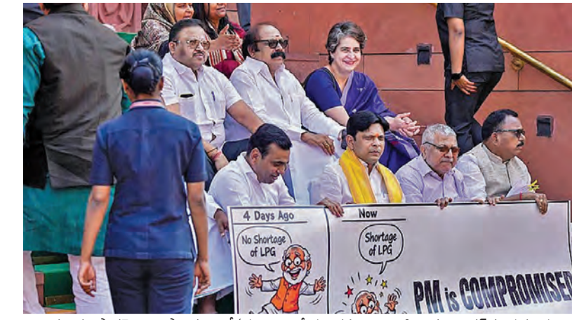
బుధవారం పార్లమెంటు ప్రాంగణంలో 'ప్రధాని రాజే పద్మా..'. అని రానీ ఉన్న బ్యానర్ ను ప్రదర్శిస్తూ ఆందోళన చేస్తున్న ఎంపీలు ప్రియాంకా గాంధీ, హిదీ కహేద్, మాజీకం రాగం తదితరులు