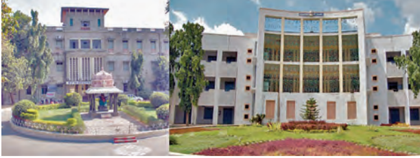
తిరుమల,మార్చి 11 ప్రభాతవార్తాప్రతినిధి:

విజయవాడ,మార్చి 11.ప్రభాతవార్తాప్రతినిధి: రాష్ట్రంలో ఎల్వీజీ సిలిండర్లు ఎటువంటి కొరత లేదని ఏపీ సిఎం చంద్రబాబు స్పష్టం చేశారు. పాతకాలలు, అసృత్రులకు అంతరాయం లేకుండా ఎల్వీజీ సరఫరా జరగాలని ఆయన జిల్లా కలెక్టర్లకు సందర్భంలో అధికారులను ఆదేశించారు.వారందించిన వివరాలను ఆనుపరించి ఎల్వీజీ ప్రస్తుతం ఎక్కడా కొరత లేదని సీఎం తెలిపారు. కేంద్రంలో మాట్లాడి ఇబ్బందులు రాకుండా చూడాలి అధికారులను ఆదేశించి కేంద్రం,రాష్ట్రం మధ్య సమన్వయం అవసరం మన్నారు. యుద్ధ ప్రభావంతో ఏమైనా ఇబ్బందులు ఎదురైతే తక్షణం చక్కదిద్దేలా చర్యలు తీసుకోవాలన్నారు..,గుడ్లు, అరటి లాంటి ఉత్పత్తులకు