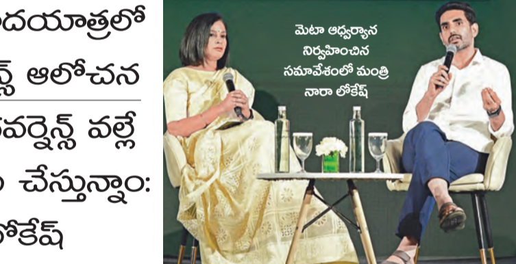
మెటా ఆర్గనైజేషన్ నిర్వహించిన సమావేశంలో మంత్రి నారా లోకేశ్

యువగళం పాదయాత్రలో వాల్టాప్ గవర్నెన్స్ ఆలోచన రియల్ టైం గవర్నెన్స్ వల్లే ఈజీగా అమలు చేస్తున్నాం: మంత్రి లోకేశ్