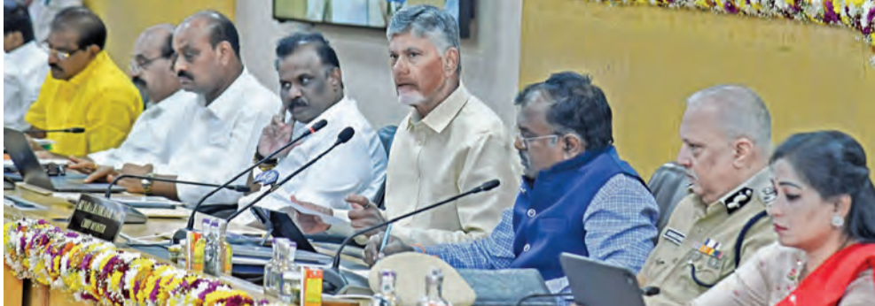
బుధవారం జిల్లా కలెక్టర్ల సమావేశంలో వివిధ అంశాలపై లభికారులతో చర్చిస్తున్న ముఖ్యమంత్రి చంద్రబాబు

ఉగాది కానుకగా 2.50 లక్షల లబ్ధిదారులకు సామూహిక గృహప్రవేశాలు దివ్యాంగులకు ఆర్థిసీలో ఉచిత ప్రయాణం లభికారుల ఫీల్డ్ విజిట్లపై ప్రత్యేక పోర్టల్ జిల్లా కలెక్టర్ల సమావేశంలో సిఎం చంద్రబాబు