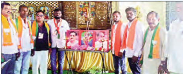
నర్సేట్ల, మార్చి 11 ప్రభాతవార్త :