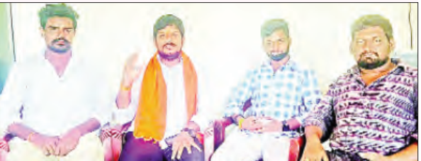
చందూరు, మార్చి 11, ప్రభాతవార్త: