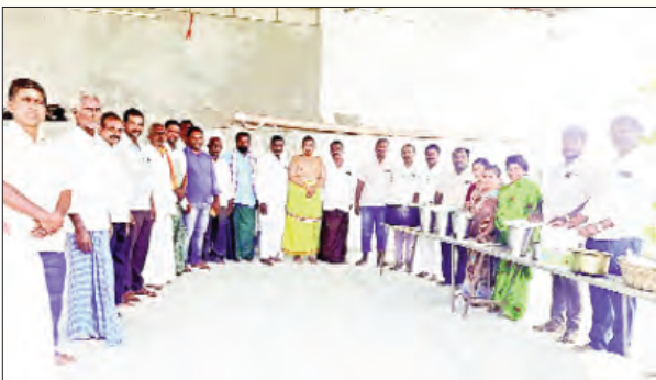
అనంతగిరి మార్చి 11 ప్రభాత వార్త: