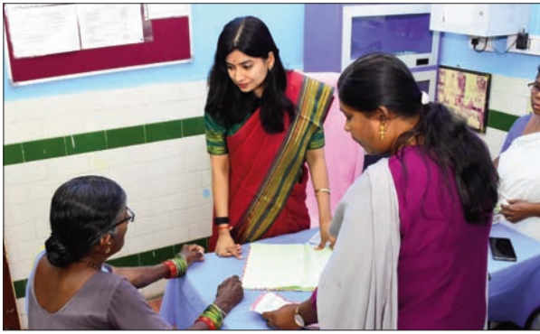
వ్యాధులు, పరిసరాల పరిశుభ్రతపై వివరించాలని తెలిపారు. గర్భిణులకు క్రమం తప్పకుండా వైద్య పరీక్షలు నిర్వహించాలని ఆదేశించారు. ఎండాకాలం నేపథ్యంలో ప్రజలకు జాగ్రత్తలు తెలుపాలని సూచించారు.