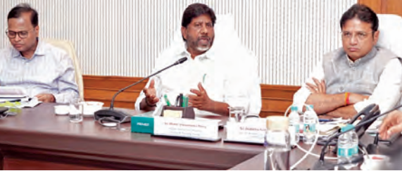
గురువారం సచివాలయంలో హోం మంత్రిత్వ శాఖ ఉన్నతాధికారులతో ప్రేమబట్టి సమీక్ష సమావేశం నిర్వహిస్తున్న డిప్యూటీ సీఎం భట్టి తదితరులు

హైదరాబాద్, మార్చి 12 ప్రభాతవార్త: మరో మూడు రోజుల్లో అసెంబ్లీ సమావేశాలు ప్రారంభం కానున్న నేపథ్యంలో ప్రభుత్వం 2026-27 వార్షిక అంచనా బడ్జెట్పై రాష్ట్ర ప్రభుత్వం కసరత్తును ముమ్మరం చేస్తోంది. ఈ మేరకు డిసీకి సంబంధించి డిప్యూటీ సీఎం భట్టి విక్రమార్క ఆర్థిక ధృవనిక రోజుల్లో అసెంబ్లీ సమావేశాలు ప్రారంభం నిర్వహించే పథకం ప్రకటించారు. సాంకేతికతల పరిరక్షణకు బడ్జెట్లో తగిన ప్రాధాన్యత కల్పిస్తూ, సంబంధించి డిప్యూటీ సీఎం భట్టి విక్రమార్క