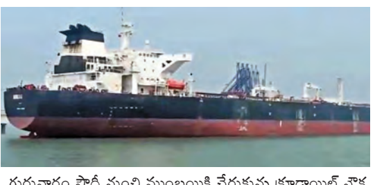
గురువారం సౌదీ నుంచి ముంబయికి చేరుకున్న క్రూడాయిల్ నౌక

న్యూఢిల్లీ, మార్చి 12: అంతర్జాతీయంగా నెలకొన్న యుద్ధ మేఘాలు సామాన్య డిమాండ్ కు భయానక లాక్ డౌన్ రోజులను గుర్తించేస్తోంది. ఇంధనం లేక వాహనాలు షెడ్యూల్ పరిమితం కాగా, గ్యాస్ దొరక్క హోటళ్లు, క్యాంటీన్లు మూత పడుతున్నాయి. >>2