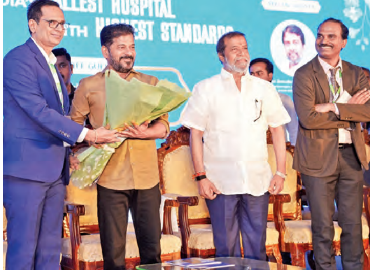
మెడికోపర్ ఆసుపత్రి ప్రారంభంలో పాల్గొన్న సిఐఐ రేవంత్, మంత్రి దామోదర తదితరులు

పైవేటు డాక్టర్లకు సిఐఐ రేవంత్ సూచన 65 లక్షల మంది హెల్త్ డేటా సిద్ధం ఆరోగ్యశ్రీ, సిఐఐఆర్ఎఫ్ కోసం రూ.1800 కోట్లు నాణ్యమైన వైద్యం సామాన్యులకు అందించాలి: ముఖ్యమంత్రి రేవంత్