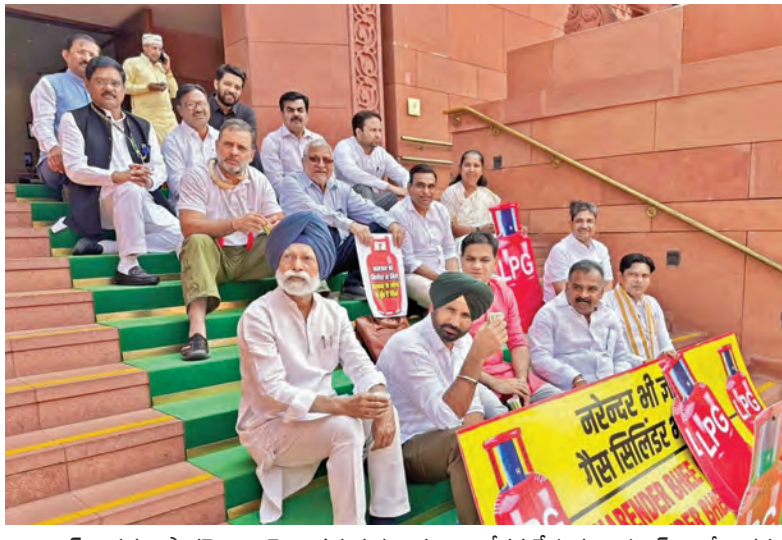
గ్యాస్ కొరతపై పార్లమెంటు మెట్ల వద్ద గురువారం ఆందోళన చేస్తున్న రాహుల్ గాంధీ ఇతర ఎంపీలు