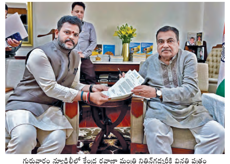
గురువారం న్యూఢిల్లీలో కేంద్ర రవాణా మంత్రి నితీష్ గడ్కరీకి వినతి పత్రం అందజేస్తున్న కేంద్ర మంత్రి రామ్మోహన్ నాయుడు

పనిదినాలయం, మార్చి 12, ప్రభాతవార్త వార్త: గ్రామీణ ప్రాంతాల్లో ఉపాధి కల్పనపై ప్రత్యేక దృష్టి సారించామని తెలిపారు. ముఖ్యంగా ఉపాధిహీను స్థానంలో కేంద్ర ప్రభుత్వం కొత్తగా తీసుకురాబోతున్న వికీసెట్ భారత్ గ్యారెంటీ షర్ రోజ్ గార్ అండ్ అజీవిక మిషన్-గ్రామీణ పథకం విడి విధానాలను ఆయన కలెక్టర్లకు వివరించారు. ప్రస్తుతం ఆర్థిక సంవత్సరం లో ఇప్పటివరకు 17.74 కోట్ల పనిదినాలు కల్పించామని, దాదాపు 43.15 లక్షల కుటుంబాలకు ఉపాధి హామీని అందించిన తన ప్రజాసేవలో వెల్లడించారు. అలాగే రాబోయే ఏడాది గాను రాష్ట్రానికి మెటీరియల్ కాంపోజిట్ కింద రూ. 3,400 కోట్లు రాబోతున్నాయని చెప్పారు. కొత్తగా రాబోతున్న 'పీఓ-గ్రామ్ జీ' పథకంలో కూలీలకు ఎన్నో అదనపు ప్రయోజనాలు ఉన్నాయని శశిభాషణ్ కుమార్ తెలిపారు. ఇప్పటి వరకు ఏటా 100 రోజులు మాత్రమే ఉన్న పనిదినాలను ఈ కొత్త పథకం కింది ప్రతి కుటుంబానికి 125 రోజులకు పెంచుతున్నట్లు ఆయన ప్రకటించారు. >>2