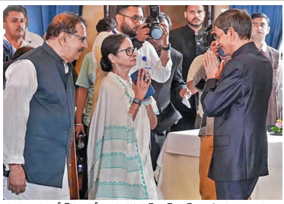
గురువారం కోటికాలో కొత్త గవర్నర్ ఆర్ ఎన్ రవికి భూభాగం కట్టలు తెలుపుతున్న బెంగళో సిఎం మువత బెన్సెన్