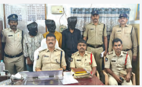
తొట్టంబేడు, మార్చి 12 ప్రభాతవార్త