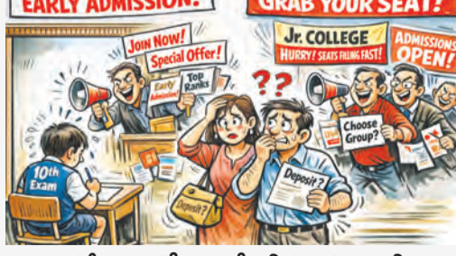
పరీక్షలకంటే ముందే అడ్మిషన్ వేట

తిరుపతి విద్య మార్చి 12 ప్రభాతవార్త. పదవ తరగతి పరీక్షలు ఇంకా ప్రారంభం కాలేదు. కానీ కొన్ని జూనియర్ కాలేజీలు మాత్రం అడ్మిషన్ కోసం ముందుగానే వేట మొదలు పెట్టాయి. పరీక్షల ఫలితాల రావడానికి ఇంకా నెలలు ఉన్నా విద్యార్థులు, తల్లిదండ్రులను టార్గెట్ చేస్తూ కాలేజీలు ప్రచారం చేస్తున్నాయి. విద్యార్థుల భవిష్యత్తు కంటే వ్యాపార ప్రయోజనాలే ముఖ్యమన్నట్లు వ్యవహారిస్తున్నాయని తల్లిదండ్రులు ఆవేదన వ్యక్తం చేస్తున్నారు. ఫోన్ కాల్స్, బ్రోచర్లు, సోషల్ మీడియా ప్రకటనలతో కాలేజీలు అడ్మిషన్ కోసం పోటీ పడుతున్నాయి. కొన్ని చోట్ల అయితే 'ఇప్పటికీ సీటు బుక్ చేసుకోండి' అంటూ ముందున్న డిపాజిట్ కూడా తీసుకుంటున్నట్లు ఆలోచనలు వినిపిస్తున్నాయి. పదవ తరగతి పరీక్షలు కూడా పూర్తికాకముందే ఇలా అడ్మిషన్ వేట మొదలుపెట్టడం విద్యా వ్యవస్థను వ్యాపారంగా మార్చిస్తోందని విద్యావేత్తలు అంటున్నారు. విద్యార్థులు ఏ గ్రూప్ తీసుకోవాలి, ఏ కాలేజీ సరైనది అన్నది ఫలితాలు వచ్చిన తర్వాత నిర్ణయించుకోవాల్సి విషయం. కానీ ముందుగానే డి.టి.డి తెప్పి అడ్మిషన్ తీసుకోవడం తగదని వారు అభిప్రాయపడుతున్నారు. ఇలాంటి చర్యలపై సంబంధిత అధికారులు చర్యలు తీసుకోవాలని తల్లిదండ్రులు కోరుతున్నారు. విద్యార్థుల భవిష్యత్తుతో ఆటాడే కాలేజీలపై కఠిన చర్యలు తీసుకోవాలి తో ఈ పరిస్థితి మరింత పెరిగే ప్రమాదం ఉందని హెచ్చరిస్తున్నారు.