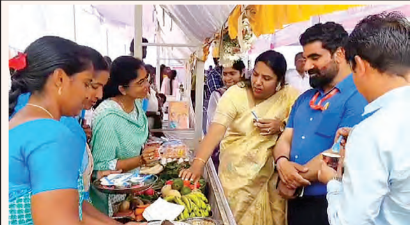
బోక్సన్ పాకెట్ కేంద్ర బృందం పరిశీలన