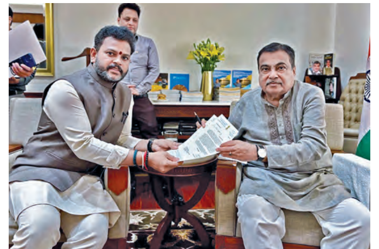
గురువారం న్యూఢిల్లీలో కేంద్ర రవాణా మంత్రి నితిన్ గడ్కరీకి వినతి పత్రం అందజేస్తున్న కేంద్ర మంత్రి రామ్మోహన్ నాయుడు