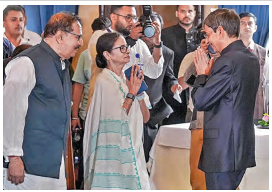
గురువారం కోల్ కత్తాలో కొత్త గవర్నర్ ఆర్ ఎన్ రవికి శుభాకాంక్షలు తెలుపుతున్న బెంగళో సీఎం మువత్ జెనర్లి