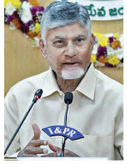
గురువారం జిల్లా కలెక్టర్ల సదస్సులో ప్రసంగిస్తున్న సిఎం చంద్రబాబు

రాష్ట్రంలో ఆతిథ్యరంగం అభివృద్ధికి కార్యాచరణ విశాఖ, అమరావతి, తిరుపతి ప్రత్యేక అభివృద్ధి స్ట్రీడ్ ఆఫ్ డూయింగ్ బిజినెస్ లో జిల్లాలకు ర్యాంకులు కంభం చెరువు అభివృద్ధికి కృషి జిల్లా కలెక్టర్ల సదస్సులో సిఎం చంద్రబాబు