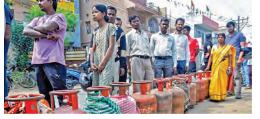
ముందస్తు బుకింగ్లకు ప్రయత్నిస్తున్నారని, దీంతో రాష్ట్రంలో ఇప్పుడు పాసిక్ బుకింగ్స్ పెద్ద తలనొప్పిగా మారాయి. ఈ ప్రభావం ఐపీఆర్ ఎస్ (ఇంటెరాక్టివ్ వాయిస్ రెస్పాన్స్ సిస్టమ్) బుకింగ్స్ మీద పడి, సర్వర్ న్యూనిటీతోంది. ఈ ప్యాసిక్ >>2

ఆందోళనతో ముందస్తు బుకింగ్లు డీలర్ల వద్దకు వినియోగదారుల పరుగులు విజయవాడ, మార్చి 12, ప్రభాతవార్త ప్రతినిధి: ఆంధ్రప్రదేశ్ రాష్ట్రంలో గ్యాస్ సరఫరాపై ఎక్కడెక్కడూ గ్యాస్ కిసాన్ కొరతలేదని, తగినన్ని సిలిండర్లు అందుకోలేక కేంద్ర, రాష్ట్ర ప్రభుత్వాలు ప్రకటించాయి. గ్యాస్ కొరత ఏర్పడవచ్చునన్న ఆందోళనతో రాష్ట్ర ప్రభుత్వం ముందస్తుగా చర్యలు తీసుకుంది. గృహ వినియోగ గ్యాస్ కు కొరతరావడాన్ని అన్ని ఏర్పాట్లు చేసింది. అయినప్పటికీ గ్యాస్ కొరత ఏర్పడితే ఎలా ఆనే దిశలో వినియోగదారులు ఆయా మార్కెట్లలో బుకింగ్లు చేస్తున్నారు. గృహ వినియోగదారులు భారీగా >>2