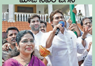
వైఎస్సార్స్ పీ వ్యవస్థాపక దినోత్సవంలో ప్రసంగిస్తున్న జగన్

పార్టీ ఆవిర్భావ దినోత్సవంలో మాజీ సిఎం జగన్ వైఎస్సార్స్ పీ వ్యవస్థాపక దినోత్సవంలో ప్రసంగిస్తున్న జగన్ విజయవాడ, మార్చి 12. ప్రభాతవార్త ప్రతినిధి: వైఎస్సార్ కాంగ్రెస్ పార్టీ దేశంలోనే కీలకంగా, ఒక మార్కెట్ గా నిలిచిందని ఆ పార్టీ అధ్యక్షుడు మాజీ సిఎం వైఎస్ జగన్మోహన్ రెడ్డి స్పష్టం చేశారు. రాష్ట్రంలోనే కాదు, దేశ రాజకీయాల్లోనే ప్రబలంగా మన పార్టీ కనిపిస్తోందన్నారు. వైఎస్సార్ కాంగ్రెస్ పార్టీ 16వ ఏటోత్సవం >>2