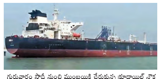
గురువారం సోదా నుంచి మంబయికి చేరుకున్న క్రూడాయిల్ నౌక

గ్యాస్ కొరతతో మూతపడుతున్న హోటళ్లు ఆలయాల్లో ప్రసాదాలకు అడ్డంకులు రంజాన్ మాసంలో హాలీం తయారీకి ఇక్కట్లు సిలిండర్ బ్లాక్ లో రూ.4 నుంచి రూ.5వేలు తక్షణ చర్యలకు ఉపకమించిన కేంద్ర, రాష్ట్రాలు