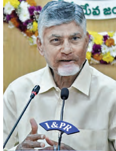
గురువారం జిల్లా కలెక్టర్ల సదస్సులో ప్రసంగిస్తున్న సిఎం చంద్రబాబు

రాష్ట్రంలో ఆతిథ్యరంగం అభివృద్ధికి కార్యాచరణ విశాఖ, అమరావతి, తిరుపతి ప్రత్యేక అభివృద్ధి స్ట్రీడ్ ఆఫ్ డూయింగ్ బిజినెస్ లో జిల్లాలకు ర్యాంకులు కంభం చెరువు అభివృద్ధికి కృషి జిల్లా కలెక్టర్ల సదస్సులో సిఎం చంద్రబాబు