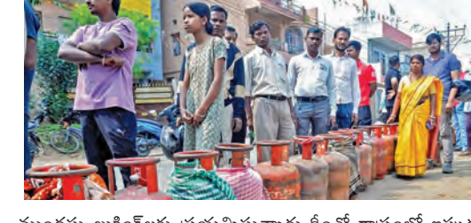
ముందస్తు బుకింగ్లకు ప్రయత్నిస్తున్నారు. దీంతో రాష్ట్రంలో ఇప్పుడు పానిక్ బుకింగ్స్ పెద్ద తలనొప్పిగా మారాయి. ఈ ప్రభావం ఐపీఆర్ ఎన్ (ఇంటెగ్రేటెడ్ వాయిస్ రెస్పాన్స్ సిస్టమ్) బుకింగ్స్ మీద పడి, సర్వర్ స్రంభించిపోతోంది. ఈ ప్యానిక్ >>2

ఆంధ్రీశనతో ముందస్తు బుకింగ్లు డీలర్ల వద్దకు వినియోగదారుల పరుగులు విజయవాడ, మార్చి 12. ప్రభాతవార్త ప్రతినిధి: ఆంధ్రప్రదేశ్ రాష్ట్రంలో గ్యాస్ సంక్షోభం ఎక్కడవస్తుంది, గ్యాస్ కు ఎలాంటి కొరతలేదని, తగినన్ని సిలిండర్లున్నాయని ఇప్పటికే కేంద్ర, రాష్ట్ర ప్రభుత్వాలు ప్రకటించాయి. గ్యాస్ కు కొరత ఏర్పడవచ్చునన్న అంచనాతో రాష్ట్ర ప్రభుత్వం ముందుగా చర్యలు తీసుకుంది. గృహ వినియోగ గ్యాస్ కు కొరత రాకుండా ఆన్ని ఏర్పాటు చేసింది. ఆయనప్పటికీ గ్యాస్ కొరత ఏర్పడితే ఎలా ఆన్ డిజిల్ వినియోగదారులు ఆయా మాధ్యమాలలో బుకింగ్లు చేస్తున్నారు. గృహ వినియోగదారులు భారీగా >>2