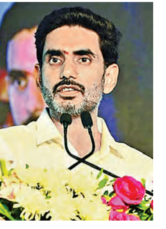
జువ్వల దిన్నెలో సాగర్ డిఫెన్స్ ప్రాజెక్టుకు శంకుస్థాపన చేసిన మంత్రి లోకేశ్