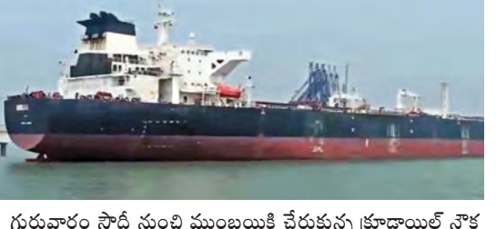
గురువారం సోదా నుంచి ముంబయికి చేరుకున్న క్రూడాయిల్ నౌక

గ్యాస్ కొరతతో మూతపడుతున్న హోటళ్లు ఆలయాల్లో ప్రసాదాలకు అడ్డంకులు రంజాన్ మాసంలో హాలీ తయారీకి ఇక్కట్లు సిలిండర్ బ్లాక్ లో రూ.4 నుంచి రూ.5వేలు తక్షణ చర్యలకు ఉపకమించిన కేంద్ర, రాష్ట్రాలు