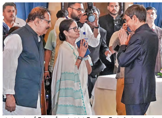
గురువారం కోట్లకాలో కొత్త గవర్నర్ ఆర్ ఎన్ రవికి కుటాకంక్షలు తెలుపుతున్న బెంగాల్ సీఎం మమత బెనర్జీ