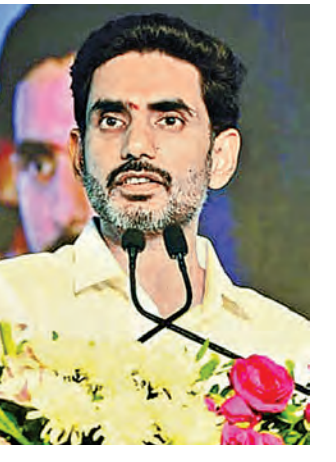
విజయవాడలో జరిగిన సభలో మంత్రి లోకేశ్ మాట్లాడుతున్నారు.