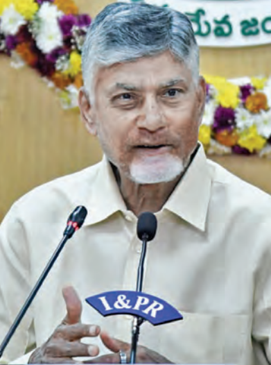
గురువారం జిల్లా కలెక్టర్ల సదస్సులో ప్రసంగిస్తున్న సిఎం చంద్రబాబు

రాష్ట్రంలో ఆతిథ్యరంగం అభివృద్ధికి కార్యాచరణ విశాఖ, అమరావతి, తిరుపతి ప్రత్యేక అభివృద్ధి స్ట్రీడ్ ఆఫ్ డూయింగ్ బిజినెస్ లో జిల్లాలకు ర్యాంకులు కంభం చెరువు అభివృద్ధికి కృషి జిల్లా కలెక్టర్ల సదస్సులో సిఎం చంద్రబాబు