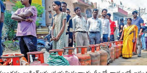
ముందస్తు బుకింగ్లకు ప్రయత్నిస్తున్నారు. దీంతో రాష్ట్రంలో ఇప్పుడు పానిక్ బుకింగ్స్ పెద్ద తలనొప్పిగా మారాయి. ఈ ప్రభావం ఐపీఆర్ ఎన్ (ఇంటెగ్రేటెడ్ వాయిస్ రెస్పాన్స్ సిస్టమ్) బుకింగ్స్ మీద పడి, సర్వర్ స్రంభించిపోతోంది. ఈ ప్యానిక్ >>2

ఆందోళనతో ముందస్తు బుకింగ్లు డీలర్ల వద్దకు వినియోగదారుల పరుగులు విజయవాడ, మార్చి 12, ప్రభాతవార్త ప్రతినిధి: ఆంధ్రప్రదేశ్ రాష్ట్రంలో గ్యాస్ సంక్షోభం ఎక్కువవుతుంది. ఎలాంటి కొరతలేదని, తగినన్ని సిలిండర్లున్నాయని ఇప్పటికే కేంద్ర, రాష్ట్ర ప్రభుత్వాలు ప్రకటించాయి. గ్యాస్ కొరత ఏర్పడవచ్చునన్న అంచనాతో రాష్ట్ర ప్రభుత్వం ముందస్తుగా చర్యలు తీసుకుంది. గృహ వినియోగ గ్యాస్ కొరత ఏర్పడితే ఎలా అనే దిశలో వినియోగదారులు ఆయా మాధ్యమాలలో బుకింగ్లు చేస్తున్నారు. గృహ వినియోగదారులు భారీగా >>2