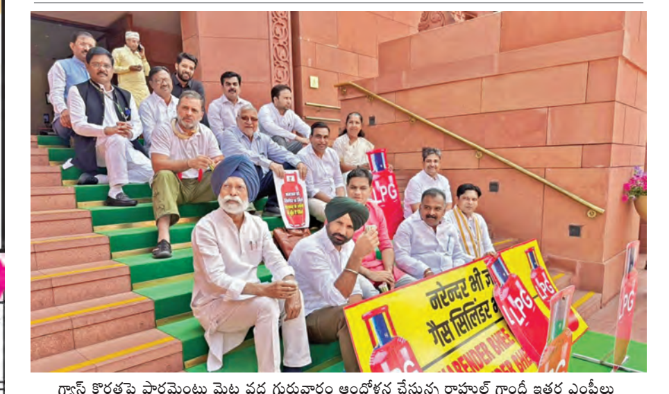
గ్యాస్ కొరతపై పాదమెంటు మెట్ల వద్ద గురువారం ఆంధోజన చేస్తున్న రాహుల్ గాంధీ అంబేద్కర్ వంటిలు

కడప జిల్లాలో కొప్పర్ల కూడా ఆ పారిశ్రామిక క్షేత్రం గా తయారు కావాలి. జిల్లాల్లో పెట్టుబడులు మీటింగులు పెట్టాలి. పెట్టుబడులు రాబట్టేందుకు కలెక్టర్లు చొరవ తీసుకోవాలి. అఫ్ డూయింగ్ టిజినెస్సులో జిల్లాల వారీగా ర్యాంకులిస్తాం అన్నారు. 2019-24లో రాష్ట్రానికి పెట్టుబడులు పెట్టాలి అన్నారు ముందుకు రాలేదు. అమర్ రాజా కంటెంట్ తిరుపతిలో కార్పొరేట్ అఫ్ఫీస్ పెట్టింది. వారిని గత పాలకులు పొరపొయేలా చేశారు. 2014-19లో పరిశ్రమలకు ఇచ్చిన భూములను గత ప్రభుత్వం వేరే అవసరాలకు వాడేసినదన్నారు. ఉమ్మడి రాష్ట్రంగా ఉన్నప్పుడు ఏపీని బెంగళూరుకు పోటీగా తీర్చిదిద్దాలి. మెన్స్ లివబుల్ సిటీగా హైదరాబాద్ ను తీర్చిదిద్దాలి అన్నారు. ఏపీని కల్పించాలి అన్నారు. ఇప్పుడు ఆ ఫలితాలు హైదరాబాద్ అనుభవిస్తోందన్నారు. ఇప్పుడు రాష్ట్రం మొత్తం అదే తరహా ఏక నిస్సం ఏర్పాటు చేస్తున్నామన్నారు. ఏపీని జిల్లాలలో పరిశ్రమలు రాకుంటే ఆ జిల్లాల్లో టూరిజం ప్రమాణ్ చేయాలి అన్నారు లేదా జీవన్ ప్రమాణ్ చేయాలి. ఏఎంఎంఎంఎం ప్రమాణ్ చేయాలి అన్నారు. అగ్రికల్చర్ ప్రమాణ్ చేయాలి. ఇలా ఏదోక రంగంలో ఆయా జిల్లాలకు ప్రత్యేకతలను దృష్టిలో పెట్టుకుని.. అనుకూలతలను దృష్టిలో పెట్టుకుని ఆయా రంగాల్లో అభివృద్ధి చేయాలి.