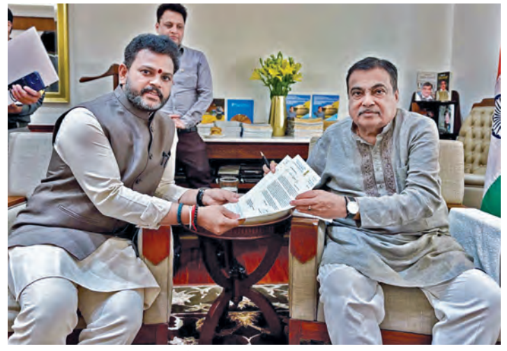
గురువారం న్యూఢిల్లీలో కేంద్ర రవాణా మంత్రి నితిన్ గడ్కరీకి వినతి పత్రం అందజేస్తున్న కేంద్ర మంత్రి రామ్మోహన్ నాయుడు

125 రోజులకు పనిదివాక పెంపు న చివరియం, మార్చి 12, ప్రభాతవార్త ప్రతినిధి: గ్రామీణ ప్రాంతాల్లో ఉపాధి కల్పనపై ప్రత్యేక దృష్టి సారించామని తెలిపారు. ముఖ్యంగా ఉపాధిహామీ స్థానంలో కేంద్ర ప్రభుత్వం కొత్తగా తీసుకురాబోతున్న వికాస్ భారత్ గ్యారంటీ ఫర్ రోజ్ గార్ ఆండ్ అజీవ్ మిషన్ గ్రామీణ వ్యవసాయ విధానం అయిన ఆయన కలెక్టర్లకు వివరించారు. ప్రస్తుతం ఆర్థిక సంవత్సరం లో ఇప్పటివరకు 17.74 కోట్ల పనిదివాక కల్పించామని, దాదాపు 43.15 కోట్ల కుటుంబాలకు ఉపాధి మామూలు ఆయన తన ప్రజెంటేషన్ లో వెల్లడించారు. ఆలాగే రాబోయే ఏడాదికి గాను రాష్ట్రానికి మెటీరియల్ కాంట్రాక్టు కింద రూ. 3,400 కోట్లు రాబోతున్నాయని చెప్పారు. కొత్తగా రాబోతున్న 'పీబీ-గ్రామ్ జీ' పథకంలో కూలీలకు ఎన్నో అదనపు ప్రయోజనాలు ఉన్నాయని శ్రీశాసన కుమార్ తెలిపారు. ఇప్పటి వరకు ఏటా 100 రోజులు మాత్రమే ఉన్న పనిదివాకను ఈ కొత్త పథకం కింది ప్రతి కుటుంబానికి 125 రోజులకు పెంచుతున్నట్లు ఆయన ప్రకటించారు. >>2