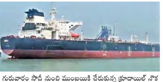
గురువారం సోదీ నుంచి ముంబయికి చేరుకున్న క్రూడాాయిల్ నౌక

న్యూఢిల్లీ, మార్చి 12: అంతర్జాతీయంగా నెలకొన్న యుద్ధ మేఘాలు సామాన్య డిమాండ్ కును ఛిన్నాభిన్నం చేస్తున్నాయి. దేశవ్యాప్తంగా తరతరంగా గ్యాస్ కొరత కరోనా కాలం నాటి భయానక లాక్ డౌన్ రోజులను గుర్తుచేస్తోంది. ఇండ్రస్ట్రీలకు వాహనాలు పెద్దకే పరిమితం కాగా, గ్యాస్ దొరకల్లో హోటళ్లు, క్యాంటీన్లు మూత పడుతున్నాయి. >>2