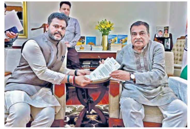
గురువారం న్యూఢిల్లీలో కేంద్ర రవాణా మంత్రి నితిన్ గడ్కరీకి వినతి పత్రం అందజేస్తున్న కేంద్ర మంత్రి రామ్మోహన్ నాయుడు

సచివాలయం, మార్చి 12, ప్రభాతవార్త: గ్రామీణ ప్రాంతాల్లో ఉపాధి కల్పనపై ప్రత్యేక దృష్టి సారించామని తెలిపారు. ముఖ్యంగా ఉపాధిహామీ స్థానంలో కేంద్ర ప్రభుత్వం కొత్తగా తీసుకురాబోతున్న ఐకాన్ భారత్ గ్యాజెట్ ఫర్ రోజ్ గా ఆండ్ అతిమిక మిషన్-గ్రామీణ పథకం విడి విధానాలను ఆయన కలెక్టర్లకు వివరించారు. ప్రస్తుతం ఆర్థిక సంవత్సరం లో ఇప్పటివరకు 17.74 కోట్ల పనిదినాలు కల్పించామని, దాదాపు 43.15 లక్షల కుటుంబాలకు ఉపాధి చూపామని ఆయన తన ప్రజెంటేషన్ లో వెల్లడించారు. అలాగే రాబోయే ఏడాది డిడి గాను రాష్ట్రానికి మెటీరియల్ కాంపోసింగ్ కింద రూ. 3,400 కోట్లు రాబోతున్నాయని చెప్పారు. కొత్తగా రాబోతున్న 'పీబీ-గ్రామ్ జీ' పథకంలో కూతలకు ఎన్నో అదనపు ప్రయోజనాలు ఉన్నాయని శశిభూషణ్ కుమార్ తెలిపారు. ఇప్పటి వరకు ఏడాది 100 రోజులు మాత్రమే ఉన్న పనిదినాలను ఈ కొత్త పట్టం కింది ప్రతి కుటుంబానికి 125 రోజులకు పెంచుతున్నట్లు ఆయన ప్రకటించారు.