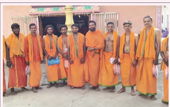
హనుమాన్ మాలలు ధరించిన భక్తులు