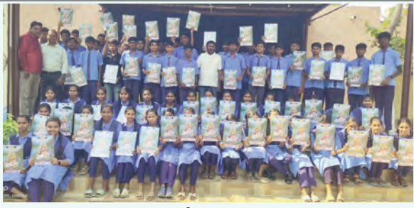
విద్యార్థులకు పరీక్ష ప్యాఢ్లను పంపిణీ చేస్తున్న విఎన్ఆర్ ఫౌండేషన్ ప్రతినిధులు