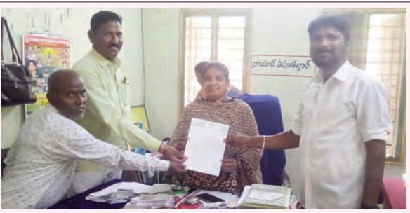
నాయబ్ తహసీల్దార్ కల్వనకు వినతి పత్రం ఇస్తున్న సర్పంచ్, ఉప సర్పంచ్