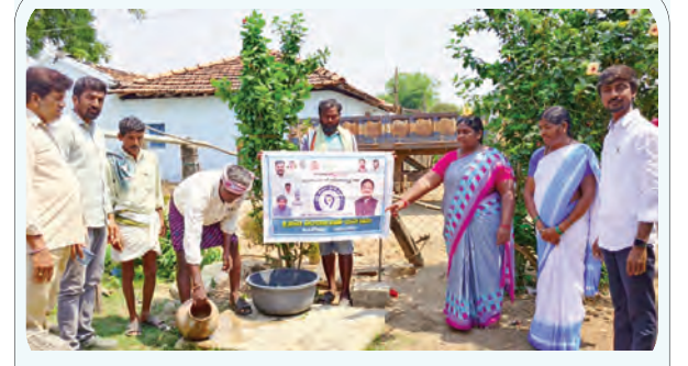
ప్రజలకు అవగాహన కల్పిస్తున్న ధృక్తం