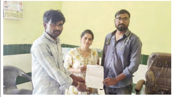
వినతి పత్రం అందజేస్తున్న దృశ్యం

మంచిర్యాల జిల్లా స్థానిక చెన్నూరు పట్టణంలో నేటి నుంచి పదవ తరగతి పరీక్షలు నిర్వహించేందుకు అన్ని ఏర్పాట్లు చేశామని మండల విద్యాధికారి కేపి సత్యనారాయణ తెలిపారు. పరీక్షలు రాసే వారిలో బాలికలు 312 బాలురు 340 మొత్తం 652 మంది విద్యార్థులు పరీక్షలు రాయనున్నట్లు ఆయన పేర్కొన్నారు. పరీక్షలు నిర్వహించేందుకు మూడు కేంద్రాలను ఏర్పాటు చేసినట్లు తెలిపారు. ఇందుకోసం ప్రభుత్వ ఉన్నత పాఠశాలలో 220, కేజీబీవీలో 230, అస్సీసీ స్కూల్లో 202 మొత్తం 652 మంది పరీక్షలు రాయనున్నట్లు తెలిపారు. ఉదయం 9 గంటలకు పరీక్ష హాల్లో ఉండాలన్నారు. విద్యార్థుల సౌకర్యార్థం అన్ని ఏర్పాట్లు చేశామని, విద్యార్థులు నిర్భయంగా పరీక్షలు రాయాలన్నారు.