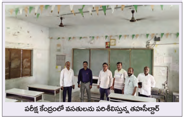
పరీక్ష కేంద్రంలో వసతులను పరిశీలిస్తున్న తహసీల్దార్