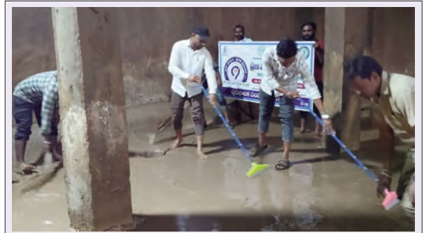
ట్యాంకును శుభ్రపరుస్తున్న మున్సిపల్ కమిషనర్ తిరుపతి