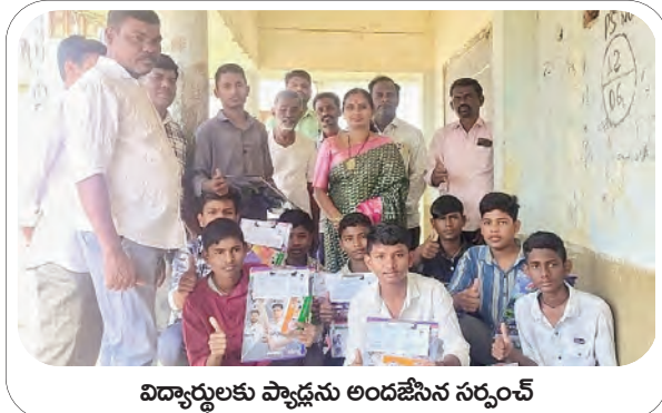
విద్యార్థులకు ప్యాక్షను అందజేసిన సర్పంచ్