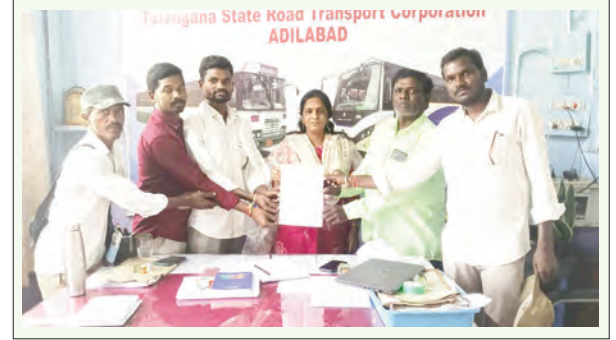
వినతిపత్రం అందజేస్తున్న నాయకులు

మార్గదర్శకత్వంలో లక్ష్యసాధన దిశగా ముందుకు సాగాలని సూచించారు. అనంతరం విద్యార్థులు నిర్వహించిన సాంస్కృతిక కార్యక్రమాలను అతిథులు ఆసక్తిగా వీక్షించి అభినందించారు. ఈ కార్యక్రమంలో పాఠశాల యాజమాన్యం, ఉపాధ్యాయులు, విద్యార్థులు పాల్గొన్నారు.