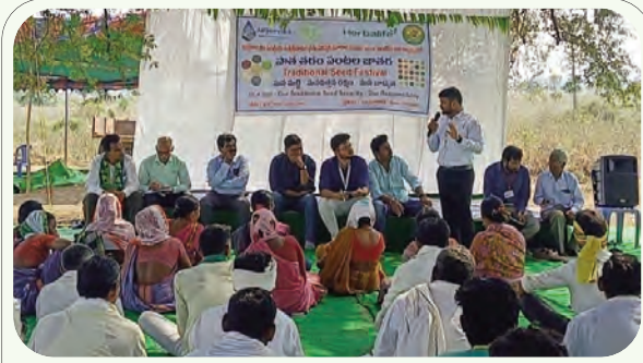
మాట్లాడుతున్న సంస్థ ప్రతినిధులు