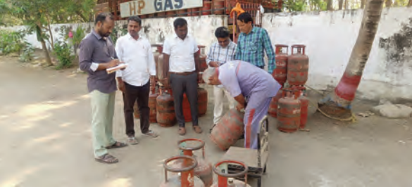
సిలిండర్లను స్వాధీనం చేసుకుంటున్న పౌరసరఫరాల అధికారులు

నిర్మల్ పట్టణంలోని పలు హోటళ్లలో శుక్రవారం పౌరసరఫరాల శాఖ అధికారులు ఆకస్మిక తనిఖీలు చేపట్టారు. రాష్ట్ర పౌరసరఫరాల కమిషనర్ ఆదేశాల మేరకు నిర్వహించిన ఈ దాడుల్లో 16 హోటళ్లను తనిఖీ చేయగా, నిబంధనలకు విరుద్ధంగా వాడుతున్న 29 గృహావసరాల సిలిండర్లను స్వాధీనం చేసుకున్నట్లు అధికారులు తెలిపారు. ఈ సందర్భంగా అధికారులు మాట్లాడుతూ.. గృహావసరాల కోసం కేటాయించిన సిలిండర్లను వ్యాపార అవసరాలకు ఉపయోగించడం చట్టరీత్యా నేరమని స్పష్టం చేశారు. ఎవరైనా డొమెస్టిక్ సిలిండర్లను కమర్షియల్ అవసరాలకు ఉపయోగిస్తే కఠిన చర్యలు తీసుకుంటామని హెచ్చరించారు. వ్యాపారులు తప్పనిసరిగా కమర్షియల్ సిలిండర్లనే వాడాలని సూచించారు.