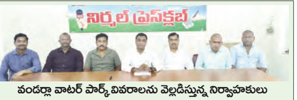
వండర్లా వాటర్ పార్క్ వివరాలను వెల్లడిస్తున్న నిర్వాహకులు