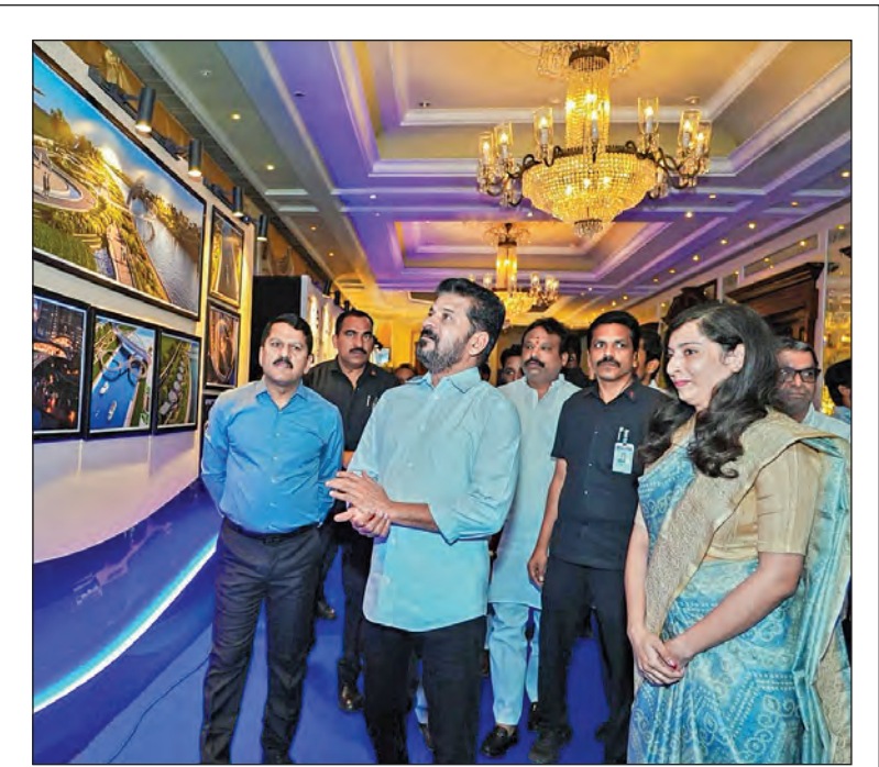
శుక్రవారం హైదరాబాద్ లో మూసీ ప్రాజెక్టుపై పవర్ పాయింట్ ప్రజెంటేషన్ ఇచ్చిన సందర్భంగా ఎన్టీఆర్ పరిశోధన, సిఐ రెంట్ రెడ్డి