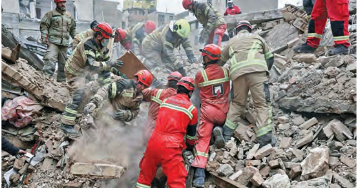
బెత్తెనోల్లో విధ్వంసం జరిగిన చౌబీ సహాయకార్యక్రమాలలో పాల్గొంటున్న సిబ్బంది