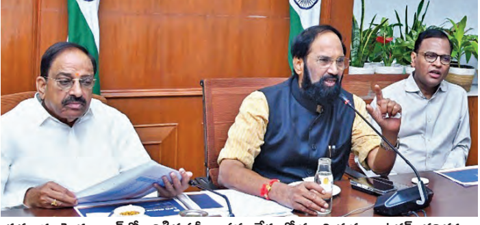
శుక్రవారం హైదరాబాద్ లో జరిగిన సమీక్ష సమావేశంలో మంత్రి తుమ్మల, ఉత్తమ్ తదితరులు