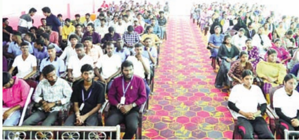
బంజారా, సుమారు 300 మంది విద్యార్థులు పాల్గొన్నారు.