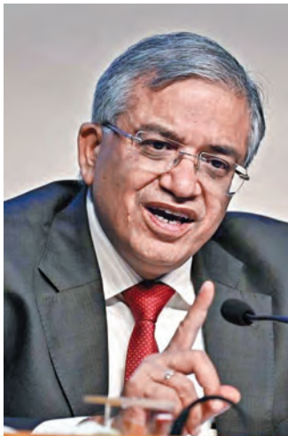
న్యూఢిల్లీ, మార్చి 13: కేంద్ర ఎన్నికల ప్రధాన కమిషనర్ జ్యూజ్ కుమార్ ను తొలగించాలని కోరుతూ కాంగ్రెస్, తృణమూల్ కాంగ్రెస్ తదితర ప్రతిపక్ష పార్టీలు అభిసంసన తీర్మానం పెట్టాలని నిర్ణయించాయి. ఇందుకు సంబంధించి ఇటు లోక్ సభ స్పీకర్ ఓం ప్రకాష్ బిర్లా, అటు రాజ్యసభ చైర్మన్ పారివన్ నారాయణ సింగ్ నోటీసులు అందజేశారు. ఈనెలలో 130 మంది లోక్ సభ సభ్యులు, 63 మంది రాజ్యసభ సభ్యులు మొత్తం 193 మంది సభ్యులు సంతకాలు చేశారు. సిఐసి జ్యూజ్ కుమార్ ఒక నిర్దిష్ట వర్గానికి అనుకూలంగా వ్యవహరిస్తున్నారని ఆరోపిస్తూ, మరో ఆరు ఆరోపణలు ఆ నోటీసుల్లో ప్రస్తావించారు. అధికార పక్షం సమాచారం ప్రకారం, ఈ ఆరోపణలు కేంద్ర ఎన్నికల సంఘం చేపట్టిన ఓటర్ల జాబితా ప్రత్యేక సవరణ ప్రధానంగా ఉంది. >>2