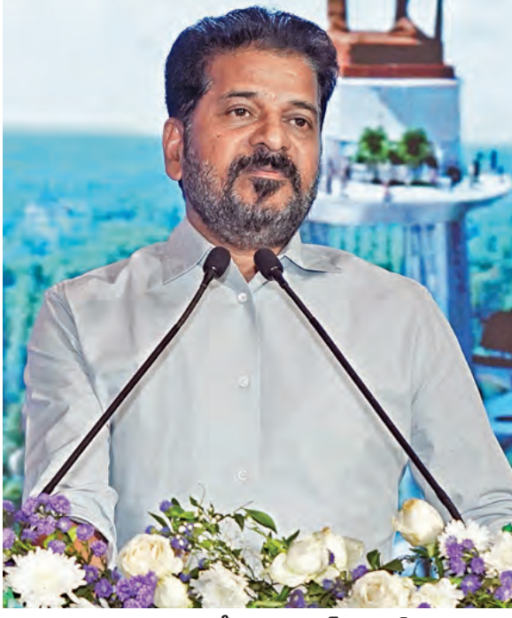
శుక్రవారం మూసీ ప్రాజెక్టుపై పవన్ చాయిట్ ప్రజెంటేషన్లో మాట్లాడుతున్న సిఎం రేవంత్ రెడ్డి