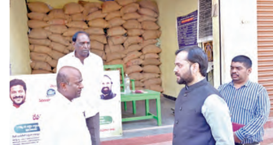
రేషన్ దుకాణాన్ని తనిఖీ చేస్తున్న జిల్లా కలెక్టర్ దీపక్ తివారి

వికారాబాద్, మార్చి 13, ప్రభాతవార్త : జిల్లాలో ప్రజలకు ప్రభుత్వ సంక్షేమ పథకాలలో భాగంగా సన్న బియ్యం లభింపజేయాలి సక్రమంగా చేరేలా చూడాలని జిల్లా కలెక్టర్ దీపక్ తివారి అన్నారు. శుక్రవారం వికారాబాద్ పట్టణం లోని చౌక్ ధరల పంపిణీ కేంద్రాన్ని సందర్శించారు. ఈ సందర్భంగా కలెక్టర్ మాట్లాడుతూ, రేషన్ పాస్ లో బియ్యం, చక్కెర, తదితర అవసరమైన సరుకుల నిల్వలను పరిశీలించారు. సరుకులు లభింపజేయాలి సమయానికి అందుతున్నాయా అనే విషయాన్ని అడిగి తెలుసుకున్నారు. వెయింగ్ మిషన్ లో కొలతలు పరిశీలించారు.