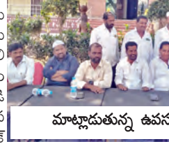
మాట్లాడుతున్న ఉప సర్పంచ్ లు

రద్దు చేసే అధికారం ఎవరికి లేదు క్రమాలంబి చెప్పకపోతే రాష్ట్రవ్యాప్తంగా ఉద్యమం కొత్తూరు మండల ఉప సర్పంచ్ డిమాండ్ కొత్తూరు, మార్చి 13, ప్రభాతవార్త: ఉప సర్పంచ్ లకు చెక్ పవర్ రద్దు చేయాలని సర్పంచ్ ల సంఘం అధ్యక్షులు కలెక్టరుకు ఇచ్చిన ఫిర్యాదును వెంటనే వెనక్కి తీసుకోవాలని ఉప సర్పంచ్ లు డిమాండ్ చేశారు. గురు వారం కొత్తూరు మున్సిపల్ పరిషత్ లోని పాపిలోని ఫోటో రిపోర్ట్ నిర్వహించిన మీదట సమావేశంలో కొత్తూరు మండలం ఉప సర్పంచ్ ఈ విషయాన్ని వెల్లడించారు. ఈ సందర్భంగా వారు మాట్లాడుతూ, గ్రామ పంచాయతీ వ్యవస్థలో సర్పంచ్ లు, ఉప సర్పంచ్ లు ఇద్దరికీ సమాన హక్కులు బాధ్యతలు ఉన్నాయని తెలిపారు. అప్పటి ప్రభుత్వం అవినీతి ఉండవద్దనే ఉమ్మడి చెక్ పవర్ ఇచ్చింది. ఉప సర్పంచ్ లకు ఉన్న చెక్ పవర్ ను రద్దు చేయాలని కోరడం ప్రజాస్వామ్యానికి విరుద్ధమని, ఇది ఉప సర్పంచ్ లు పట్టుకుంటే వర్తక సంఘం అని అగ్రాంతం వ్యక్తం చేశారు. గ్రామ అభివృద్ధి పనుల్లో పారదర్శకత ఉండాలనే చెక్ పవర్ అవసరమని అన్నారు. కొంతమంది వ్యక్తిగత ప్రయోజనాల కోసం ఉప సర్పంచ్ లు అధికారాలను తగ్గించే ప్రయత్నం చేయడం సరికాదని, అలాంటి చర్యలను తీవ్రంగా ఖండించాలని పేర్కొన్నారు. వెంటనే సర్పంచ్ ల సంఘం నాయకులు ఇచ్చిన పియార్ ను వెనక్కి తీసుకుని ఉప సర్పంచ్ లు దివ్యక్షమాణ చెప్పాలని డిమాండ్ చేశారు. రోజువారీ తెలంగాణ రాష్ట్ర వ్యాప్తంగా ఉప సర్పంచ్ లు ఏకమై ఈ విషయంపై చర్చించి తగిన కార్యాచరణ చేపడతామని హెచ్చరించారు. ఈ కార్యక్రమంలో ఉప సర్పంచ్ లు ఉప సర్పంచ్ రెడ్డి, సునూరు గజేష్, ఎం.డి సిరాజ్, ఆరోగ్యం, వెంటకమ్మ, సర్వవం, సర్వన్న రాంరావ్, హనుమంత నాయక్, డోపాలా యాదయ్య, వాల్ సభ్యులు తదితరులు పాల్గొన్నారు.