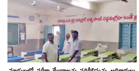
మాట్లాడే పరీక్షా కేంద్రాలను పరీక్షిస్తున్న అధికారులు

విద్యార్థులకు ముక్తి వివేక ఉద్ధిధ విద్యాశాఖ అధికారులు తెలిపారు. పరీక్షల నిర్వహణ కోసం జిల్లాలో మొత్తం 255 పరీక్షా కేంద్రాలు ఏర్పాటు చేశారు. వీటిలో రెగ్యులర్, ప్రైవేట్ అభ్యర్థులకు పరీక్షలు రాయనున్నారు. ప్రభుత్వత్రాలు, సమాధాన వ్రతాల భద్రత కోసం 7 పోలీస్ స్టేషన్లను నిల్వ కేంద్రాలుగా గుర్తించారు. అనేకవిధంగా సమాధాన పుస్తకాలు, ఇతర పరీక్షా సామగ్రి పంపిణీ కోసం 14 స్టేషనరీ పాయింట్లు ఏర్పాటు చేశారు. పరీక్షా కేంద్రాలను, సీట్లను 47 కేంద్రాలు, బి కేటగిరీ 201 కేంద్రాలు, సి కేటగిరీ 7 కేంద్రాలుగా పరీక్షించారు. ఈ కేంద్రాల్లో ప్రభుత్వ పాఠశాలలు, ప్రైవేట్ పాఠశాలలు, కేజీపీ పాఠశాలలు, గురుకుల పాఠశాలలు, ఆశ్రమ పాఠశాలలు, జిడ్పీ పాఠశాలలు తదితర విద్యార్థులకు చెందిన విద్యార్థులు పరీక్షలకు హాజరుకానున్నారు. పరీక్షల పర్యవేక్షణను సమర్థవంతంగా నిర్వహించేందుకు జిల్లాను 10 రూట్లుగా విభజించి రూల్ అధికారులను నియమించారు. ప్రతి రూల్ అధికారి తన పరిధిలోని పరీక్షా కేంద్రాలను పర్యవేక్షిస్తూ పరీక్షలు సక్రమంగా జరుగుతున్నాయా అనే అంశాన్ని పరిశీలిస్తారు. అలాగే పరీక్షా కేంద్రాల్లో విధులు నిర్వహించే ఇన్స్పెక్టర్ల బృందాలను ప్రత్యేకంగా ఏర్పాటు చేశారు. ప్రతి పరీక్షా కేంద్రానికి టీవీ సూపరివిజియెంట్, డివార్టింగ్ మెటర్ అప్సర్, స్పెషల్ కన్వోయిస్, జాయింట్ కన్వోయిస్లను నియమించేందుకు చర్యలు తీసుకుంటున్నారు. పరీక్షల నిర్వహణలో ఎలాంటి అవకతవకలు జరగకుండా పర్యవేక్షణ కోసం ఫ్లయింగ్ స్కాడ్లు బృందాలను కూడా ఏర్పాటు చేశారు. ఈ బృందాలు పరీక్షా కేంద్రాలను ఆకస్మికంగా తనిఖీ చేస్తూ నియమాపహీ అవలను పరీక్షించనున్నారు. అన్ని పరీక్షా కేంద్రాల్లో విద్యార్థులకు ఎలాంటి ఇబ్బందులు లేకుండా ఉండేందుకు