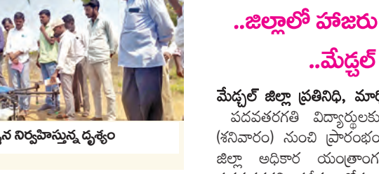
శ్రీ సేంద్రియ వ్యవసాయంపై అవగాహన