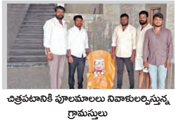
కొత్తపేటలో పూలమాలలు నివాళులర్పిస్తున్న గ్రామస్థులు