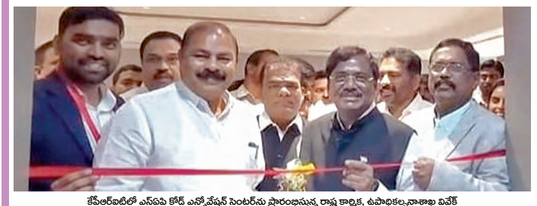
కేసీఆర్ వారికి ఎన్ఎస్ కోడ్ ఎన్ఎస్ కోడ్ సెంటర్ను ప్రారంభిస్తున్న రాష్ట్ర కార్మిక, ఉపాధి కల్పన శాఖాఖ్య వివేక్