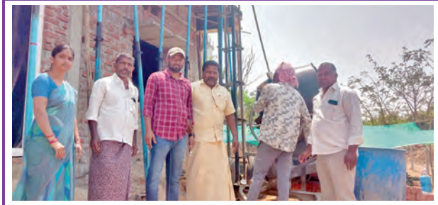
నూతన భవన పనులు పరిశీలిస్తున్న నేతలు