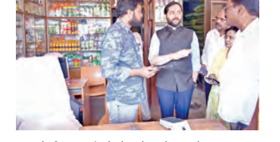
ఎరువులు, పురుగు మందుల దుకాణాన్ని తనిఖీ చేస్తున్న కలెక్టర్ డిపక్ తివారీ

ఫర్మిచర్, తాగునీరు, విద్యుత్, కాంపౌండ్ వాల్, టాయిల్లు వంటి మెలికల సదుపాయాలను నిర్ధానం ఉంచినట్లు అధికారులు తెలిపారు. పరీక్షల సమయంలో కేంద్రాల్లో శాంతిభద్రతలు కాపాడేందుకు పోలీస్ శాఖతో కూడా సమన్వయం కొనసాగిస్తున్నారు. ఇదిలా ఉండగా హుయోన్ గరోలోని వర్గ అండ్ డిడ్ స్కూల్లో జిల్లా బల్స్ నిల్వ కేంద్రాన్ని ఏర్పాటు చేసి, ప్రభుత్వత్రాలు, ఇతర పరీక్షా సామగ్రిని 24 గంటల భద్రతతో భద్రపరచనున్నట్లు విద్యాశాఖ అధికారులు తెలిపారు. పరీక్షా సామగ్రి భద్రత కోసం ప్రత్యేక పర్యవేక్షణ కూడా ఏర్పాటు చేసినట్లు చెప్పారు. మొత్తంగా ఎన్ఎస్ఐ పరీక్షలు జిల్లాలో ప్రశాంతంగా, పారదర్శకంగా నిర్వహించేందుకు అన్ని ఏర్పాట్లు పూర్తి చేసినట్లు జిల్లా విద్యాశాఖ అధికారి సుశీలద్రావు వెల్లడించారు.