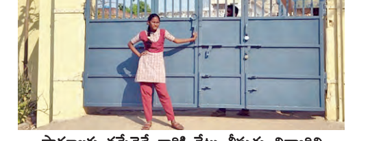
పాఠశాలకు వచ్చేవేళ వారికి గేటు తీస్తున్న విద్యార్థిని

నులకు వాచ్ మెన్ బాధ్యతలు అప్పగించడం పట్ల తీవ్ర విమర్శలు వ్యక్తమవుతున్నాయి. పాఠశాలకు వచ్చిపోయే వారి కోసం గేటు తీయడం, వేయడం వంటి పనులను బాలికలే నిర్వహిస్తున్నారని.. ఒకవైపు ఎండ తీవ్రతతో సామాన్యత అల్లాడుతుంటే, బాలికలను ఇలా ఎండలో నిలబెట్టడం ఏమీటని తల్లిదండ్రులు ఆందోళన వ్యక్తం చేస్తున్నారు. కేవలం గేటు కాపలానే కాకుండా, పలో తరగతి పరీక్షల సెషన్లు ప్రత్యేకంగా గేటుల అతికించే పనులను కూడా బాలికలతోనే