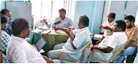
సానిపాయి గ్రామ పంచాయితీలో నిధుల