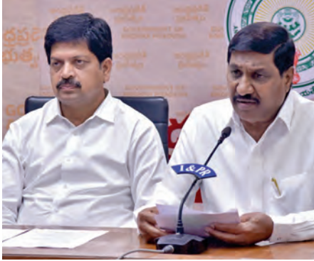
కూటమి అధికారంలోనికి రాగానే 95 మందికి రూ.4.75 కోట్లు చెల్లించాం. మత్స్యకారుల అభివృద్ధికి చిత్తశుద్ధితో పనిచేశాం. మత్స్య రంగానికి తోడ్పాటు అందించేలా పరిశ్రమల్ని తీసుకోవచ్చి అందగా నిలుస్తున్నాం. కేంద్ర ప్రభుత్వ వర్తకాల ద్వారా మత్స్యకారులను పారిశ్రామికంగా తోడ్పాటు నిలుస్తున్నాం. అలాంటి ప్రయత్నంపై విమర్శలు చేయడానికి జగన్ వారి మూలా కొన్నా సగ్గుపదాలని మంత్రి కొల్లు రవీంద్ర ఎద్దేవా చేశారు.

సవివాలయం, మార్చి 13 ప్రభాతవార్త: జువ్వెలదిన్నె పిపింగ్ హార్వర్ను ప్రవేశ పరం చేస్తున్నామంటూ ప్రతిపక్షం చేస్తున్న విమర్శల్లో ఎంతమాత్రం వాస్తవం లేదని రాష్ట్ర మంత్రి బి.జనార్దన్ రెడ్డి కొట్టిపారేశారు. సవివాలయంలోని పబ్లిసిటీ సెల్లో రాష్ట్ర ఎక్సైజ్ శాఖ మంత్రి కొల్లు రవీంద్రతో కలిసి నిర్వహించిన సందయక మీడియా సమావేశంలో ఇరువురు మంత్రులు పాల్గొన్నారు. ఈ సందర్భంగా మాజీ సిఎం జగన్ దుర్భింకాపై ప్రజలు అత్యంత అప్రమత్తంగా ఉండాలని ఇరువురు మంత్రులు ప్రజలకు అప్రమత్తం ఎంతటి వారినినా జువ్వెలదిన్నె లేదని హెచ్చరించారు. మంత్రి బి.జనార్దన్ రెడ్డి మాట్లాడుతూ జువ్వెలదిన్నె పిపింగ్ హార్వర్ను ప్రైవేట్ పరంగా చేస్తున్నారన్న వార్తలు అవాస్తవమన్నారు. మొత్తం 114 ఎకరాల 13 గొట్టా హార్వర్ భూమిలో కేవలం 7 ఎకరాలు మాత్రమే సాగర్ డిపాజిట్ ఇంజనీరింగ్ లిమిటెడ్ కు కేటాయించడం జరిగిందన్నారు. మత్స్యకారులకు ఆధునిక కమ్యూనికేషన్, వాతావరణ సమాచారం అందించేందుకు ఈ ప్రాజెక్టు ఉపయోగపడుతుందని తెలిపారు. ఉపగ్రహాలు, డ్రోన్లు, ఆధునిక టెక్నాలజీ ద్వారా సమద్రంలో ఉన్న మత్స్యకారులకు అదనపు సమాచారం అందనుందన్నారు. రాష్ట్ర ప్రగతిని అడుగుంటామంటే ఉపేక్షించేదేది లేదు: మంత్రి కొల్లు రవీంద్ర మాట్లాడుతూ జువ్వెలదిన్నె హార్వర్ వద్ద అటానమస్ మారిటైం పిపింగ్ నిర్మాణంపై తప్పదు ప్రచారం చేస్తే కఠిన చర్యలు తప్పబోవని మంత్రి హెచ్చరించారు. రాష్ట్రంలో కూటమి ప్రభుత్వం అధికారంలోనికి వచ్చాక పారిశ్రామిక ప్రగతి దిశగా కీలకమైన అడుగులు వేస్తున్నాం. 2024-25 ఆర్థిక సంవత్సరంలో దేశానికి వచ్చిన పెట్టుబడుల్లో 25.03 శాతం ఎపికి రావడం మత్స్యకారుల అభివృద్ధికి కూటమి ప్రభుత్వం కట్టుబడి ఉంది: గత ఐదు సంవత్సరాల పాటు పేటకు వెళ్ళి పరణించిన మత్స్యకారులకు పైసా చెల్లించలేదు. కానీ