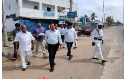
నేషనల్ హైవే అధికారులు ఉన్నారు