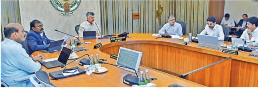
శుక్రవారం అమరావతిలో సీఎం చంద్రబాబు అధ్యక్షతన జరిగిన కేబినెట్ సమావేశ దృశ్యం

విజయవాడ, మార్చి 13, ప్రభాతవార్త ప్రతినది: ఆంధ్రప్రదేశ్ రాష్ట్ర మంత్రి వర్గం పలు కీలక నిర్ణయాలకు ఆమోదముద్ర వేసింది. ముఖ్యమంత్రి చంద్రబాబు అధ్యక్షతన జరిగిన ఈ సమావేశంలో 28 కీలక అజెండా అంశాలపై చర్చించి ఆమోదించారు. జల జీవన్ మిషన్, పోలవరం ప్రాజెక్టు పనుల వేగవంతం, కడప స్టీల్ ప్లాంట్ కు భూ కేటాయింపులు, గిరిజన రైతులకు సబ్సిడీలు, మహిళల కోసం హస్తకళ వంటి అనేక ముఖ్యమైన ప్రతిపాదనలను ఆమోదించారు. జల జీవన్ మిషన్ ద్వారా నిధుల మంజూరుకు ఆమోదం తెలిపింది. ఏపీఐఎస్ కేంద్రం 75 వేల ఎకరాలను 22వ నుంచి తొలగించేలా మంత్రివర్గం నిర్ణయం తీసుకుంది. నీరుకొందలో తెలుగు కల్చరల్