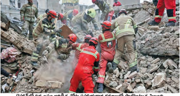
విఘ్నేశ్వర్ విధ్వంసం జరిగిన చోట సహాయకార్యక్రమాలలో పాల్గొంటున్న సిబ్బంది

దుబాయ్ ఫైనాన్షియల్ సెంటర్ పై ఇరాన్ దాడి అబ్రహాం లింకన్ నౌకపై దాడి చేశాం: ఇరాన్ ఇక ఇరాన్ నరకం చూస్తుంది: ట్రంప్ కొత్త సుప్రీం కమాండర్ కోమలతో ఉన్నారంటున్న అమెరికా