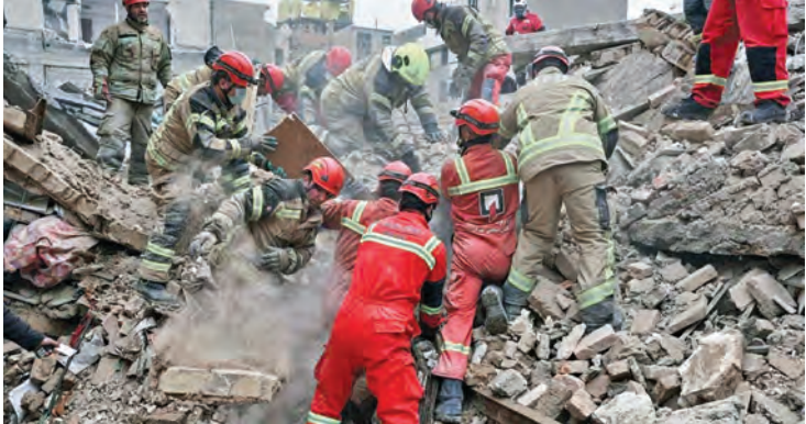
బెత్తెనోల్ లో విధ్వంసం జరిగిన చౌబీ సహాయకార్యక్రమాలలో పాల్గొంటున్న సిబ్బంది

దుబాయ్ ఫైనాన్సియల్ సెంటర్ పై ఇరాన్ దాడి అబ్రహం లింకన్ నౌకపైనా దాడిచేశాం: ఇరాన్ ఇక ఇరాన్ నరకం చూస్తుంది: ట్రంప్ కొత్త సుప్రీం కమాండర్ కోమూలో ఉన్నారంటున్న అమెరికా యుద్ధనౌక ఒమన్ జలాల్లోకి పరారయిందని ఇరాన్ ప్రకటించింది. ఇదిలా ఉంటే అమెరికా కెస్ 135 రిఫ్యూయల్ విమానం ఇరాక్ గగనతలంలోనే కూలిపోయింది. మొత్తం ఆరుగురు క్రూ సభ్యుల్లో నలుగురు చనిపోయి ఉండవచ్చని అమెరికా చెబుతోంది. ఇరాన్ లోని బెహ్రేన్ నగరంలో జరుగుతున్న ర్యాలీపై భారీ పేలుడు సంభవించింది. అలాగే ఖజ్జిన్ లో కూడా భారీ పేలుడు సంభవించింది. ఈ నగరాలపై దాడులు చేస్తామని హెచ్చరించిన వెంటనే ఇజ్రాయెల్ ఇరాన్ నగరాలపై దాడులు తీవ్రతరంచేసింది. ప్రభుత్వ అనుకూల ప్రచారనలు జరుగుతున్న ప్రాంతాల్లోనే దాడులు జరిగాయి. బెహ్రేన్ లోని ప్రాజెక్ట్ స్ట్రీట్ సమీపంలో కూడా భారీ పేలుళ్లు జరిగి ఒక మహిళ మరణించింది. ఈ ర్యాలీకి ఇరాన్ అధ్యక్షుడు ముహమ్మద్ రెజైజీ యాన్ కూడా హాజరయ్యారు. ఇదిలా ఉంటే ఇరాన్ పై ఇక తీవ్రస్థాయిలో దాడులు ఉంటాయని అమెరికా అధ్యక్షుడు ట్రంప్ హెచ్చరించారు. వచ్చేవారం మొత్తం ఇరాన్ పై భూతలపోరు భారీ స్థాయిలో ఉంటుందని, ఇరాన్ ను పూర్తిగా ధ్వంసం చేస్తామని హెచ్చరించారు. ఉగ్రవాద దేశంగా ఉన్న >>2