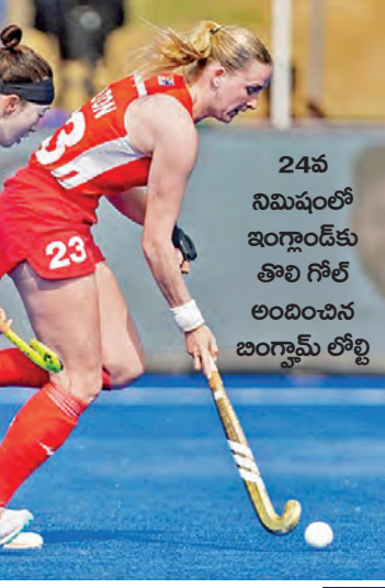
24వ నిమిషంలో ఇంగ్లాండ్ కు తొలి గోల్ అందించిన ఇంగ్లాండ్ లోల్లి

అంతకుముందు జరిగిన మొదటి సెమీఫైనల్ లో ఇంగ్లాండ్ 2-0 గోల్స్ తేడాతో స్కాట్లాండ్ పై గెలుపొందింది. తొలి మ్యాచ్ లో భారత్ అమ్మాయిలు అగ్రస్థానంలో నిలిచారు. 39వ నిమిషంలో లభించిన గోల్ లో భారత్ కు టికెట్ లో అమ్మాయిలు అగ్రస్థానంలో నిలిచారు. 39వ నిమిషంలో లభించిన గోల్ లో భారత్ కు టికెట్ లో అమ్మాయిలు అగ్రస్థానంలో నిలిచారు.