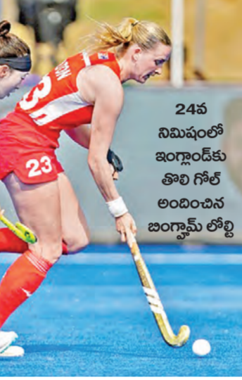
24వ నిమిషంలో ఇంగ్లాండ్ కు తొలి గోల్ లభించిన ఇంగ్లాండ్ లోలి

అంతకుముందు జరిగిన మొదటి సెమీఫైనల్లో ఇంగ్లాండ్ 2-0 గోల్స్ తేడాతో స్వాట్లాండ్ పై గెలుపొందింది. తొలి మ్యాచ్ లో భారత అమ్మాయిలు ఆశ్చర్యంగా కొనసాగుతున్నాయి. సెమీఫైనల్లో ఇటలీని 1-0 తో ఓడించి ప్రపంచకప్ అత్యంత సాధించింది. పరుగులు మూడోసారి ప్రపంచకప్ ఖైర్ అందుకుంది. ఈ ఏడాది ఖైర్ లు, నెవర్లాండ్ లో జరిగిన ప్రపంచకప్ లో పాల్గొనునుంది. 2018 లండన్ ప్రపంచకప్ లో 8వ స్థానం, 2022 వాల్సెయ్ ప్రపంచకప్ లో 9వ స్థానం పొందింది.