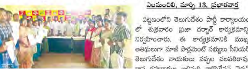
విలంబిలి, మార్చి 13, ప్రభాతవార్త