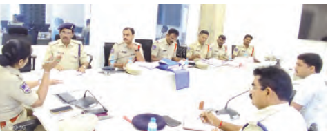
సమీక్షా సమావేశంలో మాట్లాడుతున్న ఎస్పీ

అధికారులకు ఆదేశాలు జారీ చేశారు. ప్రభుత్వ విధానాలను ఉల్లంఘిస్తూ రైతల ధాన్యాన్ని దుర్వినియోగం చేసే రైస్ మిల్లర్లపై కఠిన చర్యలను తీసుకోవాలని సంబంధిత పోలీసు అధికారులకు ఎస్పీ సునిల్ రెడ్డి ఆదేశాలు జారీచేశారు. ఈ సందర్భంగా ఎస్పీ మాట్లాడుతూ రైతులు నుండి ప్రభుత్వం కోసం గోలు చేసిన ధాన్యాన్ని రైస్ మిల్లర్లు దుర్వినియోగం చేయడం, నిల్వలు దాచిపెట్టడం లేదా ప్రభుత్వానికి ఇవ్వాలిని బియ్యాన్ని ఇవ్వకుండా అలస్యం చేయడం వంటి