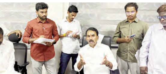
అధికారులతో మాట్లాడుతున్న మంత్రి జాషుజీ కృష్ణారావు

వనపర్తి ప్రతినిధి, మార్చి 14 ప్రభాతవార్త: కొల్హాపూర్ నియోజకవర్గ పరిధిలో చేపట్టిన అభివృద్ధి పనులు, సంక్షేమ పథకాల అమలు, అల్లి దారుల ఎంపిక, సాగునీటి ప్రాజెక్టుల విషయంలో అధికారులు నిర్లక్ష్యం వీడాలని, ప్రజా ధనం దుర్వినియోగం కాకుండా పారదర్శకత పాటించాలని మంత్రులు, సాగునీటి శాఖ మంత్రి జాషుజీ కృష్ణారావు ఆదేశించారు. శుక్రవారం సాయంత్రం వనపర్తి ఐడీఓ కార్యాలయంలో ఏడో, పాస్ గర్, చిన్నబావి, వీపనగండ్ల మండలాలకు చెందిన సర్పంచులు, కార్యదర్శులు, ఎలపీఓలు, డి.ఓ.లు, డి.ఎల్.ఓ.లతో మంత్రి సుదీర్ఘంగా సమీక్షించారు. ముఖ్యంగా ఇందిరమ్మ ఇళ్ళ నిర్మాణంలో అల్లి దారులు ఎదుర్కొంటున్న సాంకేతిక ఇబ్బందులను వెంటనే పరిష్కరించాలని హాసాంగ్ షి.డి. ఏకలను ఆదేశించారు. శ్రేణిస్థాయిలో సమన్వయం స్వయంగా పరిశీలించి నివేదిక ఇవ్వాలని సూచించారు. గ్రామ పంచాయతీలకు వచ్చే నిధులు, 15వ ఆర్థిక సంఘం నిధుల వినియోగంపై మంత్రి అధికారులకు దిశా నిర్దేశం చేశారు. నిధులను ఏ ఏ పనులకు ప్రాధాన్యత క్రమంలో ఖర్చు చేయాలో వివరిస్తూనే, గ్రామాభివృద్ధిలో అధికారులు పాత అత్యంత కీలక మని గుర్తు చేశారు. ఆనంతరం నీటి పారుదల శాఖ అధికారులతో నిర్వ