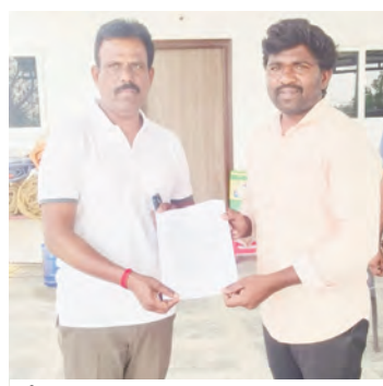
బీయాడబ్ల్యూజే ప్రతినిధులు ఎమ్మెల్యేను కలిసి జర్నలిస్టుల పాల్ కార్కుల సమస్యపై మినీ వర్తం సమర్పిస్తున్న దృశ్యం