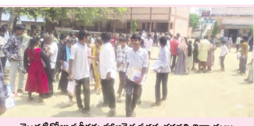
మొదటిరోజు పరీక్షా హాజరైన పది తరగతి విద్యార్థులు

ప్రశాంతంగా ప్రారంభమైన పది తరగతి పరీక్షలు మక్తల్, మార్చి 14 ప్రభాతవార్త : మక్తల్ పట్టణ కేంద్రంలో శనివారం పది తరగతి (ఎన్.ఎస్.సి) వార్షిక పరీక్షలు కట్టడిమైన ఏర్పాట్లమధ్య ప్రశాంతంగా ప్రారంభమయ్యాయి. పరీక్షల మొదటి రోజున ఎక్కడా ఎలాంటి అవాంఛనీయ సంఘటనలు చోటుచేసుకోకుండా విద్యార్థులు ఆధికారులు, పోలీస్ యంత్రాంగం సమన్వయంతో వ్యవహరించారు. పట్టణంలోని ఆరు పరీక్షా కేంద్రాల జిల్లా పరిషత్ బాలల ఉన్నత పాఠశాలలో 290, జిల్లా పరిషత్ బాలికల ఉన్నత పాఠశాలలో 280, గవర్నమెంట్ హైస్కూల్లో 240, బ్రిలియంట్ గ్రామీణ్ హైస్కూల్లో 195, శ్రీ సైకెస్ట్ హై స్కూల్లో 300, కృష్ణవేణి హైస్కూల్లో 237, మొత్తం 1542 మంది విద్యార్థులు హాజరై తమ ప్రతిభను చాటుకున్న మండల విద్యార్థులకు అమీర్ డిన్ తెలిపారు. ఉదయం నుండి విద్యార్థులు తమతమ కేంద్రాలకు చేరుకొని, అధికారులు