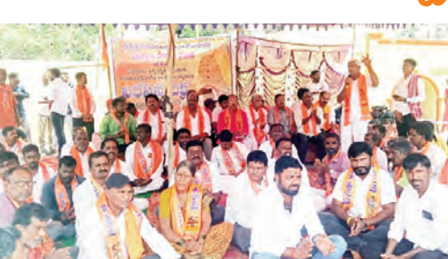
నిరసన దీక్షలో పాల్గొన్న హిందూ సంఘాల నేతలు