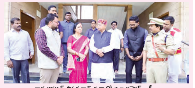
రాష్ట్ర గవర్నర్ శివ ప్రతాప్ శుక్లాతో జిల్లా కలెక్టర్, ఎస్పీ