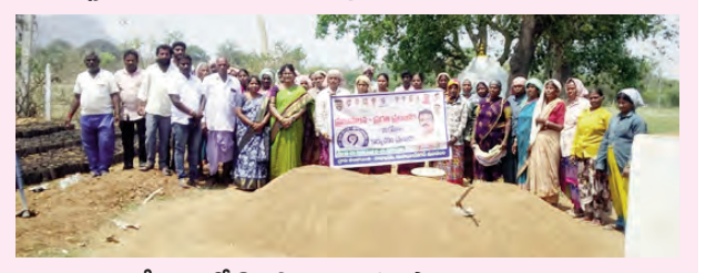
దేవరకల్లలో కొనసాగుతున్న ప్రజా పాలన కార్యక్రమం

మహబూబ్ నగర్ బ్యూరో, మార్చి 14 ప్రభాతవార్త: ప్రజా పాలన - ప్రగతి ప్రణాళిక 99 రోజుల కార్యాచరణలో భాగంగా మహబూబ్ నగర్ జిల్లా మంచాయతీ అధికారి కార్యాలయం ఆధ్వర్యంలో పంచాయతీరాజ్ జిల్లా ఉపాధి శాఖ ద్వారా శుక్రవారం 9 వ రోజు కార్యక్రమాలను జిల్లాలోని అన్ని గ్రామపంచాయతీలలో అధికారులు, ప్రజాప్రతినిధుల సమన్వయంతో, ప్రజల భాగస్వామ్యంతో శానిటేషన్ మెరుగుపరచడం, వోషులనివారణ కోసం ఫాగింగ్ బ్, గ్రామాల్లో ఉన్న నర్సరీల నిర్వహణ పనులను గుర్తింబి వాటి సంరక్షణకు చర్యలు తీసుకున్నారు. మహబూబ్ నగర్ జిల్లాలో మొత్తం 16 మండలాల్లో 423 గ్రామపంచాయతీలు ఉండగా, వాటిలో మొత్తం 423 నర్సరీలు ఉన్నాయి. అందులో 354 నర్సరీలలో నిర్వహణ పనులను గుర్తింబి చేపట్టారు. జిల్లాలో అన్ని గ్రామపంచాయతీల్లో నిర్వహించిన నర్సరీలో మొత్తం 9,082 వీధి కుక్కలను గుర్తించగా, వాటిలో 26 కుక్కలను స్టెరిలైజేషన్ టీకాలు ఇచ్చారు. ఆర్డర్ మండలంలో మొత్తం 17 గ్రామ పంచాయతీలు ఉండగా, 17 నర్సరీలు ఉన్నాయి. వీటిలో 4 నర్సరీలలో నిర్వహణ పనులు గుర్తించారు. బాలాసగర్ మండలంలో 37 గ్రామపంచాయతీలు, 37 నర్సరీలు ఉన్నాయి. కార్యక్రమం సందర్భంగా 7 నర్సరీలలో నిర్వహణ పనులు గుర్తించారు. గ్రామపంచాయతీల్లో 990 వీధి కుక్కలను గుర్తించారు. భూత్పూర్ మండలంలో 19 గ్రామపంచాయతీలలో, 19 నర్సరీలు ఉండగా వాటిలో 15 నర్సరీలలో నిర్వహణ పనులు గుర్తించారు. గ్రామాల్లో 591 వీధి కుక్కలను గుర్తించారు. -మగనా4లో.