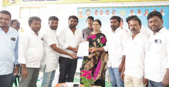
8 మంది నిరుద్యోగులకు సుమారు ఆరు లక్షల రూపాయల విలువైన కార్టెజులను అందజేస్తున్న ఎంపీ డీకే అరుణ

నారాయణపేట, మార్చి 14 ప్రభాతవార్త: నారాయణపేట మండలం కోటకొండ గ్రామంలో చేనేత మరియు జోళ్ళ శాఖ అధ్వర్యంలో కోటకొండ చేనేత కేంద్ర పథకం భాగంగా మగ్గాలు, పరికరాల పంపిణీ కార్యక్రమం నిర్వహించారు. ఈ కార్యక్రమానికి ఎంపీ డీకే అరుణ ముఖ్య అతిథిగా హాజరయ్యారు. ఈ సందర్భంగా ఆమె మాట్లాడుతూ కేంద్ర పథకంలో కేంద్ర ప్రభుత్వం 90 శాతం నిధులు అందిస్తుండగా, చేనేత కార్మికులు 10 శాతం వాటా చెల్లించి పథకాన్ని సర్వీసుయోగం చేసుకోవాలని సూచించారు. కేంద్ర ప్రభుత్వం అందిస్తున్న సహాయాన్ని ఉపయోగించుకుని చేనేత కళాకారులు తమ జీవనోపాధిని మెరుగుపరుచుకోవాలని ఆహ్వానించారు. భవిష్యత్తులో కూడా చేనేత కార్మికులకు అవసరమైన సహాయ సహకారాల కోసం తాను ఎప్పుడూ వారి వెన్నంటి ఉంటానని భరోసా ఇచ్చారు. ఈ కార్యక్రమంలో మొత్తం పాల్గొన్న 72 మంది చేనేత కళాకారులను మగ్గాలు, పరికరాలను పంపిణీ చేశారు. తెలంగాణ పౌల్ట్రీ ఫెడరేషన్, నేషనల్ ఎగ్ కోఆర్డినేషన్ కమిటీ సహకారంతో నిరుద్యోగులకు ఉపాధి కల్పించే ఉద్దేశంతో ఎగ్స్, వికెట్ ఫాస్ట్ ఫుడ్ కార్పొరేషన్లకు కూడా పంపిణీ చేశారు. 8 మంది నిరుద్యోగులకు సుమారు ఆరు లక్షల రూపాయల విలువైన కార్టెజులు అందజేశారు. అల్లి దారులు ఈ అవకాశాన్ని సర్వీసుయోగం చేసుకుని ఆర్థికంగా అభివృద్ధి చెందాలని ఆమె సూచించారు. అదే సందర్భంగా భూనీడ్ గ్రామంలో ఆర్టిఎండ్ పార్ట్ కేరీమిట్ల సహకారంతో ఏర్పాటు చేసిన ట్రాగునీటి శుద్ధి కేంద్రంను ఎంపీ డీకే అరుణ ప్రారంభించారు. ప్రజలు కలుషిత నీరు ట్రాగి ఆనారో