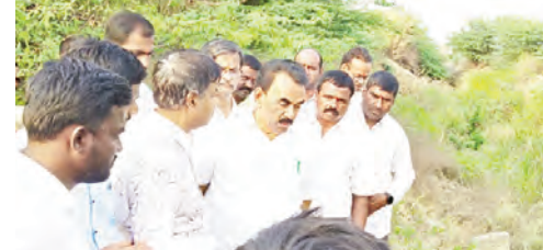
తెగిపోయిన బీమా కాలవను అధికారులతో కలిసి పరిశీలించిన మంత్రి జాషుద్ కృష్ణారావు

పీవనగడ్ల మార్చి 14, ప్రభాతవార్త : మండలంలోని నాగర్ బండ్ తండా సమీపంలోని బీమా 16వ ప్యాకేజీ 62వ కిలోమీటర్ దగ్గర కాలవ తెగిపోయి ఏడు సంవత్సరాలు గడిచినా సంబంధిత కాంట్రాక్టర్ ఎందుకు పని పూర్తి చేయలేదని అధికారులతో ఎన్డీజీ పర్యవేక్షణ శాఖ యంత్ర బల పూర్తి కృష్ణారావు అధికారులను నిలదీశారు. శనివారం నాడు ఆయన అకస్మాత్తుగా నాగర్ బండ్ తండా సమీపంలో ఉన్న బీమా కాలవను వాగుపై సమీపంలో ఉన్న బ్రిడ్జి ఆయన బీమా అధికారులతో పరిశీలించారు. ఆ కాలవ ద్వారా దాదాపు 6వేల ఎకరాలకు సాగునీరు అందడం జరుగుతుందని అధికారులు ఆయనకు తెలిపారు. ఇది శ్రీరాజాపూర్ నుండి రామాపురం వరకు ఈ కాలవ ద్వారా దాదాపు 76 కిలోమీటర్లు 16,600 ఎకరాలకు సాగునీరు అందడం జరుగుతుందని బీమా అధికారులు ఆయనకు తెలిపారు. అయితే ఈ కాలవ 2019లో తెగిపోయినట్లుంటే విషయాన్ని రైతులతో అడిగి తెలుసుకున్నారు. భారీ వర్షాలకు తెగి పోయి దాదాపు 100 మీటర్ల వరకు ఈ కాలవ గండిపడి సాగునీరు