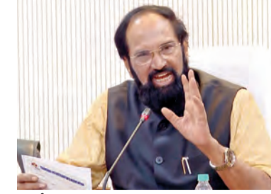
ఎలీజె డిప్యూటీలర్లు ఉన్నారని మంత్రి వివరించారు. రాష్ట్రవ్యాప్తంగా సుమారు 1.3 కోట్ల గ్యాస్ కనెక్షన్లు ఉండగా, అందులో 11 లక్షలు ఉజ్వల పతకం, 28 లక్షలు దీపం పతకం కింద ఉన్నాయని, అదనంగా 7.5 లక్షల కమిటీలతో కనెక్షన్లు కూడా ఉన్నాయని గణాంకాల విభాగం

గ్యాస్ దుర్వినియోగం జరకుండా చర్యలు చేపడుతున్నామని తెలిపారు. రాష్ట్రంలో గృహ వినియోగం గ్యాస్ సరఫరాలో అలాంటి కోత లేదని, వాణిజ్య అవసరాల తీర్చే గ్యాస్ సరఫరాలో కోత ఉంది. ప్రతి నెల రాష్ట్రంలో 58 లక్షల నుంచి 60 లక్షల వరకు గృహ వినియోగం గ్యాస్ సరఫరా అవుతున్నాయని మంత్రి ఉత్తమ్ చెప్పారు. గృహ వినియోగం సరఫరాలో అలాంటి సమస్య లేదని స్పష్టం చేశారు. ప్రతిజిజి సుమారు 2.5 లక్షల గ్యాస్ సరఫరా జరుగుతున్నాయని తెలిపారు. రాష్ట్రంలో ప్రస్తుతం మొత్తం 811