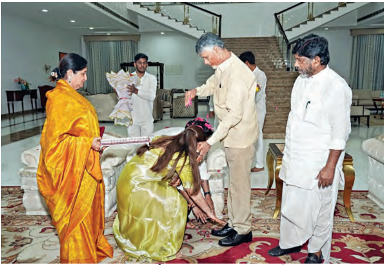
శనివారం హైదరాబాద్ లో తెలంగాణ డి.సి.ఎం భక్తి నివాసానికి వెళ్లి