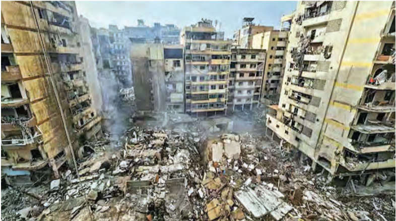
ఇజ్రాయెల్ వైమానిక దాడితో బీరుట్ శివారులోని హారెట్ హీరో నేల మట్టమైన భవనాలు

భారత్ కు ఇరాన్ సానుకూల వైఖరి ఇదిలా ఉంటే హర్యాణా జలసంధి మీదుగా భారత్ నౌకలు ప్రయాణించేందుకు ఇరాన్ అనుమతించింది. ఇప్పటికే మూడు నౌకలు జలసంధిని దాటితే మరో రెండు నౌకలు తాజాగా శనివారం కూడా హర్యాణా జలసంధి మీదుగా భారత్ కు వస్తున్నాయి. ఆదివారంవారాల్లో గుజరాత్ కాండ్ల రేవుకు చేరుకుంటాయని అధికారులు పేర్కొంటున్నారు.