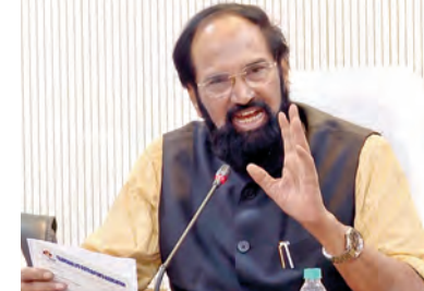
ఎల్పిజి డిస్ట్రిబ్యూటర్లు, కన్యూని మంత్రి వివరించారు. రాష్ట్రవ్యాప్తంగా సుమారు 1.3 కోట్ల గ్యాస్ కనెక్షన్లు ఉండగా, అందులో 11 లక్షలు ఉన్నాయి. వరకు, 28 లక్షల దీపం వరకు కింద ఉన్నాయని, అందులో 7.5 లక్షల కమర్షియల్ కనెక్షన్లు కూడా ఉన్నాయని గణాంకాల ద్వారా

గ్యాస్ దుర్వినియోగం జరగకుండా చర్యలు చేపడుతున్నామని తెలిపారు. రాష్ట్రంలో గృహ వినియోగ గ్యాస్ సరఫరాలో కొంత భాగం ఉన్నట్లు సుప్రసం చేశారు. ప్రతి నెల రాష్ట్రంలో 58 లక్షల సీలీంగ్స్ వరకు గృహ వినియోగ గ్యాస్ సరఫరాలో ఎలాంటి సమస్య లేదని సుప్రసం చేశారు. ప్రతిరోజూ సుమారు 2.5 లక్షల గ్యాస్ సీలీంగ్స్ సరఫరా జరుగుతున్నాయని తెలిపారు. రాష్ట్రంలో ప్రస్తుతం మొత్తం 811