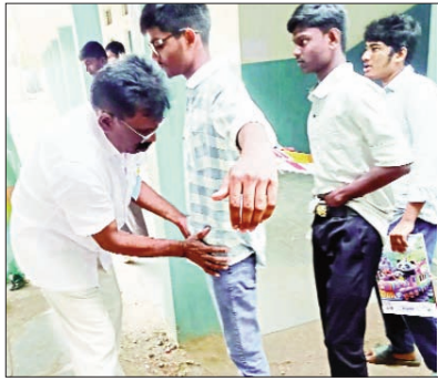
జనం ఉన్నట్లయితే వారిపై శాఖా పరమైన చర్యలు తప్పవన్నారు. విద్యార్థులు ప్రశాంతంగా పరీక్షలు రాసేందుకు సహకరించాలని ఆయన మండల ప్రజలను కోరారు.