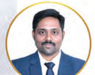
N Tej Bharath, IAS., Metropolitan Commissioner, VMRDA

UB Complex, Siripuram Junction, Visakhapatnam