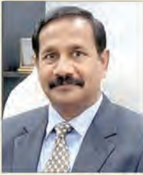
SHRI MUPPALLA SRINIVAS Development commissioner