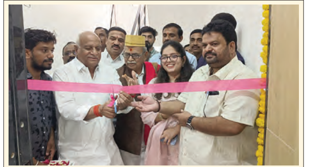
ఆసుపత్రిని ప్రారంభిస్తున్న ఎమ్మెల్యే పవార్ రామారావు పట్టే

చేరడంతో ఆరోగ్య సమస్యలను ఎదుర్కొంటున్నారని ఆస్తమా, దీర్ఘకాలిక ఇతర వ్యాధుల బారిన పడుతున్నామని అన్నారు. బూడిద ద్వారా వాయు కాలుష్యానికి ప్రజలతో పాటు మొక్కలు, పశువులు రోగాల బారిన పడుతున్నాయని అన్నారు. రాత్రి, పగలు తేడా లేకుండా ప్లాంట్ లో నడిచే భారీ యంత్రాల శబ్దానికి గ్రామస్థులు నిద్రలేసి రాత్రులు గడుపుతున్నట్లు తెలిపారు. ఎస్.టి.పి.పి అధికారులు నిర్లక్ష్యంగా వ్యవహరిస్తూ, పెగడపల్లి గ్రామ సంక్షేమాన్ని గాలి కోదలేశారని అన్నారు. ప్లాంట్ ప్రభావిత గ్రామాలను వెంటనే సురక్షిత ప్రాంతానికి తరలించి, ఆర్ అండ్ ఆర్ ప్యాకేజీ వర్తింపజేసేలా చర్యలు తీసుకోవాలని డిమాండ్ చేశారు. కాలుష్య నియంత్రణ మండలి ఇచ్చిన కాలుష్య నివేదికలను సింగరేణి పవర్ ప్లాంట్ అధికారులు బహిర్గతం చేయాలని డిమాండ్ చేశారు.