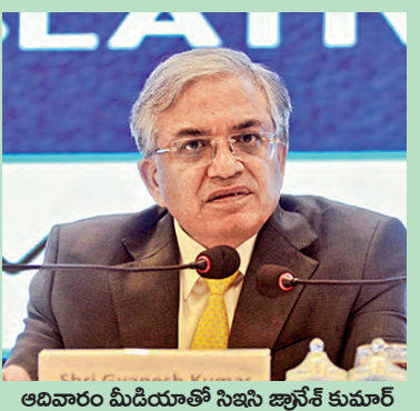
ఆదివారం మీడియాతో సిఇసి జ్యూనియర్ కుమార్

ఏప్రిల్ 9న కేరళ, అసోం, పుదుచ్చేరి 23న తమిళనాడు ఒకే దఫా ఎన్నికలు బెంగాల్ లో రెండు విడతలుగా పోలింగ్ 8 లసెంట్ల ఉప ఎన్నికలు కూడా 23న, మే 4న ఓట్ల లెక్కింపు