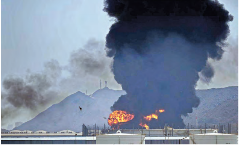
ఆదివారం ఇరాన్ లోని ఇస్ఫహాన్ లోని అణ్వశక్తి ప్లాంట్ లోని అగ్ని ప్రమాదం