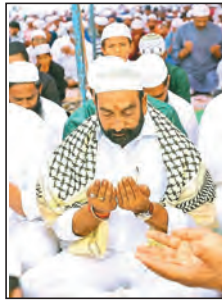
ఇస్టాల్ విందులో పాల్గొన్నారు.