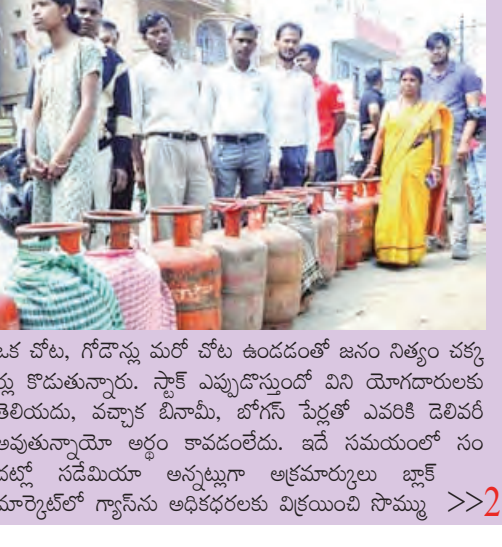
ఒక చోట, గోడౌన్లు మరో చోట ఉండడంతో జనం నిత్యం చక్కెర కేసుకు వచ్చారు. స్టాక్ ఎప్పుడొస్తుందో విని యోగదారులకు తెలియదు, వచ్చారు బినామీ, బోగస్ పెద్దతో ఎవరికి డెలివరీ అవుతున్నాయో అర్థం కావడంలేదు. ఇదే సమయంలో సం దర్భో సడెమీయా అన్నట్లుగా అక్రమార్కులు భక్త మార్కెట్లో గ్యాస్ ను అధికదరలకు విక్రయించి సొమ్ము >>2

దుబాయ్ ఎయిర్ పోర్టుపై ఇరాన్ దాడి దుబాయ్, మార్చి 15: అమెరికా-ఇజ్రాయెల్ కూటమి, ఇరాన్ మధ్య దాడులు తీవ్రస్థాయికి చేరాయి. ఆదివారం ఇరాన్ జరిపిన క్షిపణి దాడులతో దుబాయ్, కువైట్ నగరాలు దడరిల్లాయి. దుబాయ్ లోని ప్రధాన ఆర్థిక కేంద్రాలు, మెరీనా, అల్ సువ్రాహ్ వంటి నివాస ప్రాంతాలలో భాగపేరుకు శబ్దాలు వినిపించాయి. దుబాయ్ ఎయిర్ పోర్టు సమీపంలో క్షిపణి శకలాలు పడటంతో విమాన రాకపోకలకు అంతరాయం కలిగింది. భద్రతా కారణాల వల్ల దుబాయ్ ఇంటర్నేషనల్ ఎయిర్ పోర్ట్ కార్యకలాపాలను తాత్కాలికంగా నిలిపివేసినట్లు అధికారులు ప్రకటించారు.