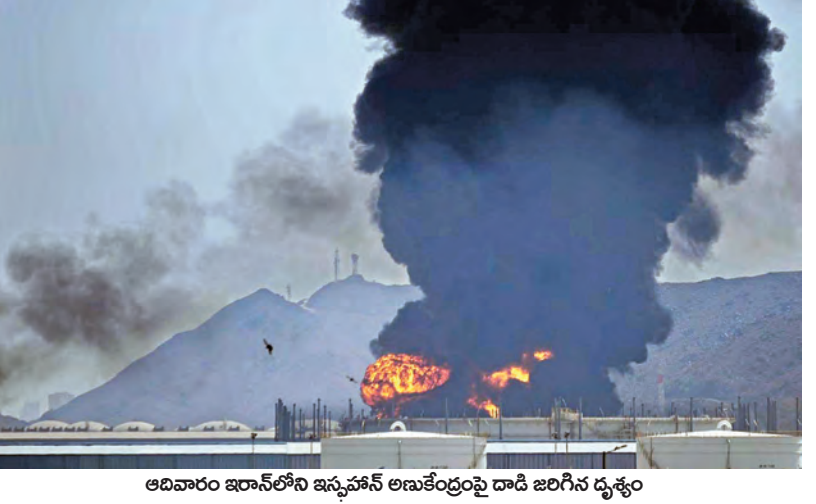
ఆదివారం ఇరాన్ లోని ఇస్ఫాహాన్ అణుకేంద్రంపై దాడి జరిగిన దృశ్యం

16-3-2026 సోమవారం సంపుటి: 32 సం.ది: 44 పేజీలు: 12 వెల: 6.50