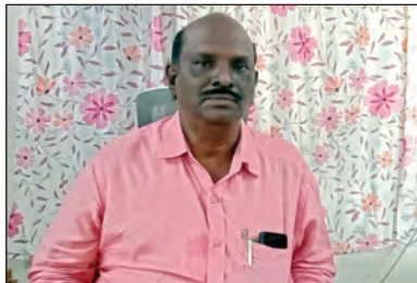
అధికారి పాత్రకేయిలకు తెలిపారు. పి.ఎం.జి. వేద పాఠశాల, మోడరన్ గ్రీన్ వ్యాలీ, భారతరత్న ఇందిరాగాంధీ మునిసిపల్ కున్