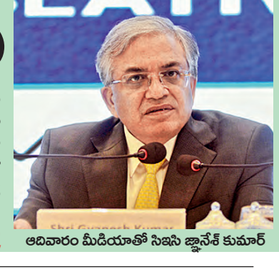
ఆదివారం మీడియాతో సిఇసి జ్ఞానేశ్ కుమార్

ఏప్రిల్ 9న కేరళ, అసోం, పుదుచ్చేరి 23న తమిళనాడు ఒకే దఫా ఎన్నికలు బెంగాల్ లో రెండు విడతలుగా పోలింగ్ 8 లసింట్లీ ఉప ఎన్నికలు కూడా 23న, మే 4న ఓట్ల లెక్కింపు