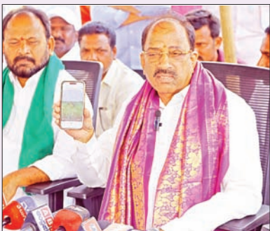
ఏప్రిల్ నెలాఖరు నాటికి గోడ్రెజ్