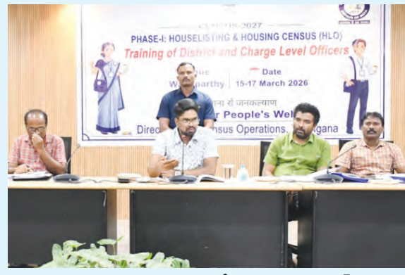
అధికారుల శిక్షణ కార్యక్రమంలో మాట్లాడుతున్న కలెక్టర్