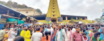
స్వామి వారి దర్శనానికి తరలివచ్చిన భక్తజనం