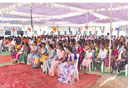
సమ్మేళనానికి హాజరైన ప్రజలు