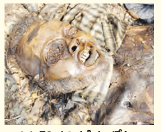
గురు తెలియని వ్యక్తి మృతదేహం

గురుతెలియని మృతదేహం కలకలం.. వివరాలు తెలిసిన వెంటనే సమాచారం ఇవ్వండి దేవరకల్ల, మార్చి 15 ప్రభాతవార్త : దేవరకల్ల మండలం డోకురు గ్రామ శివారులోని తపోవన పాఠశాల సమీపంలో గురుతెలియని వ్యక్తి మృతి చెందిన ఘటన స్థానికంగా కలకలం రేపింది. స్థానికులు ఓ వ్యక్తి చనిపోయి పడి ఉన్న అనుమానాస్పద స్థితిలో మృతదేహం కనిపించడంతో గమనించి వెంటనే పోలీసులకు సమాచారం అందించారు. సమాచారం అందుకున్న దేవరకల్ల పోలీసులు ఘటన స్థలానికి చేరుకుని మృతదేహాన్ని పరిశీలించారు. మృతదేహ వివరాలు తెలుసుకునేందుకు ప్రయత్నించినప్పటికీ ఎటువంటి గుర్తింపు ఆధారాలు లభించలేదని పోలీసులు తెలిపారు. మృతదేహ వయస్సు సుమారు 45 నుండి 50 సంవత్సరాల మధ్య ఉండొచ్చని, ఆయన పనులు దబ్బాలు చొక్కా, నీలి రంగు ప్యాంతులు ధరించి ఉన్నట్లు గుర్తించారు. మృతుడు సుమారు 15 రోజులు క్రితమే మృతి చెందినట్లు పోలీసులు అనుమానిస్తున్నారు. ఈ నేపథ్యంలో మృతుడిని ఎవరైనా గుర్తిస్తే లేదా అతని గురించి ఎవరైనా సమాచారం తెలిసి ఉంటే వెంటనే పోలీసులకు తెలియజేయాలని దేవరకల్ల ఎస్పీ నాగన్న సోపలే మీడియా ద్వారా ప్రజలను కోరారు. ఈ ఘటనపై గ్రామ కార్యదర్శి రాఘవేంద్రరావు ఫిర్యాదు మేరకు పోలీసులు కేసు నమోదు చేసి దర్యాప్తు చేపట్టారు.