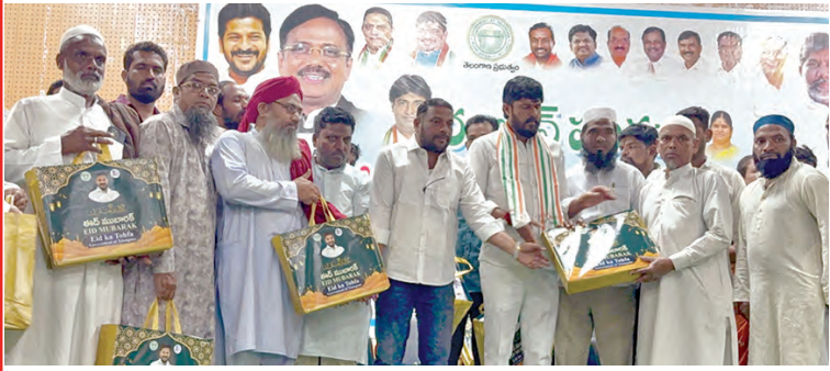
నిరుపేద ముస్లింలకు రంజాన్ తోపాటు పంపిణీ చేస్తున్న దృశ్యం