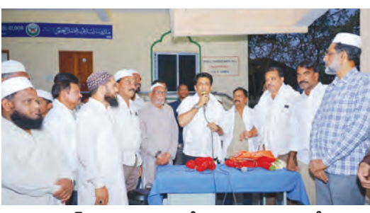
ఇష్టార్ విందు కార్యక్రమంలో మాట్లాడుతున్న ఎమ్మెల్యే