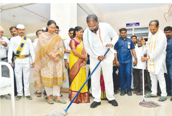
ఫ్లోరింగ్ చేస్తున్న మంత్రి శ్రీవారి చిత్తంలో ఎమ్మెల్యే అనిరుద్ రెడ్డి

కార్మికులతో కలిసి ఆసుపత్రిలో ఫ్లోరింగ్ శుభ్ర పరిచారు. ఆసుపత్రి భవనం, పరిసరాలను ప్రతినీత్యం శుభ్రంగా ఉంచుకోవడం ఎంతో ముఖ్యమని అన్నారు. అనంతరం మంత్రి వాణిశ్రీవారి మాట్లాడుతూ ప్రభుత్వం చేపట్టిన సంక్షేమ, అభివృద్ధి కార్యక్రమాలు గ్రామీణ ప్రాంతాల్లోనే పేద, అణగారిన వర్గాలకు చేరాలి చేయడమే లక్ష్యంగా ప్రజాపాలన-ప్రగతి ప్రణాళిక 99 రోజుల కార్యక్రమం చేపట్టినట్లు తెలిపారు. ఈ కార్యక్రమంలో పరిశుభ్రత, ఆరోగ్యం, విద్య, రోడ్డు భద్రత, మహిళా, శిశు సంక్షేమం, యువజన అభివృద్ధి, క్రీడలు, వర్షావరణ పరిరక్షణ వంటి పది ప్రధాన అంశాలపై ప్రత్యేక దృష్టి పెట్టినట్లు చెప్పారు. గత రెండు సంవత్సరాలలో కాంగ్రెస్