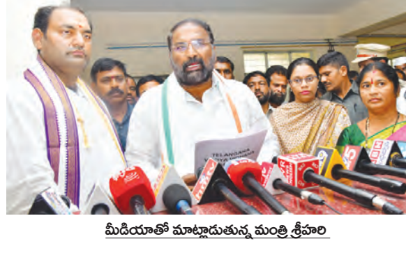
మీడియాతో మాట్లాడుతున్న మంత్రి శ్రీవారి

ప్రభుత్వం చేసిన అనేక పనులను గురించి వివరించారు. రైతులకు రూ.2 లక్షల వరకు రుణమంజూరీ చేయడం, సన్న రక డాన్యం పండించే రైతులకు క్వింటాల్ రూ.500 జోసన్ ఇవ్వడం, 200 యూనిట్లలోపు ఉచిత విద్యుత్ అందించడం వంటి హామీలను ప్రభుత్వం అమలు చేస్తున్నట్లు మంత్రి తెలిపారు. మహిళల ఆర్థిక, సామాజిక సౌకర్యాల కోసం అనేక కార్యక్రమాలు చేపట్టినట్లు చెప్పారు. మహిళా స్వయం సహాయక సంఘాల సభ్యులకు వడ్డీ లేని రుణాలు, ఆర్టీసీ బస్సుల్లో ఉచిత ప్రయాణం, మహిళా సంఘాలకు పెట్రోల్ బంకులు కేటాయింపడం, ఆర్టీసీ బస్సులు ఇచ్చి యజమానులుగా ప్రోత్సహించడం వంటి చర్యలు చేపట్టినట్లు వివరించారు. ఇందిరమ్మ గృహ పథకం కింద రాష్ట్రంలోని ప్రతి నియోజకవర్గంలో మహిళల పేరుపై 3,600 ఇండ్లు నిర్మిస్తున్నామని మంత్రి తెలిపారు. స్వయం సహాయక సంఘాల సభ్యులకు టీమా సౌకర్యం కల్పించామని, సభ్యులకు మరణశ్రీ ఆమె తీసుకున్న రుణాలను ప్రభుత్వం మాఫీ చేస్తుందని చెప్పారు. రాష్ట్రంలో కనీసం ఒక కోటి మంది మహిళలను కోటిశ్రులంగా తీర్చిదిద్దడమే ప్రభుత్వ లక్ష్యమని తెలిపారు. ముఖ్యమంత్రి రేవంత్ రెడ్డి మహాబూబ్ నగర్ జిల్లాకు చెందినవారు కావడంతో జిల్లాభివృద్ధికి ప్రత్యేక నిధులు అందించేందుకు సిద్ధంగా ఉన్నారని మంత్రి పేర్కొన్నారు. జడ్చర్ల ఎమ్మెల్యే అనిరుద్ రెడ్డి నియోజకవర్గ అభివృద్ధి కోసం నిరంతరం - మగసూర్3టి..