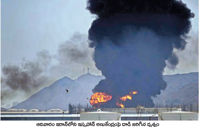
ఆదివారం ఇరాన్ లోని ఇస్ఫాహాన్ అటవీ ప్రాంతం దాడి జరిగిన దృశ్యం