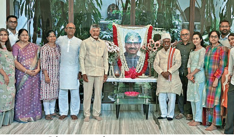
అదివారం హైదరాబాద్ లోని కావూరి నివాసంలో ఆయన చిత్రపటం వద్ద నివాళి అర్పిస్తున్న ఎపి చంద్రబాబు