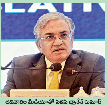
ఆదివారం మీడియాతో సిఇసి జ్ఞానేశ్ కుమార్

ఏప్రిల్ 9న కేరళ, అసోం, పుదుచ్చేరి 23న తమిళనాడు ఒకే దఫా ఎన్నికలు బెంగాల్ లో రెండు విడతలుగా పోలింగ్ 8 లసెంట్లీ ఉప ఎన్నికలు కూడా 23న, మే 4న ఓట్ల లెక్కింపు