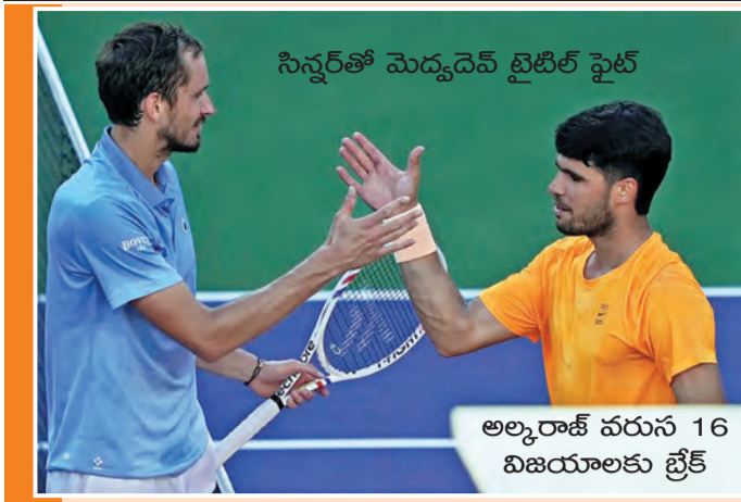
నిస్సర్తో మెద్యుడెన్ టైటిల్ ఫైట్