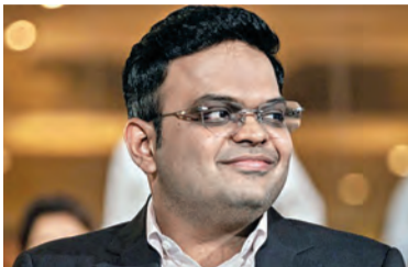
పాక్, బంగ్లాకు వార్షికోత్సవం

ముంబై: క్రికెట్లో ఐసీసీ సుప్రీం అని పరోక్షంగా పాకిస్తాన్, బంగ్లాదేశ్కు మరకలంటించాడు ఐసీసీ ఛైర్మన్ జైపా. భారత్, శ్రీలంక సంయుక్తంగా ఆతిథ్యమిచ్చిన టీ20 ప్రపంచకప్లో పాకిస్తాన్, బంగ్లాదేశ్ నాలుకాలపై ఎట్టకేలకు జైపా మోసం వీడారు. భారత్లో ఆడించిన నిరాకరించిన బంగ్లా దేశ్ టోర్నీ నుంచి తప్పుకుంది. బంగ్లాదేశ్కు సంఘ బాంధవంగా పాకిస్తాన్ కూడా టీ20 ప్రపంచకప్లో టీమిడియాతో జరిగే మ్యాచ్ను బాన్సెయిట్ చేస్తానని డెకలరేషన్ చేసింది. బివరకు యూటర్న్ తీసుకుని మ్యాచ్ ఆడింది. టీ20 ప్రపంచకప్ ముగిసిన వారం రోజులకు జైపా దీనిపై స్పందించాడు. ముంబైలో జరిగిన ఇండియన్ బిజినెస్ లీడర్ అవార్డులలో మాట్లాడు