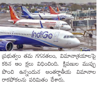
ప్రభుత్వం తమ గగనచరితం, విమానాశయాలుపై కఠిన ఆంక్షలు విధించింది. క్లిష్టమైన ముప్పు వారికి అనుభవించే అవకాశం తగ్గించి విమానాల రాకపోకలను పరిమితం చేశారు.

బెన్సిన్ దిగ్గజం రోజర్ ఫెడరర్, ర్యాపర్ డాక్టర్ డ్రే, హాలివుడ్ దిగ్గజ దర్శకుడు జేమ్స్ కామరాన్ వంటి వారు ఉన్నారు. విమానాల్లో ఉచితంగా టిక్కెట్ మార్చుకునే సౌకర్యాన్ని కల్పిస్తున్నట్లు ఎయిర్ ఇండియా తెలిపింది. ప్రయాణానికి సిద్ధమయ్యే ముందు విమానం సంస్థల ఆధికారిక వెబ్ సైట్లపై లేదా మొబైల్ యాప్ ల ద్వారా తమ ఫ్లైట్ స్టేటస్ ను సరిమానుకోవాలని ఆధికారిక విజ్ఞప్తి చేస్తున్నారు. ఇరాన్ అమెరికా మధ్య క్లిష్టి రిఫండ్ లేదా తదుపరి అందుబాటులో ఉన్న