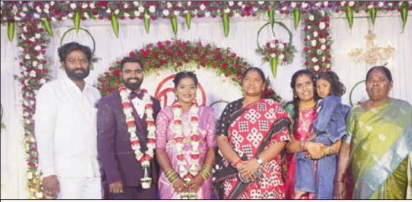
ఆత్మకూరు, ప్రభాతవార్త మార్చి 15: