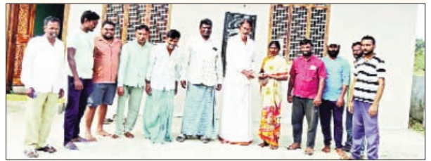
దుగ్గండి, మార్చి 15, ప్రభాతవార్త