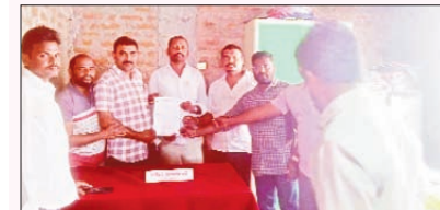
దుగ్గొండి, మార్చి 15, ప్రభాతవార్త

జాతీయ నాయకుల విగ్రహాల ఏర్పాటు నర్సంపేటలోని కేటాయించాలని మన్మథరావు రం సరసవంత్ గోగుల శ్రీనివాస్ రెడ్డి కో