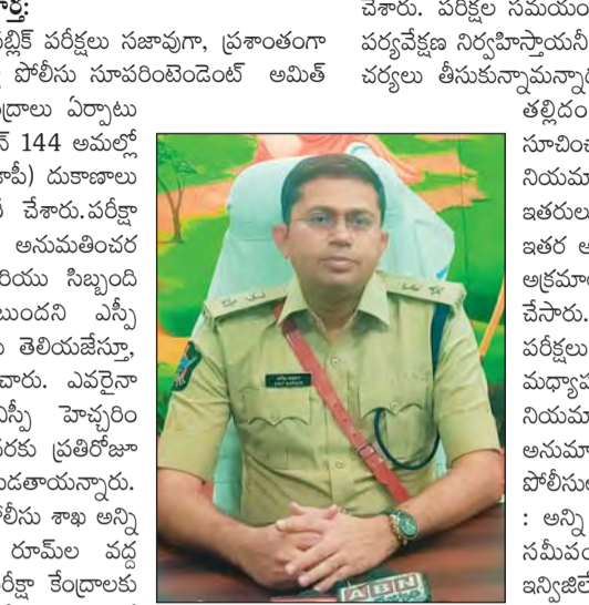
జిల్లాలో 10వ తరగతి పరీక్షల నిర్వహణకు కట్టుదిట్టమైన భద్రతా ఏర్పాటు చేసారు. జిల్లా వ్యాప్తంగా మొత్తం 72 పరీక్షా కేంద్రాలు ఏర్పాటు చేయబడినట్లు ఆయన తెలిపారు.

అల్లూరి సీతారామరాజు జిల్లాలో 10వ తరగతి (ఎస్ఎస్ సి) పరీక్షల నిర్వహణకు కట్టుదిట్టమైన భద్రతా ఏర్పాటు చేసారు. జిల్లా వ్యాప్తంగా మొత్తం 72 పరీక్షా కేంద్రాలు ఏర్పాటు చేయబడినట్లు ఆయన తెలిపారు.