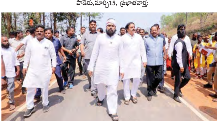
డిసిఎం పవన్ కళ్యాణ్ పర్యటన ఓ మధుర జ్ఞాపకం. పాడేరు, మార్చి 15, ప్రభాతవార్త.

అల్లూరి జిల్లా పాడేరు మండలం కాడేలు పంచాయతీ వద్దపల్లి, వంటలూమిడి పంచాయతీ నందిగరపు గ్రామంలో ఆంధ్రప్రదేశ్ ఉప ముఖ్యమంత్రి, పంచాయతీరాజ్ శాఖ మంత్రి కోటివెల పవన్ కళ్యాణ్ పర్యటన ఓ మధుర జ్ఞాపకంగా చెప్పొచ్చు. పట్టుమని 200 మంది జనాభా లేని గ్రామంలో ఉప ముఖ్యమంత్రి స్థాయి నాయకులు పర్యటించడం ఆంధ్రప్రదేశ్ రాజకీయ చరిత్రలోనే తొలిసారి.