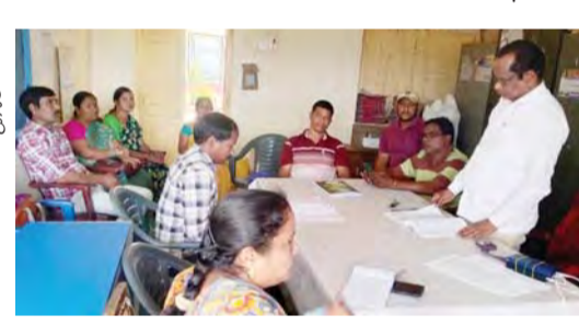
పాడేరు గిరిజన పరీక్షలకు విద్యార్థులు సిద్ధులు. టెన్స్ పరీక్షలు 11,988 విద్యార్థులు పాల్గొంటారు.

పాడేరు గిరిజన పరీక్షలకు విద్యార్థులు సిద్ధులు. టెన్స్ పరీక్షలు 11,988 విద్యార్థులు పాల్గొంటారు. పాడేరు గిరిజన పరీక్షలకు విద్యార్థులు సిద్ధులు. టెన్స్ పరీక్షలు 11,988 విద్యార్థులు పాల్గొంటారు.