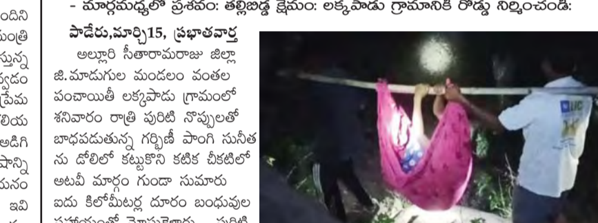
పులిలో నిప్పులతో దోబిలో కటిక చీకటిలో గిరిజన మహిళ. పాడేరు, మార్చి 15, ప్రభాతవార్త.

పాడేరు, మార్చి 15, ప్రభాతవార్త: అల్లూరి సీతారామరాజు జిల్లా జి.మాడగుల మండలం వంతల పంచాయతీ లక్ష్మీపాడు గ్రామంలో శనివారం రాత్రి పులిలో నిప్పులతో బాధపడుతున్న గిరిజన మహిళలకు సహాయం చేసారు.