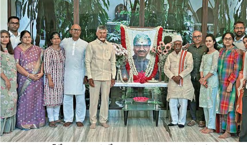
అదివారం హైదరాబాద్ లోని కావూరి నివాసంలో ఆయన చిత్రపటం వద్ద నివాళి అర్పిస్తున్న సీఎం చంద్రబాబు