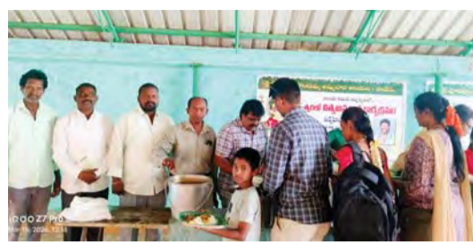
అమ్మవారి భక్తులకు అన్న ప్రసాదం ఏర్పాటు చేసారు. ఈ కార్యక్రమానికి ముఖ్య అతిథులుగా పాడేరు మెడికల్ ఆఫీసర్ మరియు విశాఖపట్నం గిరిజన ఉద్యోగుల సంఘం నాయకులు కూడా వెలుగుతున్నారు.

గిరిజన ఆధ్వర్యం ద్వారా అమ్మవారి భక్తులకు అన్న ప్రసాదం ఏర్పాటు చేసారు. ఈ కార్యక్రమానికి ముఖ్య అతిథులుగా పాడేరు మెడికల్ ఆఫీసర్ మరియు విశాఖపట్నం గిరిజన ఉద్యోగుల సంఘం నాయకులు కూడా వెలుగుతున్నారు.