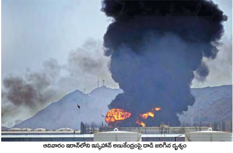
ఆదివారం ఇరాన్ లోని ఇస్ఫహాన్ అణుకేంద్రంపై దాడి జరిగిన దృశ్యం

epaper.vaartha.com WWW.VAARTHA.COM విశాఖపట్నం 16-3-2026 సోమవారం సంపుటి: 32 సంవత్సరం: 44 పేజీలు: 16 వెలు: 6.50