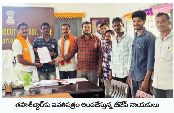
తహశీల్దార్ కు వినతిపత్రం అందజేస్తున్న బీజేపీ నాయకులు