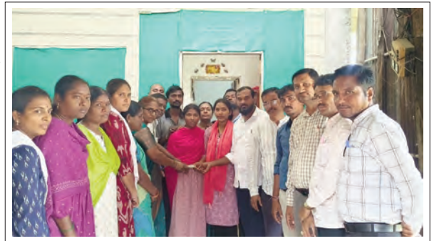
పిల్లలకు ఆర్థిక సహాయం అందిస్తున్న ఉపాధ్యాయులు