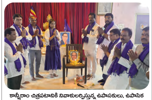
కాన్పూర్లోని చిత్రపటానికి నివాళులర్పిస్తున్న ఉపాసకులు, ఉపాసిక