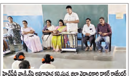
హెచ్పీవీ వ్యాక్సిన్ పట్ల అపోహలు వద్దు