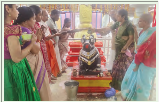
నందికేశ్వర స్వామికి అభిషేకం చేస్తున్న భక్తులు