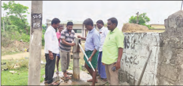
బోరు మరమ్మత్తు పనులను పర్యవేక్షిస్తున్న సర్పంచ్