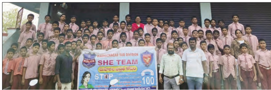
అవగాహన కల్పిస్తున్న షీటీం సభ్యులు