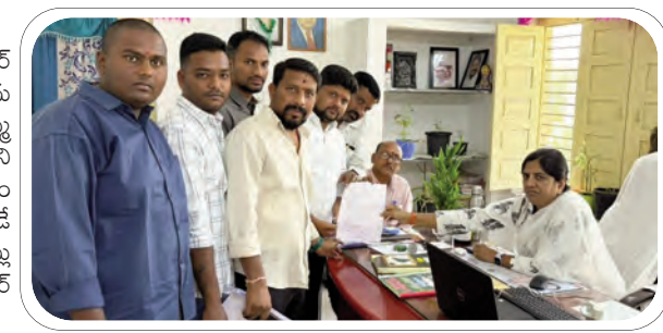
హెచ్పీవీ వ్యాక్సిన్ పట్ల అపోహలు వద్దు