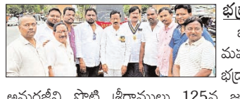
భద్రాచలం కల్లూర్, ప్రభాతవార్త :