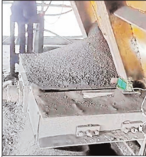
సాంకేతిక లోపం తలెత్తిన వెబ్రిడ్జి (ఫైల్ ఫోటో)

కోయగూడెం ప్రాజెక్టు అధికారి వ్యవహార శైలి వివాదాస్పదమైంది. నిర్వాసిత ప్రజలు, కార్యాలయ సిబ్బంది పట్ల ఆయన ప్రదర్శిస్తున్న వైఖరి చర్చనీయాంశంగా మారింది. 2001లో గని ఆవిర్భావం నుంచి ఎంతోమంది ప్రాజెక్టు అధికారులు ఇక్కడ విధులు నిర్వహించారు. అందరికన్నా భిన్నంగా ప్రస్తుతం ఇక్కడ పనిచేస్తున్న ప్రాజెక్టు అధికారి వ్యవహార శైలి ఉండడంతో పాటుగా, సంస్థ ప్రయోజనాల సైతం పట్టించుకోకుండా వ్యవహరిస్తున్న తీరు పై సింగరేణి ఉన్నతాధికారులు చర్యలు తీసుకోవాలని కార్మిక సంఘాల డిమాండ్ చేస్తున్నాయి.