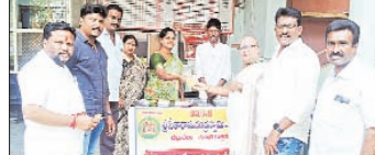
భద్రాచలం టౌన్, ప్రభాతవార్త :