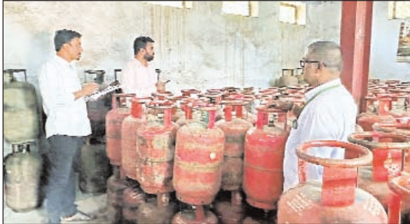
తో కస్టమర్లకు సకాలంలో సరఫరా అవుతుందా లేదా అన్న విషయాన్ని స్టాక్ రిజిస్ట్రేషన్ లను పరిశీలించి గ్యాస్ సిలిండర్లు బ్లాక్ మార్కెట్ కు తరలించకుండా జాగ్రత్తలు పాటించాలని గ్యాస్ సిలిండర్లు బ్లాక్ మార్కెట్ కు తరలిస్తే డిలర, తరలించిన వారిపై కఠిన చర్యలు తీసుకుంటామని తెలిపారు.