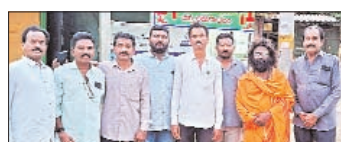
దుమ్ముగూడెం, ప్రభాతవార్త :