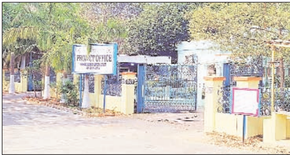
వాటిల్లింది. నష్టపోయిన సొమ్మును సింగరేణి యాజమాన్యం రికవరీ చేస్తుందా..? లేదా ..? అనే ప్రశ్నలు ఉత్పన్నమవుతున్నాయి.

కోయగూడెం ఓసి నుంచి రవాణా అయిన బొగ్గులో వేబ్రిడ్జి తలెత్తిన సాంకేతిక సమస్యను అధికారులు గుర్తించకపోవడంతో వేలాది టన్నుల బొగ్గు ను యాజమాన్యం నష్టపోవాల్సి వచ్చింది. కోయగూడెం ప్రాజెక్టు అధికారి పర్యవేక్షణ లోపం వలన కోట్ల రూపాయలు సింగరేణికి నష్టం