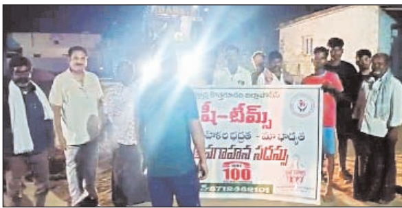
భద్రత కల్పించడం అందరి బాధ్యత అని తెలిపారు. కార్యక్రమంలో స్థానిక యువకులు, గ్రామస్తులు పాల్గొన్నారు.