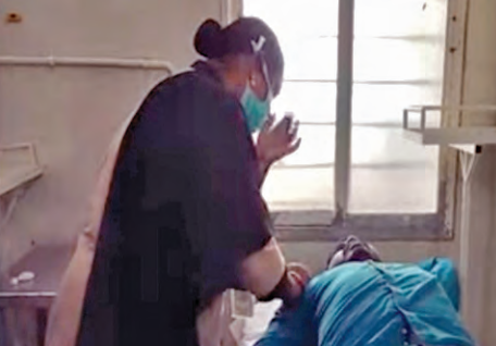
వైద్యుగా ఉండాలని, అందుకే వారికి డిగ్రీ లేదు కాబట్టి డిమాండ్ చేశామంటున్నారు.