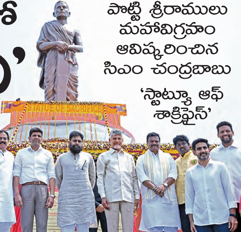
సోమవారం పోటీ శ్రీరాములు విగ్రహవిష్కరణ కార్యక్రమంలో పాల్గొన్న సీఎం చంద్రబాబు, డి.సిఎం పవన్, మంత్రులు, తదితరులు

విజయవాడ, మార్చి 16, ప్రభాతవార్త ప్రతినది: తెలుగువారి కోసం ప్రత్యేక రాష్ట్రం ఏర్పాటుకు ప్రాణాలను అర్పించిన అమరజీవి త్యాగం చరిత్ర పుటల్లో వెరగని ముద్రగా నిలిచిందని సీఎం చంద్రబాబు నాయుడు వ్యాఖ్యానించారు. ఛాబా, సాంస్కృతికపరంగా తెలుగువారి ఘనతను ప్రపంచానికి చాటింది అమరజీవి శ్రీరాములు అన్నారు. అమరావతిలో అమరజీవి 125వ జయంతి సందర్భంగా 'స్టాట్యూ ఆఫ్ శాక్రీఫైజ్' పేరిట ఏర్పాటు చేసిన 58 ఆడుగుల విగ్రహం వివరణ ఒక చరిత్రగా నిలిచిపోతుందని అభివర్ణించారు. పోటీ