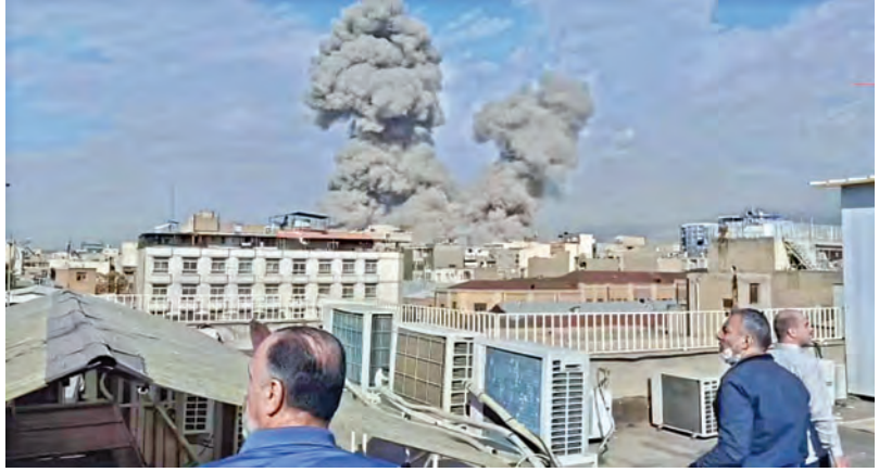
సోమవారం ఇరాన్ ఛాబహార్ ఎయిర్పోర్టుపై దాడితో దగ్ధమవుతున్న భవనాలు