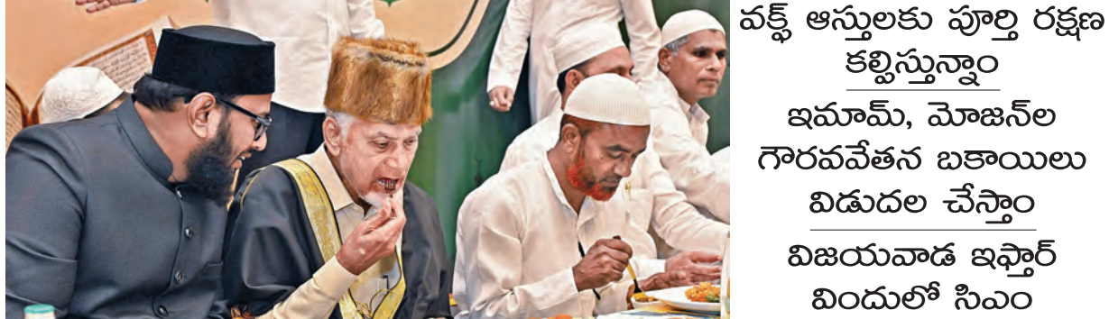
సోమవారం విజయవాడలో జరిగిన ఇఫ్తార్ విందులో పాల్గొన్న సీఎం చంద్రబాబు

విజయవాడ మార్చి 16, ప్రభాతవార్త ప్రతినది: ఇమామ్, మోజానీల ఇచ్చే గౌరవ వేతన బకాయిలు రూ.45 కోట్లు వెంటనే విడుదల చేస్తామని ముఖ్యమంత్రి చంద్రబాబు నాయుడు స్పష్టం చేశారు. అమరావతిలో నూతనంగా హజ్ హాస్ నిర్మిస్తున్న హామీ ఇఫ్తార్. కూలీల ప్రభుత్వం అధికారంలోకి వచ్చిన ముస్లింలకు 21 నెలల్లో అనేక సంక్షేమ పథకాలు అందించిన వివరాలు తెలిపారు. విజయవాడలోని ఏ షన్ కన్వెన్షన్ లో ప్రభుత్వం తరఫున ఇఫ్తార్ విందుకు ముఖ్యమంత్రి చంద్రబాబు పాల్గొన్నారు. ఈ సందర్భంగా ప్రాసెస్లో పాల్గొన్నారు. ముస్లింలకు రంజాన్ శుభాకాంక్షలు తెలియజేశారు. ఈ సందర్భంగా ముఖ్యమంత్రి ముఖ్తాబుతూ కడవంటి అనంతరంగా ఉన్న హజ్ హాస్ త్వరలో అందుబాటులోకి తీసుకొస్తామన్నారు. పవిత్ర రంజాన్ మాసంలో కఠోర ఉపవాస దీక్ష చేసిన ముస్లిం నిర్మిస్తున్న హామీ ఇఫ్తార్. కూలీల ప్రభుత్వం అధికారంలోకి వచ్చిన ముస్లింలకు 21 నెలల్లో అనేక సంక్షేమ పథకాలు అందించిన వివరాలు తెలిపారు. విజయవాడలోని ఏ షన్ కన్వెన్షన్ లో ప్రభుత్వం తరఫున ఇఫ్తార్ విందుకు ముఖ్యమంత్రి చంద్రబాబు పాల్గొన్నారు. ఈ సందర్భంగా ప్రాసెస్లో పాల్గొన్నారు. ముస్లింలకు >>2