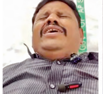
అయితే కాంట్రాక్టరు మాత్రమే సూతనంగా వచ్చిన నిబంధన ప్రకారం డిగ్రీ ఉంటేనే సూపర్

వచ్చారు. దీనితో కాంట్రాక్టరు కక్షగట్టి వీరిని సూపర్వైజర్ స్థాయి నుండి గార్డుగా మార్చారని భాధితులు ఆరోపిస్తున్నారు. ఈ విషయాన్ని పలుమార్లు సూపరింటెండ్లతో, డి.సి.సి. కూడా తెలిపాము, కాని స్పందించలేదు. చివరకు ఇతర జిల్లా అయిన తిరుపతిలో బదిలీ చేస్తున్నామని చెప్పారు. అయితే నిబంధన ప్రకారం బదిలీ చేయడానికి రూల్స్ ఒక్కోఫు, దీంతో కాంట్రాక్టరు నిలదీయగా పనిచేయ ఆర్యారు. దీనితో తాము ముగ్గురు సెల్ఫీ వీడియో తీసుకుని ఫిర్యాదుల తాగామని ఆసుపత్రిలో చికిత్స పొందుతూ వాపోయాం. ప్రస్తుతం ముగ్గురికి చికిత్స అందిస్తున్నారు. వారి పరిస్థితి నిలకడగా ఉంది.