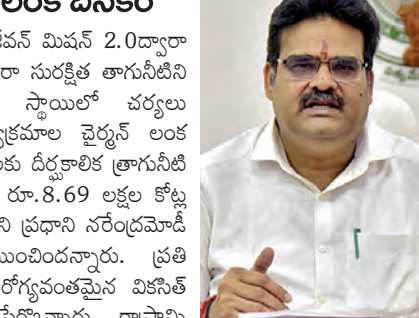
అరోగ్యవంతమైన స్వర్ణాంధ్రగా అభివృద్ధి చేయాలని ముఖ్యమంత్రి నారా చంద్రబాబు నాయుడు లక్ష్యంగా పెట్టుకున్నారని ఆయన తెలిపారు. గతంలో జరిగిన లోపాలను సరిదిద్దుతూ జిల్లా జీవన్ మిషన్ 2.0వార్షిక గ్రామీణ ప్రాంతాల్లో దీర్ఘకాలిక నీటి వనరులు, నిల్వలు, శుద్ధి వ్యవస్థలు, సైబిలైన్ మౌలిక సదుపాయాలు ఏర్పాటు చేసి 2028డిసెంబర్ నాటికి ప్రతి గ్రామీణ కుటుంబానికి సురక్షిత త్రాగునీరు అందించాలనే లక్ష్యంతో ప్రభుత్వం ముందుకు సాగుతుందని చెప్పారు. గ్రామీణ ప్రాంతాల్లో తాగునీటి మౌలిక సదుపాయాలు మెరుగుపడటం వల్ల ఆరోగ్యం, పరిశుభ్రత, మహిళా గౌరవం, పిల్లల విద్య, గ్రామీణ జీవనోపాధి అవకాశాలు కూడా గణనీయంగా మెరుగుపడతాయని ఆయన తెలిపారు. జిల్లా జీవన్ మిషన్ 2.0వార్షిక సమగ్ర ప్రభుత్వ విధానంతో గ్రామీణ నీటి సరఫరా వ్యవస్థను స్థిరంగా, దీర్ఘకాలికంగా నిర్వహించే దిశగా చర్యలు తీసుకుంటున్నామని వివరించారు.

నవవాలయం, మార్చి 16 ప్రభాతవార్త: జిల్లా జీవన్ మిషన్ 2.0వార్షిక గ్రామీణ ప్రాంతాల్లో ప్రతి ఇంటికి కూడా ద్వారా సురక్షిత తాగునీటిని అందించేందుకు కేంద్ర ప్రభుత్వం భారీ స్కాలర్లను పంపిస్తూ తీసుకుంటుంది 20సూత్రాల అమలు కార్యక్రమం చైర్మన్ లంక దినకర్ తెలిపారు. దేశవ్యాప్తంగా గ్రామీణ ప్రజలకు దీర్ఘకాల త్రాగునీటి మౌలిక సదుపాయాలు కల్పించేందుకు మొత్తం రూ.8,69 లక్షల కోట్ల వ్యయంతో ఈ కార్యక్రమాన్ని అమలుచేయాలని ప్రధాని నరేంద్రమోడీ నాయకత్వంలోని కేంద్ర ప్రభుత్వం నిర్ణయించింది. ప్రతి కుటుంబానికి సురక్షిత త్రాగునీరు అందించి ఆరోగ్యవంతమైన వికీసెట్ భారత్ నిర్మాణమే ఈ పథకం లక్ష్యమని పేర్కొన్నారు. రాష్ట్రాన్ని ఆరోగ్యవంతమైన స్వర్ణాంధ్రగా అభివృద్ధి చేయాలని ముఖ్యమంత్రి నారా చంద్రబాబు నాయుడు లక్ష్యంగా పెట్టుకున్నారని ఆయన తెలిపారు. గతంలో జరిగిన లోపాలను సరిదిద్దుతూ జిల్లా జీవన్ మిషన్ 2.0వార్షిక గ్రామీణ ప్రాంతాల్లో దీర్ఘకాలిక నీటి వనరులు, నిల్వలు, శుద్ధి వ్యవస్థలు, సైబిలైన్ మౌలిక సదుపాయాలు ఏర్పాటు చేసి 2028డిసెంబర్ నాటికి ప్రతి గ్రామీణ కుటుంబానికి సురక్షిత త్రాగునీరు అందించాలనే లక్ష్యంతో ప్రభుత్వం ముందుకు సాగుతుందని చెప్పారు. గ్రామీణ ప్రాంతాల్లో తాగునీటి మౌలిక సదుపాయాలు మెరుగుపడటం వల్ల ఆరోగ్యం, పరిశుభ్రత, మహిళా గౌరవం, పిల్లల విద్య, గ్రామీణ జీవనోపాధి అవకాశాలు కూడా గణనీయంగా మెరుగుపడతాయని ఆయన తెలిపారు. జిల్లా జీవన్ మిషన్ 2.0వార్షిక సమగ్ర ప్రభుత్వ విధానంతో గ్రామీణ నీటి సరఫరా వ్యవస్థను స్థిరంగా, దీర్ఘకాలికంగా నిర్వహించే దిశగా చర్యలు తీసుకుంటున్నామని వివరించారు.