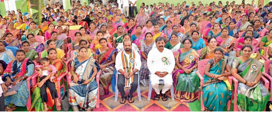
ధర్మవరం మున్సిపల్ కౌన్సిల్ పాలకవర్గ సభ్యులు, అధికారులు, సిబ్బందితో మంత్రి సత్యకుమార్ యాదవ్

పట్టణ శివారు ప్రాంతాల్లో గతంలో సరైన రహదారులు లేకపోవడం, విద్యుత్ సరఫరా కొరత వంటి సమస్యలు తీవ్రంగా ఉండేవని పేర్కొన్నారు. అయితే ప్రస్తుతం కొత్త రహదారులు నిర్మించడం, విద్యుత్ సరఫరా ఏర్పాటు చేయడం వంటి అభివృద్ధి పనులను మున్సిపల్ కౌన్సిల్ ద్వారా విజయవంతంగా పూర్తి చేశామని తెలిపారు. పట్టణంలో పెరుగుతున్న విద్యుత్ వినియోగాన్ని దృష్టిలో ఉంచుకుని విద్యుత్ వ్యవస్థను బలోపేతం చేయడానికి సుమారు రూ.110 కోట్ల ప్రత్యేక ప్రాజెక్టును చేపట్టామని మంత్రి తెలిపారు. ఈ క్రమంలో కొత్త ఇంజిన్ నడిపేసామని ఏర్పాటు చేయడానికి నిధులు మంజూరు చేసినట్లు తెలిపారు. దీని పట్ల వోల్టేజీ సమస్యలు తగ్గి తాగునీటి సరఫరా వ్యవస్థ కూడా మరింత సమర్థవంతంగా పనిచేస్తుందని వెల్లడించారు. రవాణా, ట్రాఫిక్ సమస్యలను పరిష్కరించేందుకు కేంద్ర ప్రభుత్వం అమలు చేస్తున్న సీమ్స్ బంధన్ స్కీమ్ వగైరా కింద మంజూరు చేసిన షేడర్ల నిర్మాణ పనులను వేగవంతం చేస్తున్నామని తెలిపారు. ఈ ప్రాజెక్టుకు సంబంధించి చాలా