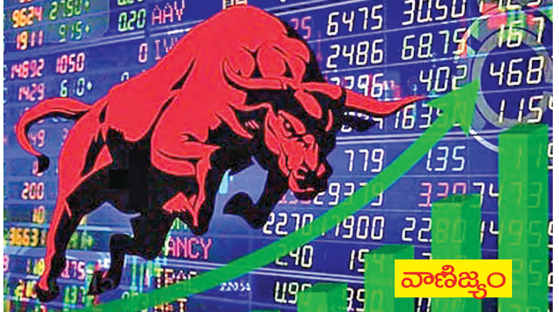
కంపెనీలు మాత్రం స్థిరంగా కొనసాగాయి. విదేశీ కరెన్సీ మార్కెట్ కొంట్రాస్ట్ దాడుతో భారత్ రూపాయి మారకం విలువలు 92.40 కి చేరింది. అంతకుముందులో 92.30వద్ద

ముంబయి, మార్చి 16: పరుగునెక్కలతో ఊగిసలాడిన సెన్సెక్స్, సెస్టిలు వారం ప్రారంభంలో లాభాల్లో ముగిసాయి. ఓపిక ముద్రాపాత్ర్యం ఉద్ధాత్తుల కొనసాగుతున్న ఎంపికచేసిన రంగంలో కొనుగోళ్లతో సూచిలు రచ్చ తీసాయి. బిఎస్ఎ సెన్సెక్స్ పెరిగి 23,408.80కి చేరింది. గడచిన మూడు సెషన్లలో సెన్సెక్స్ 4.85శాతం, సెస్టి 4.57శాతం వృద్ధిని క్షీణించింది. హెచ్ఎఫ్ఎస్ బ్యాంకు 2.88శాతం, ఎస్ఎస్ఎలబిబ్యాంకు 1.49శాతం, రిలయన్స్ 1.05శాతం వృద్ధిని రచ్చతీసాయి. బిఎస్ఎ 150 మిడిక్యాపిసూపి 0.42శాతం, స్కాల్స్కోవ్ 205 సూపి 0.47శాతం వృద్ధిని క్షీణించాయి. మార్కెట్లవరంగా బిఎస్ఎలో 1470 షేర్లు పెరిగాయి. 2910 షేర్లు క్షీణించాయి. 169