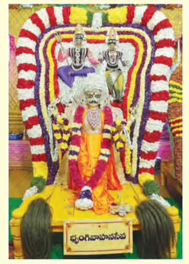
శ్రీశైలంపాక్షే, మార్చి 16, ప్రభాతవార్త: ఆంధ్రప్రదేశ్ జ్యోతిర్లింగ శ్రీశైలం మహా పుణ్యక్షేత్రంలో ఐదోరోజులపాటు జరిగే ఉగాది మహోత్సవాలు సోమవారంనాడు ఆగమశాస్త్రం