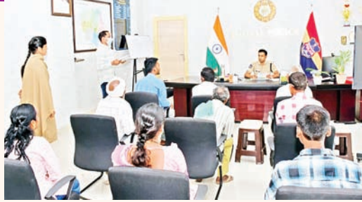
బాధితులకు న్యాయం చేయాలని ఆదేశించారు. జరుగుతోందని తెలిపారు. ప్రజలకు పోలీస్ శాఖను మరింత చేరువ

ప్రజల సౌకర్యార్థం నిర్వహించే గ్రీవెన్స్ డే లో బాగంగా సోమవారం జిల్లా పోలీసు కార్యాలయంలో జిల్లాలోని వివిధ ప్రాంతాల నుండి వచ్చిన 14 మంది అడ్మినిస్ట్రేటర్లతో నేరుగా మాట్లాడి వారి సమస్యలను తెలుసుకొని సంబంధిత అధికారులతో ఫోన్ లో మాట్లాడి ఫిర్యాదులపై తక్షణ చర్యలు తీసుకొని