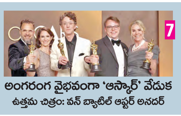
అంగరంగ వైభవంగా 'అనారాగ' వేడుక ఉత్తమ చిత్రం: వన్ బ్యాటిల్ ఆఫ్ అనదర్

Published from Khammam, Hyderabad, Vijayawada, Visakhapatnam, Rajahmundry, Guntur, Nizamabad, Ongole, Warangal, Tirupathi, Kadapa, Kurmool, Anantapur, Karimnagar, Mahabubnagar, Nellore, Nalgonda, Tadepalligudem, Srikakulam