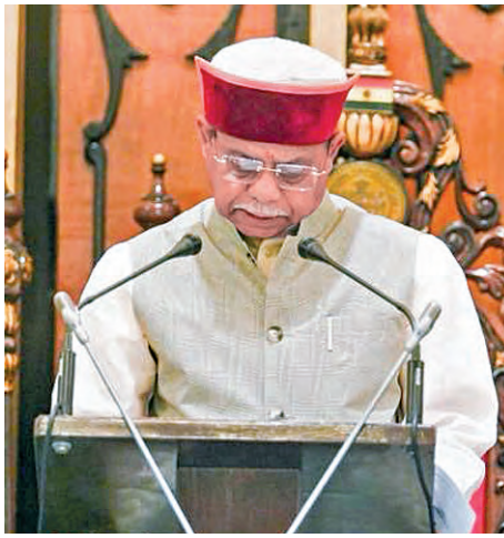
సోమవారం అసెంబ్లీలో ఉభయసభలను దృశ్యపరిచి ప్రసంగిస్తున్న గవర్నర్ శివప్రతాప్ శుక్లా

ప్రభాతవార్ ప్రధాన ప్రతినిధి, హైదరాబాద్, మార్చి 16: తెలంగాణ రాష్ట్ర అసెంబ్లీ బడ్జెట్ సమావేశాలు ఈనెల 30 వరకు సాగనున్నాయి. ఈ నెల 20న రాష్ట్ర బడ్జెట్ను ప్రవేశపెట్టనున్నారు. 17.18 టేబిల్ లో గవర్నర్ ప్రసంగంపై ధన్యవాద తీర్మానంపై >>2