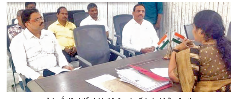
డిప్యూటీ కమిషనర్ సరస్వతిని విచారణ చేస్తున్న ఎసిబి అధికారులు

హైదరాబాద్ (సూర్యనగర్), మార్చి 16, ప్రభావం: అవినీతి అక్రమాల నేపథ్యంలో జిహెచ్ఎస్ఐ పరిధిలోని బడంగ్ పేట్ సర్కిల్ కార్యాలయంలో నోమూరం అవినీతి నిరోధక శాఖ విచారణ జరిపింది. ఇటీవల జరిగిన గ్రేటర్ హైదరాబాద్ మున్సిపల్ కార్పొరేషన్ పునర్విభజనలో భాగంగా కొత్తగా ఏర్పాటైన శంషాబాద్ జోన్ లో పరిధి కిందకు వచ్చిన ఈ బడంగ్ పేట్ సర్కిల్లో 15 మందితో కూడిన ఎసిబి బృందం విచారణకు వచ్చింది. జిహెచ్ఎస్ఐలో వీలిన అయ్యే ముందు బడంగ్ పేట్ మున్సిపల్ కార్పొరేషన్ గా కొనసాగుతున్న సమయంలో అధికంగా పనులు చేసినట్లు చూపించడం.. పనులు చేయకున్నా పెద్ద మొత్తంలో బిల్లులు పెట్టి భారీ ఎత్తున నిధులు మంజూరు చేయించి అవినీతి, అక్రమాలకు పాల్పడ్డారని వచ్చిన ఫిర్యాదులకు ఎసిబి స్పందించింది. చేయని పనులకు నిధులు దుర్వినియోగం చేయడమే కాకుండా ఇంకా మున్సిపల్ పెట్టి గ్రేటర్ లో వీలిన అయ్యే తర్వాత బడంగా మంజూరు కోసం జిహెచ్ఎస్ఐకి ఆమోదం కోసం పంపడంపై కూడా బడంగ్ పేట్ సర్కిల్ పై ఫిర్యాదులు వచ్చాయి. ఇంజనీరింగ్ విభాగంలో పాటు టౌన్ ప్లానింగ్ అవినీతి అక్రమాలపై ఫిర్యాదులు రాగా ఎసిబి హైదరాబాద్ సీటీ రెవెన్యూ అధికారులు ప్రయత్నాలు చేశారు. డిప్యూటీ కమిషనర్తో ఫోన్ చేయించినా ఎసిబి అందుబాటులోకి రాలేదు. అయితే బడంగ్ పేట్ లో జరిగిన భారీ అవినీతి అక్రమాలపై నిజా నిజాలు రాబట్టడానికి చేపట్టిన ఎసిబి విచారణ సుదీర్ఘంగా సాగింది. ఉదయం ప్రారంభమైన దర్భాస్థుల సాయంత్రం వరకు కూడా కొనసాగుతూనే ఉండడం గమనార్హం.