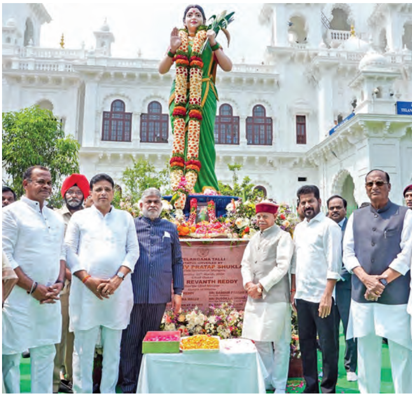
అసెంబ్లీ ఆవరణలో తెలంగాణ తల్లి విగ్రహాన్ని ఆవిష్కరించిన గవర్నర్ శుక్లా. చిత్రంలో స్పీకర్ గడ్డం ప్రసాద్ కుమార్, మండలి చైర్మన్ గుత్తా, సిఎం రేవంత్, మంత్రులు శ్రీధర్ బాబు, కోమటిరెడ్డి తదితరులు