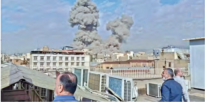
సోమవారం ఇరాన్ లోని చాబహర్ పోర్టు సీట్ పై ఇజ్రాయేల్, యుఎస్ బాంబుదాడి దృశ్యం

హైదరాబాద్, మార్చి 16: ప్రభాతవార్ ప్రజాపాలన సూక్ష్మత మార్గదర్శకం పొందుతూ ప్రతిపాడు అభివృద్ధిలో భాగస్వామిగా ఉండేలా, ప్రతి వర్గానికి అభివృద్ధి ఫలాలు అందేలా రాష్ట్ర ప్రభుత్వం బడ్జెట్ ఉండబోతుందని తెలంగాణ గవర్నర్ శివప్రతాప్ శుక్లా ప్రకటించారు. తెలంగాణ అసెంబ్లీ బడ్జెట్ సమావేశాల ప్రారంభం సందర్భంగా సోమవారం అసెంబ్లీలో ఉభయసభలలో ప్రాతినిధ్యం వహించే శాసనసభ్యులు, శాసనమండలి సభ్యులను ఉద్దేశించి గవర్నర్ ఎన్.టి.కె. రామారావు, హిందీ, ఆంగ్లంలో ప్రసంగించారు. "2047-తెలంగాణ రోడ్" దిశగా మనం >>2