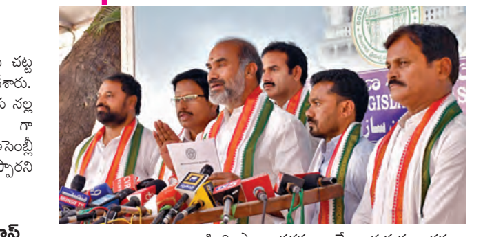
గవర్నర్ తో అన్నీ అబద్ధాలే పలికించారు

గవర్నర్ ప్రసంగంలో ప్రజల ప్రధాన సమస్యలపై సున్నమైన హామీలు కనిపించలేదని సీపీఐ నాయకులు కూనంనేని సోబాజివ తప్పు అన్నారు. అసెంబ్లీ మీడియా పాయింట్ వద్ద ఆయన మాట్లాడుతూ గవర్నర్ ప్రసంగం మూడు భాషల్లో ఉన్నా.. అందులో ప్రజల ప్రధాన సమస్యలపై సున్నమైన హామీలు లేవన్నారు. బడ్జెట్ సమావేశాలు ప్రజల సమస్యలకు పరిష్కారం చూపేలా ఉండాలని ఆశాభావం వ్యక్తం చేశారు. సరైవేమ పథకాలు అధికారులు ప్రయత్నాలు చేశారు. డిప్యూటీ కమిషనర్తో ఫోన్ చేయించినా ఎసిబి అందుబాటులోకి రాలేదు. అయితే బడంగ్ పేట్ లో జరిగిన భారీ అవినీతి అక్రమాలపై నిజా నిజాలు రాబట్టడానికి చేపట్టిన ఎసిబి విచారణ సుదీర్ఘంగా సాగింది. ఉదయం ప్రారంభమైన దర్భాస్థుల సాయంత్రం వరకు కూడా కొనసాగుతూనే ఉండడం గమనార్హం.