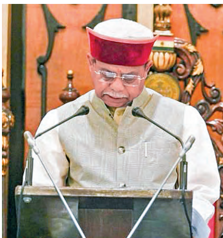
సోమవారం అసెంబ్లీలో ఉభయసభలను ద్వైవిధ్యం ప్రసంగిస్తున్న గవర్నర్ శివప్రతాప్ శుక్లా

ప్రభాతవార్ ప్రధాన ప్రతినిధి, హైదరాబాద్, మార్చి 16: తెలంగాణ రాష్ట్ర అసెంబ్లీ బడ్జెట్ సమావేశాలు ఈనెల 30 వరకు సాగనున్నాయి. ఈ నెల 20న రాష్ట్ర బడ్జెట్ను ప్రవేశపెట్టనున్నారు. 17.18 టేబిల్లో గవర్నర్ ప్రసంగంపై ధన్యవాద తీర్మానంపై >>2