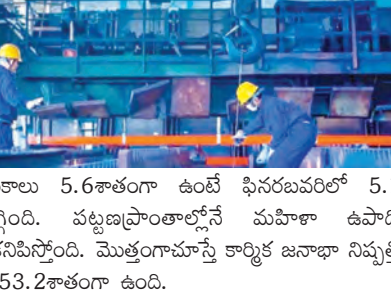
ఉపాధి గణాంకాలు 5.6శాతంగా ఉంటే ఫిసరబవరిలో 5.1 శాతానికి తగ్గింది. పట్టణప్రాంతాల్లోనే మహిళా ఉపాధి తగ్గుతున్నట్లు కనిపిస్తోంది. మొత్తంగానూ కార్మిక జనాభా నిష్పత్తి ఫిసరబవరిలో 53.2శాతంగా ఉంది.

తమోతగానే ఉన్నాయి. కార్మికశక్తి భాగస్వామ్యరేటు ఎల్ఎస్ఐఆర్ 15 ఏళ్లకుపైబడిన వారి ఉపాధి 55.9శాతంగానే ఉంది. ఇక గ్రామీణ ప్రాంతాలు, పట్టణప్రాంతాల్లో వరుసగా 15 ఏళ్లకుపైబడిన వారు 58.7శాతం, 55.9శాతంగా ఉంది. మహిళా కార్మికశక్తి ఉపాధి లభి 15 ఏళ్లకుపైబడినవారిలో 35.3శాతంగా ఉంది. గ్రామీణ పట్టణప్రాంతాల్లోనూ అలాగే ఉంది. జనవరిలో మహిళల