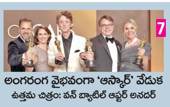
అంగరంగ వైభవంగా 'అస్సార్' వేడుక ఉత్తమ చిత్రం: వన్ బ్యాటిల్ ఆఫ్ అనదర్