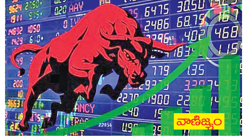
కంపెనీలు మాత్రం స్థిరంగా కొనసాగాయి. విదేశీ కరెన్సీ మార్కెట్ కొంట్రాక్టుల దారితో భారత్ రూపాయి మారకం విలువలు 92.40 కి చేరింది. అంతకుముందులో 92.30వద్ద

సెన్సెక్స్, నిఫ్టీలో షేర్ల ర్యాలీ ముంబయి, మార్చి 16: వరుసనష్టాలతో ఊగిన లాడిన సెన్సెక్స్, నిఫ్టీలు వారం ప్రారంభంలో లాభాలతో ముగిసాయి. ఓపకల్ప మద్దప్రొత్తం ఉద్దేశ్యాల కొనుగోళ్లతో సూటిలు ర్యాలీ తీసాయి. బిఎస్ఎ సెన్సెక్స్ 938.93 పాయింట్లుపెరిగి 75,502.85కి చేరింది. నిఫ్టీ 50 సూబీ కూడా 257.70 పాయింట్లు పెరిగి 23,408.80కి చేరింది. గడచిన మూడు సెషన్లలో సెన్సెక్స్ 4.85శాతం, నిఫ్టీ 4.57శాతంవృద్ధి చెందింది. హెడ్మిఎస్సీ బ్యాంకు 2.88శాతం, ఐసీఐసిఐబ్యాంకు 1.49శాతం, రిలయన్స్ 1.05శాతం వృద్ధి చెందింది. బిఎస్ఎ 150 మిడ్క్యాప్సూబీ 0.42శాతం, స్కాల్కెస్ 205 సూబీ 0.47శాతం వృద్ధి చెందింది. మార్కెట్లో మొత్తం 1470 షేర్లు పెరిగాయి. 2910 షేర్లు క్షీణించాయి. 169