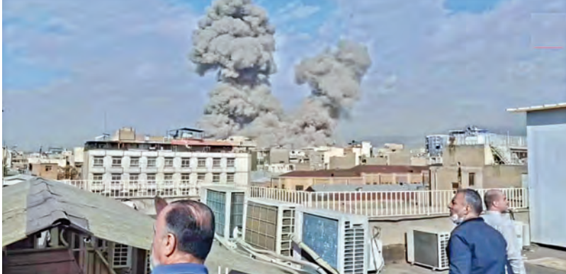
సోమవారం ఇరాన్ లోని చాబహార్ పోర్టు సెట్ పై ఇజ్రాయేల్, యుఎస్ బాంబుదాడి దృశ్యం

హైదరాబాద్, మార్చి 16: ప్రభాతవార్ ప్రజాపాలన స్ఫూర్తితో మార్గం ర్పకం పొందుతూ ప్రతిపాడు అభివృద్ధిలో భాగస్వామిగా ఉండే లా, ప్రతి వర్గానికి అభివృద్ధి ఫలాలు అందేలా రాష్ట్ర ప్రభుత్వం బడ్జెట్ ఉండబోతుందని తెలంగాణ గవర్నర్ శివప్రతాప్ శుక్లా ప్రకటించారు. తెలంగాణ అసెంబ్లీ బడ్జెట్ సమావేశాల ప్రారంభం సందర్భంగా సోమవారం అసెంబ్లీలో ఉభయసభలలో ప్రాతినిధ్యం వహించే శాసనసభ్యులు, శాసనమండలి సభ్యులను ఉద్దేశించి గవర్నర్ ఎన్సిశుక్లా తెలుగు, హిందీ, ఆంగ్లంలో ప్రసంగించారు. "2047-తెలంగాణ రోడ్" దిశగా మనం >>2