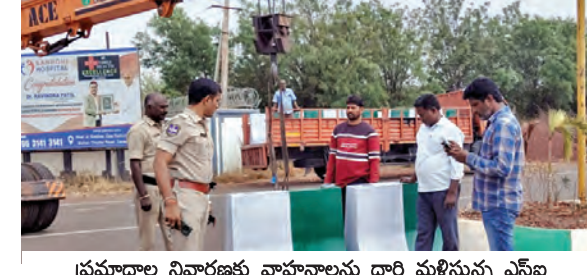
ప్రమాదాల నివారణకు వాహనాలను దారి మళ్లించు ఎన్ఐ