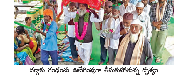
దర్గాకు గంధంను ఊరిగొప్పగా తీసుకుపోతున్న దృశ్యం