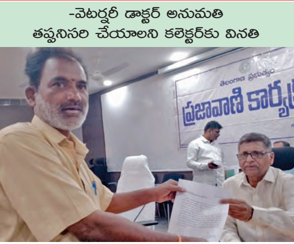
-వెటర్నరీ డాక్టర్ అనుమతి తప్పనిసరి చేయాలని కలెక్టర్ కమిషనరీ

పశువులను ఎగుమతి చేసేవిధంగా అధికారులు చర్యలు తీసుకోవాలని కోరారు. కటిక వ్యాపారులు రైతులకు అమ్మకం చేయడం వెబర్సైట్ ద్వారా చేయడంపై రైతులు పాటు ఇచ్చే గేడెలు, నాగలి నడిపే ఎద్దులను కొనుగోలు చేయడంలో టెండర్లను అడ్డుకుంటున్నారని తెలిపారు. ఈ నెల 18వ తేదీ వరకు అంగడి వేలం పాటులో పాల్గొనేవారికి నిబంధనలు కచ్చితంగా అమలుచేయాలని, ఈ విషయాన్ని మున్సిపల్ కమిషనర్ దృష్టికి తీసుకెళ్లే