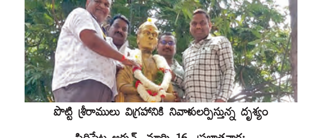
పాట్లీ శ్రీరాములు విగ్రహానికి నివాళులర్పిస్తున్న దృశ్యం