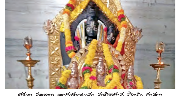
భక్తుల పూజలు అందుకుంటున్న మల్లన్నస్వామి దృశ్యం

అల్లూరు, మార్చి 16, ప్రభాతవార్త: మండలపరిషత్ లోని కామతంపల్లి గ్రామంలో వెలిసిన శ్రీమల్లన్నస్వామి ఉత్సవాలు కనులపండుగా కొనసాగుతున్నాయి. గొల్లకురుమ సంవత్సరం అధ్యక్షులలో కొనసాగుతున్న జాతరలో భాగంగా సోమవారం స్వామివారికి గ్రామమహిళలు తమ ఇళ్లనుంచి బోనాలతో గ్రామవాణి వద్దకు చేరుకుని అక్కడనుంచి బైండ్రాను చప్పుడు, గొల్లకురుమల డోలువాయి ద్వారా మధ్య మహిళలు సామూహికంగా బోనాలను ఉర్రేగిస్తూ అలలూరికి చేరుకుని స్వామివారికి బోనాలనుమర్చించి పూజాకార్యక్రమాలు నిర్వహించి మొక్కులు చెల్లించుకున్నారు. పోతురాజుల విన్నాసాలు, శివనాథుల నృత్యాలు చూపించిన ఆకట్టుకున్నారు. ఉత్సవాలకు గ్రామస్తులతోపాటు పరిసర గ్రామాలనుంచి వచ్చిన భక్తులు స్వామివారిని దర్శించుకున్నారు.