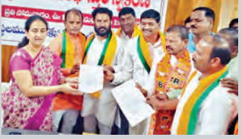
డిసికి వినిపిత్రం ఇస్తున్న బిజెపి నాయకులు ఆరు గ్యారంటీలను అమలు చేయాలి