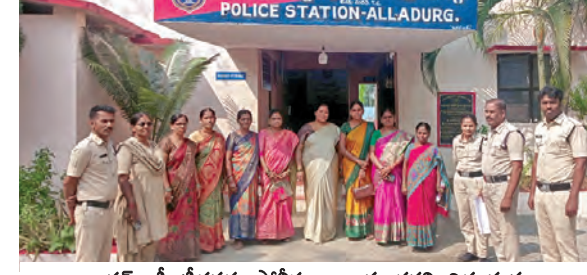
అంగన్ వాడీ టీచర్లను పోలీసు లాజికు తరలింపిన దృశ్యం

అల్లూరు, మార్చి 16, ప్రభాతవార్త: తమ న్యాయమైన డిమాండ్ల సాధన కోసం చలో హైదరాబాద్ కార్యక్రమానికి తరలివెళ్లే అంగన్ వాడీ టీచర్లు, అశాపర్వరీలు, మద్యాహ్లాభాజన వంటకం కార్మికులను అల్లూరు పోలీసులు ముందస్తుగా అదుపులోకి తీసుకుని పోలీసు లాజికు తరలించారు. తమను అక్రమంగా అరెస్టుచేయడం తగదని, ఇది ప్రజాస్వామ్యం కాదని అంగన్ వాడీ టీచర్లు, అశాపర్వరీలు, మద్యాహ్లాభాజన వంటకం కార్మికులు ఆందోళన వ్యక్తంచేశారు. ప్రజాస్వామ్యబద్ధంగా, శాంతియుతంగా తమనుమన్నలను పరిష్కరించుకునేందుకు వెళ్తుంటే పోలీసులు అడ్డుకుంటే ఇక తమనుమన్నలు ఎలా పరిష్కారం అవుతాయని ప్రశ్నించారు. తమకు చేసిన హామీలను ప్రభుత్వం వెంటనే అమలుచేయాలని డిమాండ్ చేశారు.