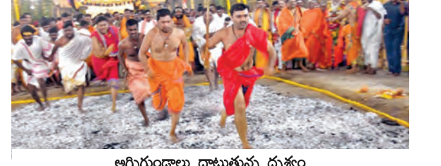
అగ్నిగుండాల దాలుతున్న దృశ్యం