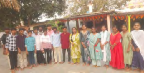
నిర్వహించారు. తొలి రోజు పరీక్షలు ప్రశాంతంగా జరిగినట్లు మండల విద్యాశాఖ అధికారి తెలియజేశారు. పరీక్ష సమయానికి ముందు విద్యార్థులు తల్లిదండ్రులు దేవాలయాలను దర్శించి పది పరీక్షలు మంచిగా రాయాలని కోరుకున్నారు.

వేలేరుపాడు, మార్చి 16 ( ప్రభాత వార్త ) : వేలేరుపాడు మండలంలో పడవ తరగతి పట్టిక పరీక్షలు సోమవారం నుండి ప్రారంభమయ్యాయి. పెద్దపల్లి ప్రకారం ప్రతిరోజు ఉదయం 9:30గంటల నుండి మధ్యాహ్నం 12గంటల 45నిమిషాల వరకు పరీక్షలు జరగనున్నాయి. మండలంలో జిల్లా పరిషత్ ఉన్నత పాఠశాల నందు ఒకే ఒక్క పరీక్ష కేంద్రాన్ని ఏర్పాటు చేశారు. ఈ పరీక్షా కేంద్రం నందు మొత్తం 136 మంది విద్యార్థులకు గాను 132 మంది హాజరుకాగా నలుగురు విద్యార్థులు గ్రెజ్షారునట్లు అధికారులు తెలియజేశారు. పరీక్షా సమయంలో ఎటువంటి మార్ ప్రాక్టీస్ జరగకుండా తొలి రోజు ఫల్యాంకి స్కూల్ ఆకస్మిక తనిఖీ చేశారు. పోలీసు సిబ్బంది హెల్ప్ డిపార్ట్మెంట్ సిబ్బంది పరీక్ష కేంద్రాల వద్ద విధులు