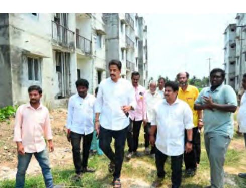
నాయకులు, కార్యకర్తలు పాల్గొన్నారు

చేసామని అనంతరం అధికారంలోకి వచ్చిన వైఎస్ఆర్ కాంగ్రెస్ పార్టీ నాయకులు మిగిలిన కనీసం 10 శాతం నిర్మాణం పూర్తి చేయలేక చేతులెత్తేసారని విమర్శించారు. గత ఐదేళ్ల వైసీపీ పరిపాలనలో జగన్మోహన్ రెడ్డి విధ్వంస పరిపాలనకు టీడోకొ ఇళ్ల నిర్మాణంపై నిదర్శనమని అన్నారు. గత ప్రభుత్వ హయాంలో దాదాపు 90 శాతం నిర్మాణం పూర్తి చేయగలగామని అన్నారు. లబ్ధిదారులకు మంజూరు చేసిన బ్యాంకు రుణాలను సైతం గత వైసీపీ పాలనలో, పక్షాధీన పట్టించారని ఆరోపించారు. ప్రస్తుతం లబ్ధిదారులు బ్యాంకు అధికారుల నుంచి తీవ్ర ఒత్తిళ్ల ఎదుర్కొంటున్నారని ఆవేదన వ్యక్తం చేశారు. తిరిగి టీడోకొ ఇళ్ల పునర్నిర్మాణం చేసి లబ్ధిదారులకు అందించాలనే లక్ష్యంతో చర్యలు చేపట్టామని అంటూ ఇచ్చారు. బ్యాంకు రుణాలను సైతం ప్రభుత్వమే చెల్లించే విధంగా చర్యలు తీసుకుంటామని అన్నారు. ఎమ్మెల్యే వెంట పలువురు కూటమి