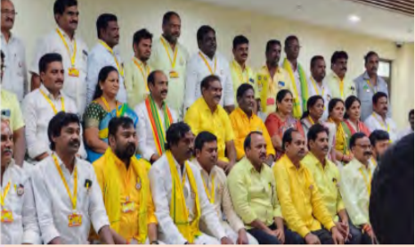
ప్రభాతవార్త - బుట్టాయిగూడెం :