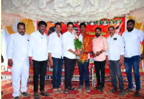
నాయకులు, కార్యకర్తలను ఎమ్మెల్యే రాధాకృష్ణ అభినందించారు. అనంతరం శ్రీనివాసును ఘనంగా సత్కరించారు ఈ కార్యక్రమంలో తెలుగుదేశం పార్టీ నాయకులు కార్యకర్తలు పెద్ద సంఖ్యలో పాల్గొన్నారు.

నిర్వహిస్తూ ప్రజా జీవితంలో బాధ్యతలను గర్భ చేస్తూ పార్టీ నిర్మాణ పునాదులను పటిష్టం చేసే విధంగా కృషి చేస్తున్నారని కొనియాడారు. భవిష్యత్తు నాయకుడు నారా లోకేశ్ నాయకత్వంలో కార్యక్రమాల నాయకులు సదుచుకునే విధంగా ప్రతి ఒక్కరూ కృషి చేయాలని చెప్పారు. ప్రతి రెండేళ్లకోసారి సంస్థాగత నిర్మాణం చేసుకుంటామని ఇటువంటి సంస్థ గత నిర్మాణంలో లోకేశ్ చేస్తున్న సూచనలను పరిగణలోకి తీసుకోవాలని సూచించారు. ముఖ్యమంత్రి చంద్రబాబు నాయుడు ఉప ముఖ్యమంత్రి పవన్ కళ్యాణ్ మంత్రి నారా లోకేశ్ ప్రధానమంత్రి నరేంద్ర మోడీ నేతృత్వంలో రాష్ట్రాన్ని అభివృద్ధి పథంలోకి తీసుకు వెళుతున్నారని చెప్పారు అభివృద్ధి ఫలాలను కైతెక్కుకోవాలే ప్రతి ఒక్కరికీ అందేలా కృషి చేయాల్సిన బాధ్యత గ్రామ మండల స్థాయి నాయకుల దయనీని సృష్టించేవారు. ఇరగవరం మండలం తెలుగుదేశం పార్టీ అధ్యక్షుడిగా బొంతు శ్రీనివాస్ ఏకగ్రీవంగా ఎన్నుకోవడంలో కృషిచేసిన