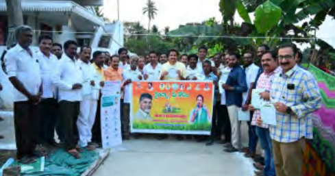
నిర్మాణం పూర్తి చేసుకుని 2027 నాటికి రాష్ట్ర ప్రజలకు నీటి ఎద్దడి లేకుండా నదుల అనుసంధానంతో సాగునీరు అందించాలని లక్ష్యంతో కూటమి ప్రభుత్వం కృషి చేస్తుందని చెప్పారు. రైతులకు లాభసాటి వ్యవసాయం కల్పించాలని ఉద్దేశంతో రైతులకు గట్టుబాటు కల్పించాలని లక్ష్యంతో లాభసాటి ఆధారిత పంటలను ప్రోత్సహిస్తూ అనేక సూచనలు చేస్తూందని అందుకు రైతులు సన్నియోగం చేసుకోవాలని కోరారు.

తణుకు, మార్చి 16 ( ప్రభాత వార్త ) : రైతు సంక్షేమం, రైతు గౌరవం, రైతు కుటుంబానికి భద్రత కల్పించే విధంగా కూటమి ప్రభుత్వం కృషి చేస్తుందని తణుకు ఎమ్మెల్యే ఆరిమిల్లి రాధాకృష్ణ అన్నారు. సోమవారం ఇరగవరం మండలం యర్రాయిరపల్లి గ్రామంలో నిర్వహించిన రైతు సమీక్షల కార్యక్రమంలో ఎమ్మెల్యే రాధాకృష్ణ పాల్గొని మాట్లాడారు. అన్నదాత సుఖిభవ ద్వారా గత ఎన్నికల్లో ఇచ్చిన హామీ మేరకు ఏటా రూ. 20 వేలు రైతుల ఖాతాలో జమ చేశామని గుర్తు చేశారు. ముఖ్యమంత్రి చంద్రబాబు నాయుడు పలువురు మేరకు ఏడ రోజులపాటు రైతు సమీక్షల కార్యక్రమం నియోజకవర్గంలోని అన్ని గ్రామాల్లో నిర్వహించడానికి ప్రణాళికలు చేశామని చెప్పారు. 2047 స్వచ్ఛాంద్ర లక్ష్యంగా రాష్ట్రాన్ని అగ్రగామిలో నిలిపే విధంగా ప్రతి రైతుకు నీటి ఎద్దడి లేకుండా నియోజకవర్గంలో అందించాలనే లక్ష్యంతో కృషి చేస్తున్నట్లు చెప్పారు. సాగునీటి కోసం పెద్ద పనులు నిధులు కేటాయింబి పంపాలని సమగ్రంగా పంపేందుకు నీటి వనరులు కల్పించే విధంగా భారీ ప్రాజెక్టు నిర్మాణం చేపట్టామని చెప్పారు. ఇప్పటికే రోజువారం 75 శాతం