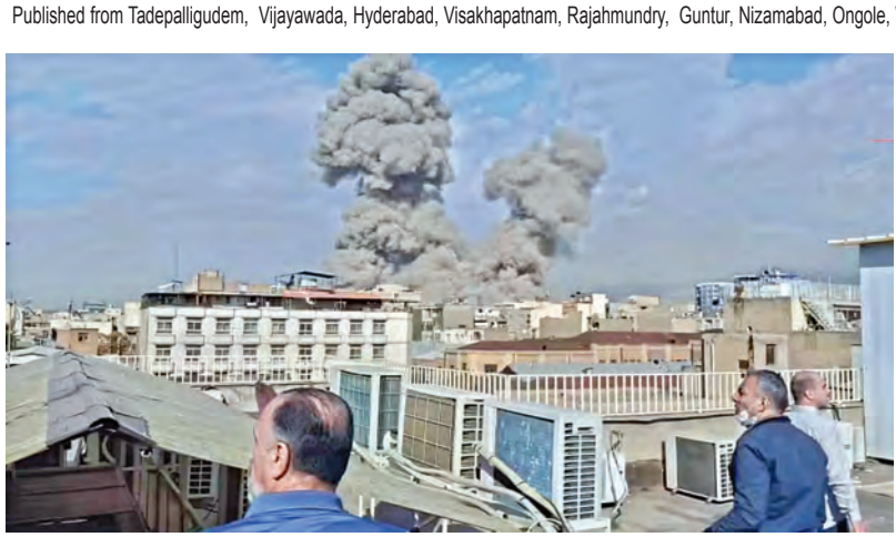
సోమవారం ఇరాన్ ఛాబహార్ ఎయిర్పోర్టుపై దాడితో దగ్ధమవుతున్న భవనాలు