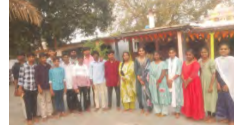
జరిగినట్లు మండల విద్యాశాఖ అధికారి తెలియజేశారు. పరీక్ష సమయానికి ముందు విద్యార్థులు తల్లిదండ్రులు దేవాలయాలు దర్శించి పది పరీక్షలు మంచిగా రాయాలని కోరుకున్నారు.

వేలేరుపాడు, మార్చి 16 (ప్రభాత వార్త) : వేలేరుపాడు మండలంలో పదవ తరగతి పరీక్ష పరీక్షలు సోమవారం నుండి ప్రారంభమయ్యాయి. షెడ్యూల్ ప్రకారం ప్రతిరోజు ఉదయం 9:30 గంటల నుండి మధ్యాహ్నం 12 గంటల 45 నిమిషాల వరకు పరీక్షలు జరగనున్నాయి. మండలంలో జిల్లా పరిషత్ ఉన్నత పాఠశాల నందు ఒకే ఒక్క పరీక్ష కేంద్రాన్ని ఏర్పాటు చేశారు. ఈ పరీక్షా కేంద్రం నందు మొత్తం 136 మంది విద్యార్థులకును 132 మంది హాజరుకాగా సలుగురు విద్యార్థులు గ్రౌండ్స్ లోని అధికారులు తెలియజేశారు. సమయంలో ఎటువంటి మార్ ప్రాక్టీస్ జరగకుండా తొలి రోజు ఫ్లయింగ్ స్కూల్స్ ఆకస్మిక తనిఖీ చేశారు. పోలీస్ సిబ్బంది హెల్త్ డిపార్ట్మెంట్ సిబ్బంది పరీక్ష కేంద్రాల వద్ద విధులు నిర్వహించారు. తొలి రోజు పరీక్షలు ప్రకాశం