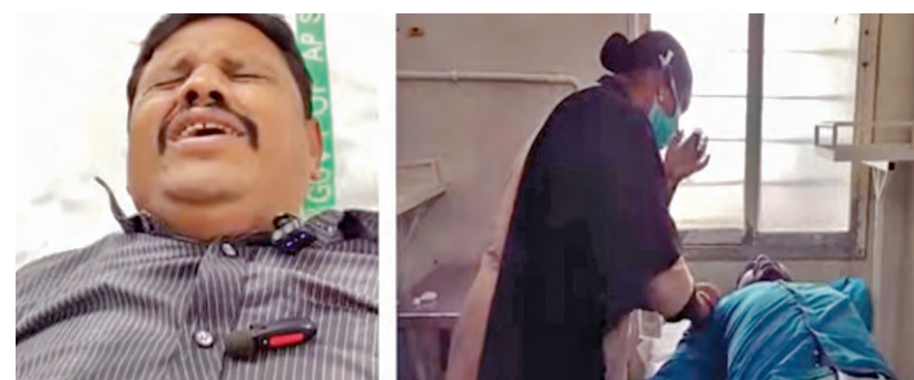
అయితే కాంట్రాక్టరు మాత్రమే సూతనంగా వచ్చిన సీనియర్ ప్రకారము డిగ్రీ ఉంటేనే సూపర్ వైజర్లు ఉండాలని, అందుకే వారికి డిగ్రీ లేదు కాబట్టి డిమాండ్ చేశామంటున్నారు.

వచ్చారు. దీనితో కాంట్రాక్టరు కళ్ళజిట్టి వీరిని సూపర్వైజర్ స్థాయి నుండి గార్డ్ గా మార్చాలని బాధితులు ఆరోపిస్తున్నారు. ఈ విషయాన్ని పలుమార్లు సూపరింటెండెంట్కు, డి.సి.కి కూడా తెలిపాము, కాని స్పందించలేదు. చివరకు ఇతర జిల్లా అయిన తిరుపతికి బదిలీ చేస్తున్నామని చెప్పారు. అయితే సీనియర్ ప్రకారము బదిలీ చేయడానికి రూల్స్ ఒప్పుకోవ్వ, దీంతో కాంట్రాక్టరు నిలదీయగా ససేమిరా అన్నారు. దీనితో తాము ముగ్గురు సెల్లో వీడియో తీసుకుని ఫిర్యాదు తాగమని ఆసుపత్రిలో చికిత్స పొందుతూ వాపోయాం. ప్రస్తుతము ముగ్గురికి చికిత్స అందిస్తున్నాం. వారి పరిస్థితి నిలకడగా ఉంది.