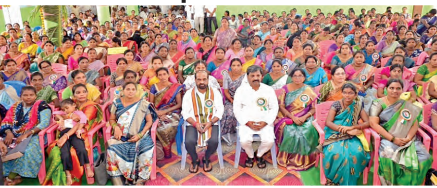
ధర్మవరం మున్సిపల్ కౌన్సిల్ పాలకవర్గ సభ్యులు, అధికారులు, సిబ్బందితో మంత్రి సత్యకుమార్ యాదవ్

వట్టణ శివారు ప్రాంతాల్లో గతంలో సరైన రహదారులు లేకపోవడం, విద్యుత్ సరఫరా కొరత వంటి సమస్యలు తీవ్రంగా ఉండేవని పేర్కొన్నారు. అయితే ప్రస్తుతం కొత్త రహదారులు నిర్మించడం, విద్యుత్ సరఫరా ఏర్పాటు చేయడం వంటి అభివృద్ధి పనులను మున్సిపల్ కౌన్సిల్ ద్వారా విజయవంతంగా పూర్తి చేశామని తెలిపారు. పట్టణంలో పెరుగుతున్న విద్యుత్ వినియోగాన్ని దృష్టిలో ఉంచుకుని విద్యుత్ వ్యవస్థను బలోపేతం చేయడానికి సుమారు రూ.110 కోట్లతో ప్రత్యేక ప్రాజెక్టును చేపట్టామని మంత్రి తెలిపారు. ఈ క్రమంలో కొత్త ఇండోర్ నెట్టింగ్ ఏర్పాటు చేయడానికి నిధులు మంజూరు చేసినట్లు తెలిపారు. దీని వల్ల వోల్టేజీ సమస్యలు తగ్గి తాగునీటి సరఫరా వ్యవస్థ కూడా మరింత సమర్థవంతంగా పనిచేస్తుందని వెల్లడించారు. రవాణా, ట్రాఫిక్ సమస్యలను పరిష్కరించేందుకు కేంద్ర ప్రభుత్వం అమలు చేస్తున్న సేతు బంధన స్కీమ్ పథకం కింద మంజూరు చేసిన షేజీవర్ నిర్మాణ పనులను చేగవంతం చేస్తున్నామని తెలిపారు. ఈ ప్రాజెక్టుకు సంబంధించి చాలా