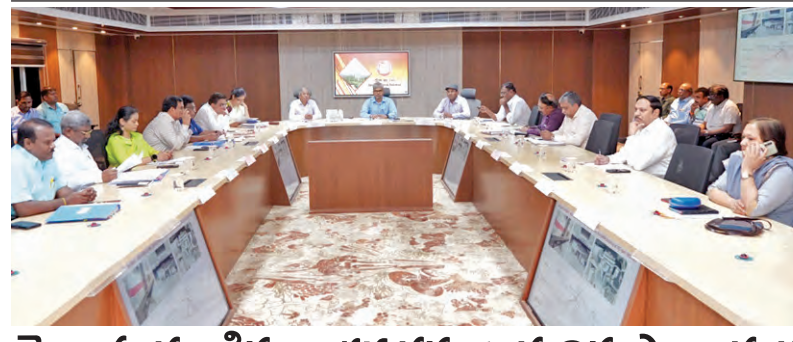
రైలు ప్రయాణికుల భద్రతకు అత్యధిక ప్రాధాన్యత

విజయవాడ, మార్చి 16 ప్రభాతవార్త ప్రతినిధి: అమరావతిలో ఏర్పాటు చేసిన అమరజీవి పొట్టి శ్రీరాములు విగ్రహంపై వైసిపి నేతలు చేస్తున్న విమర్శలు దుర్భారమని రాష్ట్ర జలవనరుల శాఖ మంత్రి నిమ్మల రామానాయుడు మండిపడ్డారు. భవిష్యత్ తరాలకు పొట్టిశ్రీరాములు త్యాగినిరతి సూర్యుని నెల వానల లక్ష్యం 58 అడుగుల కాంస్య విగ్రహాన్ని ఏర్పాటు చేశామని, ఇది ఎన్నికల హామీని నిలబెట్టు కోవడమేనని స్పష్టం చేశారు. దోపిడీ, లాంటి అలవాటుపడిన వైసిపి నేతలకు త్యాగం విలువ తెలియడం లేదని ఆయన ఎద్దేవా చేశారు. ఈ సందర్భంగా నిమ్మల రామానాయుడు మాట్లాడుతూ, జగన్మోహన్ రెడ్డి పదేళ్ల పాలనలో అర్హతవ్యూలు తీవ్రంగా సవరించారు యాదని ఆరోపించారు. ఎవరికీ సాయం చేయకుండా దీనిని జగన్ రెడ్డి కాబట్టి, కన్నతల్లిని, చెల్లిని కూడా మోసం చేశారని తీవ్ర వ్యాఖ్యలు చేశారు. గత పదేళ్లలో జగన్ ప్రభుత్వం రూ.14 లక్షల కోట్లు అడ్డగోలుగా అప్పు చేసి రాష్ట్ర ఆర్థిక వ్యవస్థను పూర్తిగా నాశనం చేసినదని మంత్రి విమర్శించారు. వెంటిలేటర్లపై ఉన్న రాష్ట్రాన్ని తాము అధికారంలోకి వచ్చాక ఐసీయూలోకి తీసుకొచ్చామని అన్నారు. గత ప్రభుత్వ తప్పిదాలను ఒక్కొక్కటిగా సరిదిద్దుకుంటూ ముందుకు వెళ్తున్నామని తెలిపారు. ప్రధానమంత్రి మోదీ సహకారంతో ముఖ్యమంత్రి చంద్రబాబు, పవన్ కల్యాణ్ రాష్ట్రంలో సౌకర్యవంతమైన ఆర్థిక వ్యవస్థను ఏర్పాటు చేసేందుకు కృషి చేస్తున్నారని నిమ్మల రామానాయుడు వివరించారు.