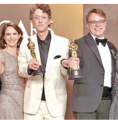
అనంద్ మడిగాన్ (వెబ్స్), యానిమేటర్ ఫీవర్: కెపిఓ డెవన్ హుట్టర్ ఉత్తమ ఫీవర్ ఫిలిమ్: సెంటిమెంటల్ వ్యాల్వూ ఉత్తమ డాక్యుమెంటరీ ఫీవర్: మిస్టర్ నోబిల్ ఎగెన్స్ పులిస్ ఉత్తమ ఓరిజినల్ సీరీస్: రాన్ క్లూగ్ (సినర్స్) ఉత్తమ అడాప్టెడ్ స్క్రీన్ ప్లే: పాల్ థామస్ (పన్ బ్యాటిల్ ఆఫ్ అనదర్) ఉత్తమ సౌండ్: ఎస్1 ఉత్తమ విజువల్ ఎఫెక్ట్: అవతార్: వైటర్ అండ్ యూని ఉత్తమ ప్రొడక్షన్ డిజైన్: ప్రాంకెస్టిన్ ఉత్తమ కాస్ట్యూమ్ డిజైన్: ప్రాంకెస్టిన్ ఉత్తమ మేకప్ హెయిస్టైలు: ప్రాంకెస్టిన్ ఉత్తమ చిత్రం: పన్ బ్యాటిల్ ఆఫ్ అనదర్ ఉత్తమ దర్శకుడు: పాల్ థామస్ అందర్నీ (పన్ బ్యాటిల్ ఆఫ్ అనదర్) ఉత్తమ నటుడు: మైఖేల్ బి జోర్డాన్ (సినర్స్) ఉత్తమ నటి: జెస్సి బజ్జీ (హామ్మెట్) సహాయనటుడు: షాన్ పిన్ (పన్ బ్యాటిల్ ఆఫ్ అనదర్)

లాస్ ఏంజెల్స్, మార్చి 16: ప్రపంచ సినీ ప్రియులు ఎంతో ఆసక్తిగా ఎదురుచూస్తున్న 98వ ఆకాడమీ అవార్డులు (ఆస్కార్ 2026) వేడుక అట్లహసంగా నిర్వహించారు. లాస్ ఏంజెల్స్ లోని డాల్బి థియేటర్లో ఈ అవార్డుల బహుళారణకు వేదిక అయింది. జాతీయ అంతర్జాతీయ చిత్రప్రముఖులు హాజరైన ఈ వేడుకల్లో ఈ ఏడాది ఉత్తమ చిత్రం "పన్ బ్యాటిల్ ఆఫ్ అనదర్" ఆస్కార్ పురస్కారాన్ని కైవసం చేసుకుంది. ఇదే చిత్రానికి దర్శకత్వం వహించిన పాల్ థామస్ అందర్నీ ఉత్తమ దర్శకుడిగా, ఇండోర్ నటనకు సీన్ పెన్ ఉత్తమ నటుడిగా, ఇండోర్ నటనకు సీన్ పెన్ ఉత్తమ నటుడిగా అవార్డులు గెలుచు కున్నారు. ఈ చిత్రానికి ఏకంగా వివిధ విభాగాల్లో ఆరు అవార్డులు దక్కాయి. "సినర్స్" చిత్రంలో అద్భుత నటనకు మైఖేల్ బి జోర్డాన్ ఉత్తమ నటుడిగా నిలవగా, "హామ్మెట్" చిత్రానికి జెస్సి బజ్జీ ఉత్తమ నటి అవార్డును అందుకున్నారు. వెబ్స్ సీ చిత్రంలో నటనకు అమీ మడిగాన్ ఉత్తమ నటనకు నటిగా ఎంపికయ్యారు. ఈనాటి పలు చిత్రాలకు అవార్డులు పంపతూ జ్యూరీ సమ ప్రాధాన్యత చూపింది. సినర్స్ చిత్రం ఉత్తమ