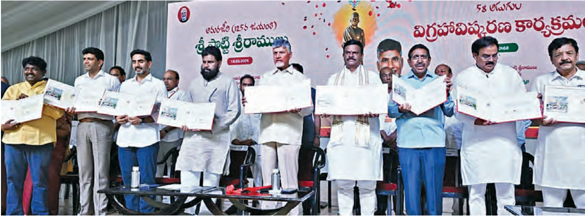
పొట్టి శ్రీరాములు స్మారక పోస్టల్ కవర్ ఆవిష్కరణను సీఎం చంద్రబాబు, డిసిఎం పవన్ కళ్యాణ్