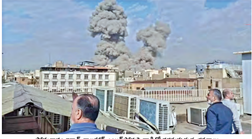
సోమవారం ఇరాన్ ఛాబహర్ ఎయిర్పోర్టుపై దాడితో దగ్ధమవుతున్న భవనాలు

17-3-2026 మంగళవారం సంపుటి: 32 సంః: 45 పేజీలు: 16 వెల: 6.50