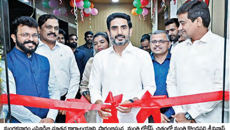
మంగళవారం ఎం.జి.డి.బి నూతన కార్యాలయాన్ని ప్రారంభిస్తున్న మంత్రి లోకేశ్. చిత్రంలో మంత్రి కొండపల్లి శ్రీనివాస్