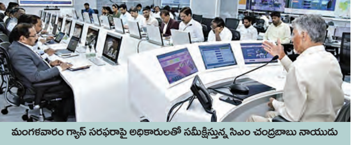
మంగళవారం గ్యాస్ సరఫరాపై అధికారులతో సమీక్షిస్తున్న సీఎం చంద్రబాబు నాయుడు

ప్రత్యామ్నాయాలపై కూడా అధ్యయనం చేయాలి హాస్టళ్లు, ఆసుపత్రులు, ఆలయాలకు పూర్తి సరఫరా ఆర్టిజిఎస్ నుంచి గ్యాస్ లభ్యతపై సీఎం చంద్రబాబు సమీక్ష